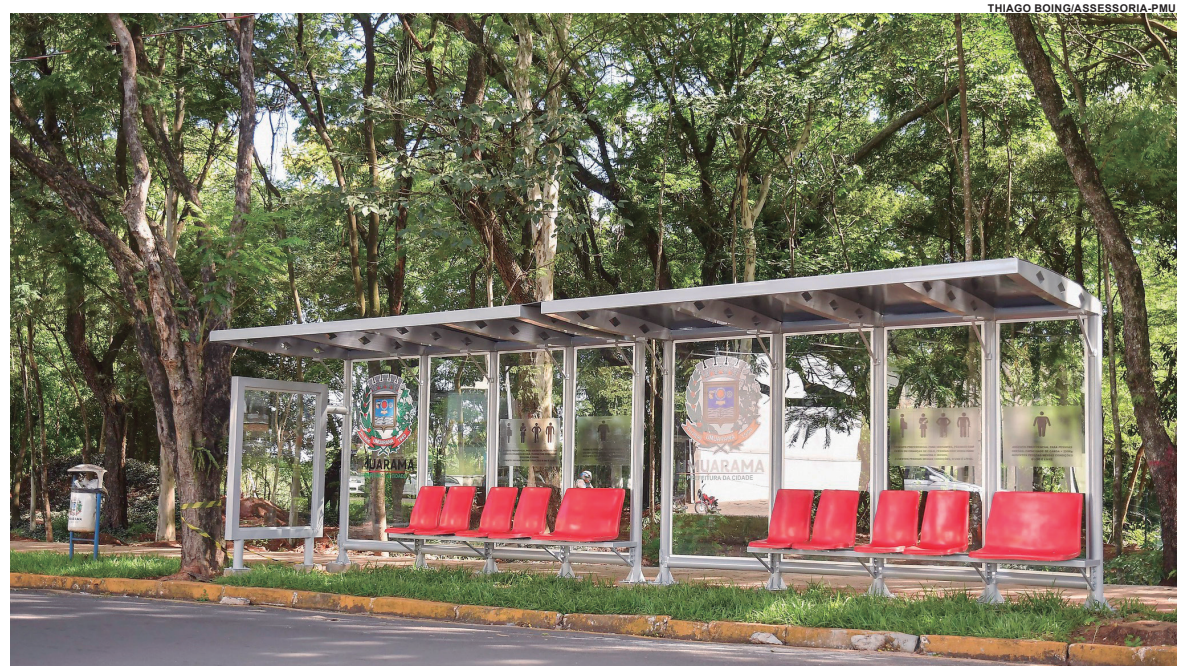
ESTRUTURA dos novos pontos são de tubos galvanizados, com fechamento em vidro temperado, com espaço publicitário e identificados com o brasão do município