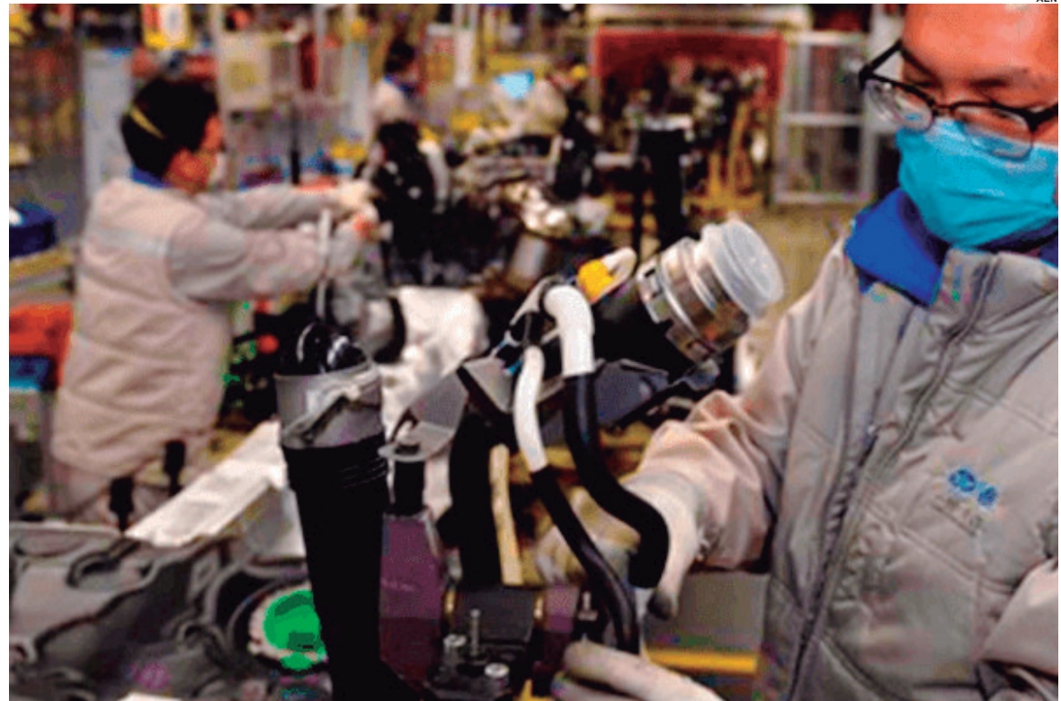
O desempenho do Paraná é fruto da estratégia adotada pelo governo, de uma postura proativa junto às empresas que ofertam vagas de emprego