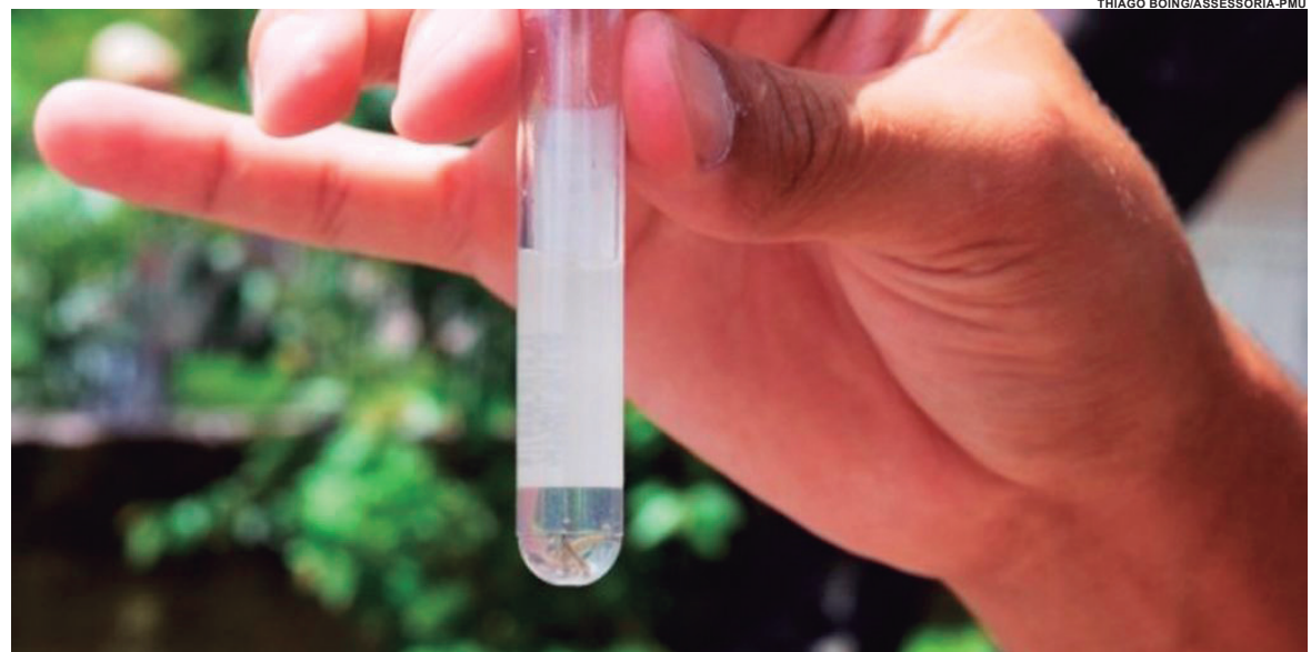
A situação mais crítica no bairro São Cristóvão, na região da Escola Municipal Malba Tahan, no Alto São Francisco, Jardim Independência e Jardim Arco-Íris

Os objetos de maior incidência para criadouros do mosquito da dengue, tendo como base de levantamento os Liraas realizados nos meses de janeiro nos últimos três anos, são os depósitos do grupo "B", que segundo o Programa Nacional de Controle da Dengue são vasos e frascos com água, pratos, pingadeiras, recipientes de degelo, bebedouros em geral e pequenas fontes ornamentais. Em janeiro de 2020 o índice foi de 2,1%, bem menor que janeiro de 2019 (3,3%) e abaixo do auferido neste ano (2,5%). Neste ano, 40%