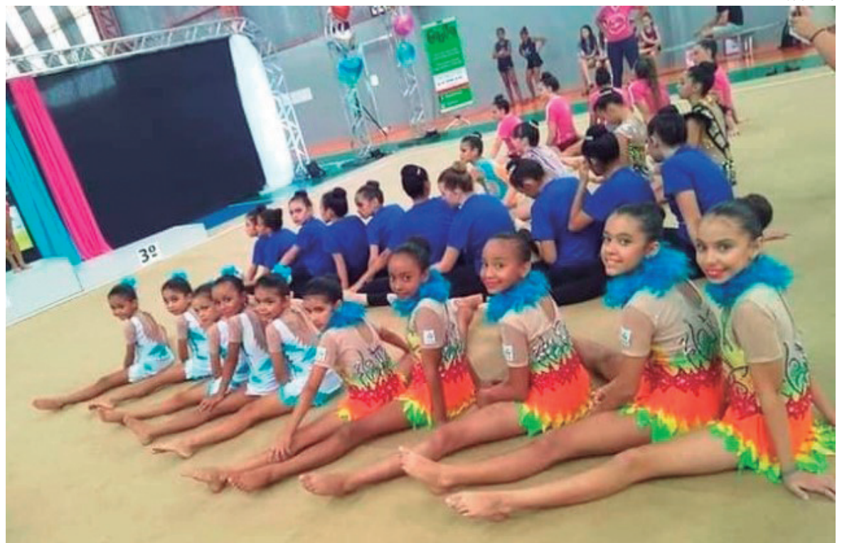
PROJETO oferecerá aulas de ginástica para crianças e adolescentes

O projeto traz ações recreativas em áreas consideradas de vulnerabilidade, acreditando que tal ferramenta possa ser utilizada como meio de educação e integração social, apresentando um resgate de brincadeiras antigas vivenciadas por inúmeras gerações. Em contrapartida, o programa é desenvolvido em sistema de contra turno social para que possa ser um eficaz meio de redução de atos infracionais praticados por crianças e adolescentes.