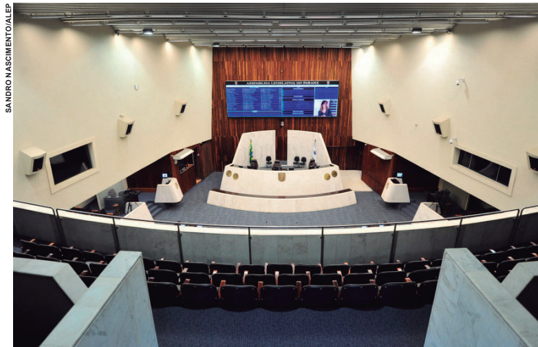
CONVOCAÇÃO foi aprovada ontem e discussão deverá acontecer até na próxima quarta-feira

Entre as alterações na Lei 20.338, no artigo 13, exclui a limitação de municípios com mais de 10 mil habitantes para participar do programa. Pela nova redação, “mu-