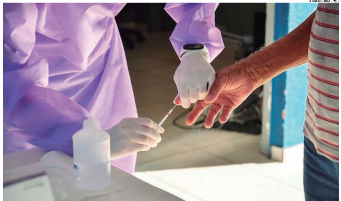
NÚMERO de óbitos permanece estável, com 67 casos registrados na cidade desde o início da pandemia

Os dados acumulados do monitoramento da covid-19 mostram que o Paraná soma 471.201 casos confirmados