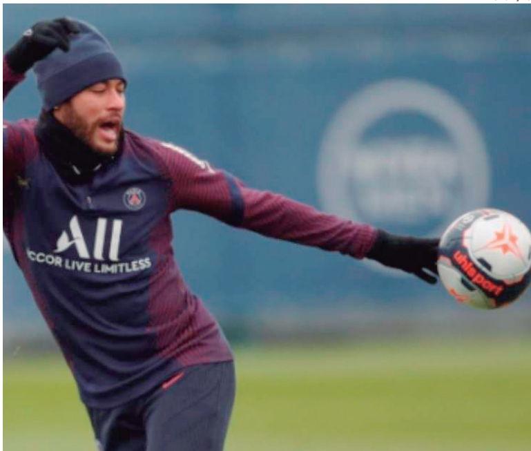
NEYMAR em treino do PSG na tarde de ontem (segunda-feira, 11)

Recuperado de uma lesão no tornozelo sofrida no dia 13 de dezembro, na derrota do Paris Saint-Germain para o Lyon, o atacante Neymar Jr. treinou com bola normalmente nesta segunda-feira no centro de treinamentos da equipe parisiense. Liberado pelo departamento médico, o camisa 10, que desde a última semana já estava correndo em volta do gramado, deve ser reforço