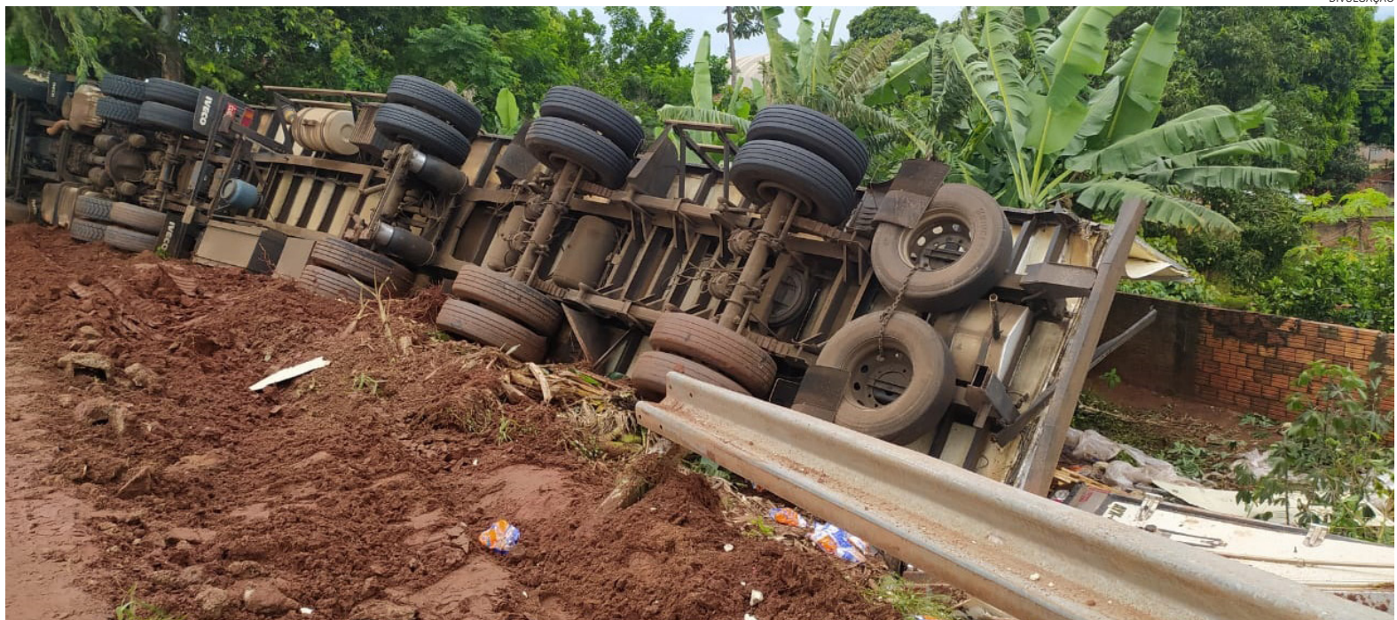
POPULARES tentam saquear carga de frango após tombamento de carreta na PR-323

A carga de filé de frango ficou espalhada devido ao estrago causado na carroceria, foi então que populares tentaram saquear a mercadoria. Uma equipe do grupo Rotam (Rondas Ostensivas) da Polícia Militar, que passava pelo local,