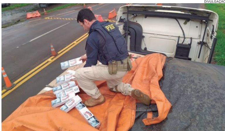
NAS duas ocasiões, motoristas abandonaram os veículos e fugiram à pé das abordagens policiais

Ao inspecionar a carga, foi constatado que os semirreboques estavam carregados com grande quantidade de caixas de cigarros de origem paraguaia. Não bastasse, a equipe ainda descobriu que todos os veículos do conjunto