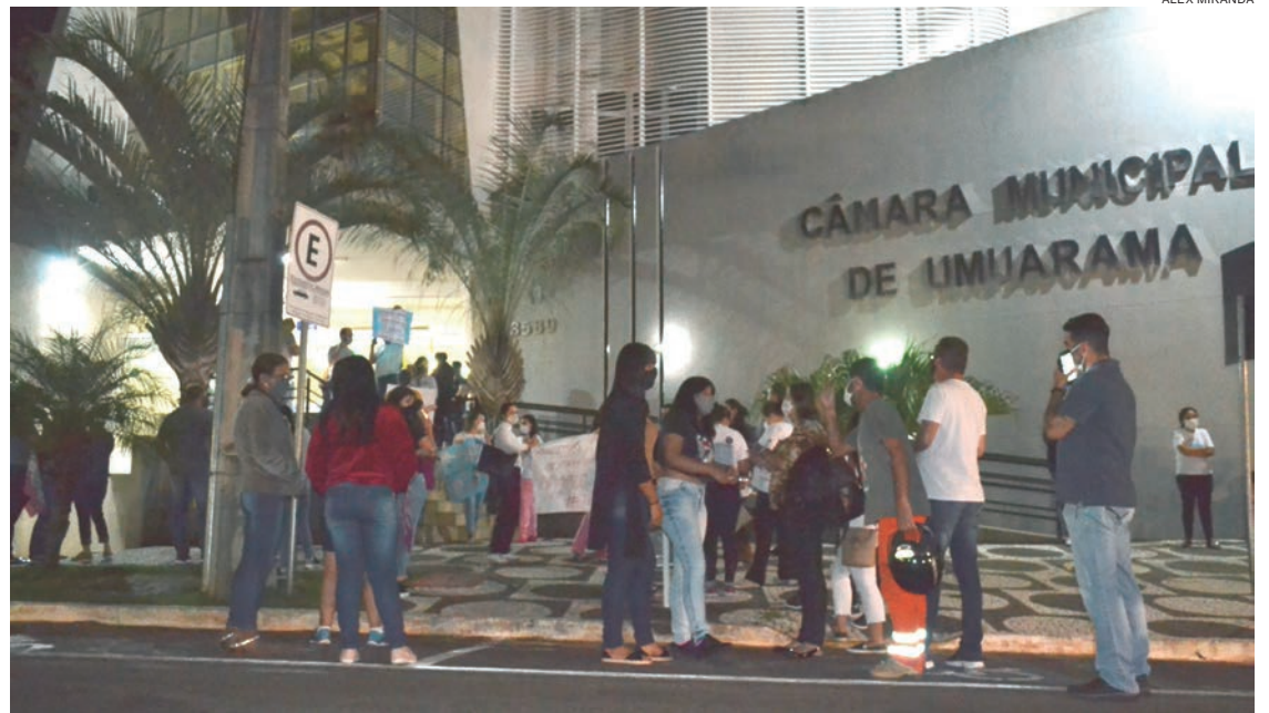
NA foto, de junho de 2020, servidores em frente à Câmara tentando impedir a aprovação de lei que suspendeu recolhimento de contribuições previdenciárias patronais

Consta ainda no texto, que o percentual de revisão se aplica também aos servidores ocupantes de cargos em comissão, aos inativos e pensionistas do regime