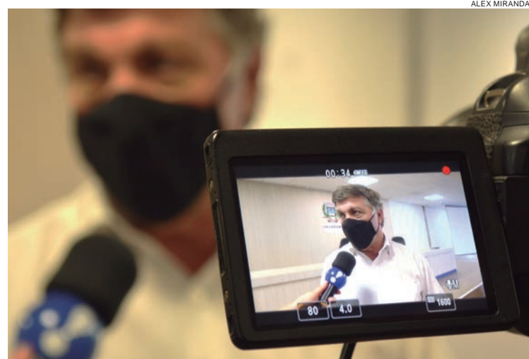
SEGUNDO o Prefeito, reduzindo despesas com os salários dos agentes públicos, terá mais recursos para fazer frente as ações de enfrentamento da pandemia

despesas com salários temos mais recursos para fazer frente as ações de enfrentamento da pandemia, que atingiram com peso a nossa economia no ano passado. Vamos concentrar os recursos economizados na saúde e no bem-estar da população, que precisa mais do que nunca do apoio do poder público neste momento complicado para a saúde pública. Estamos fazendo a nossa parte”, disse o prefeito Celso Pozzobom.