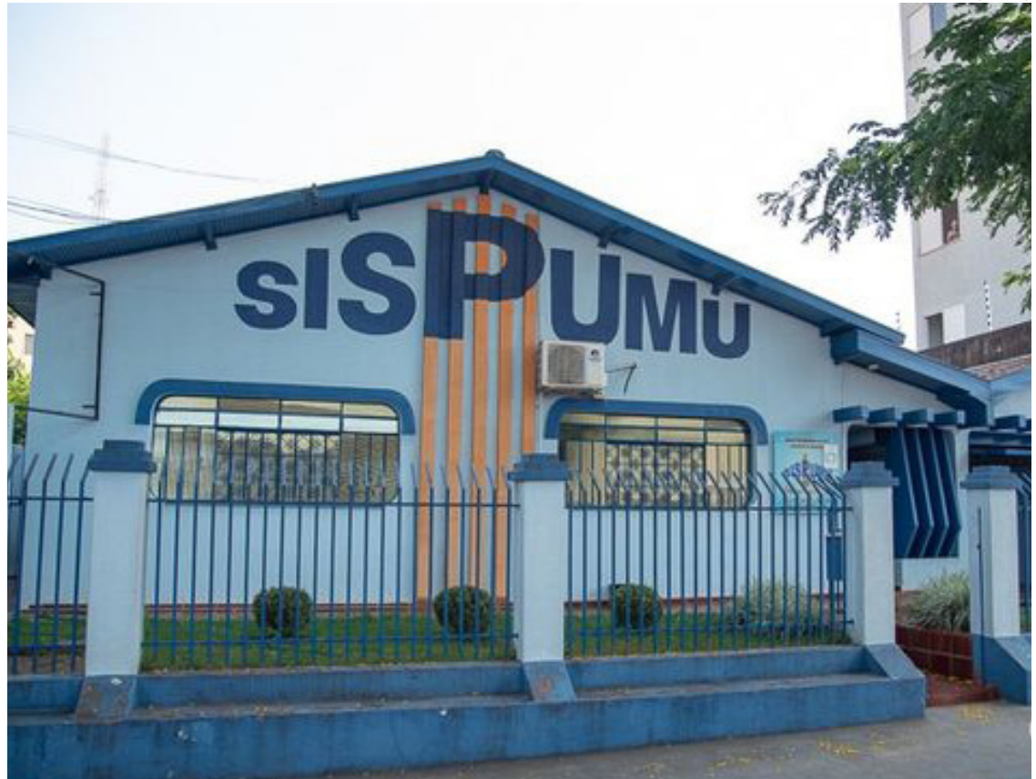
EQUIPES do Sindicato dos Servidores não conseguiu negociar com o Poder Executivo, reajuste de 5%

A diretora de finanças salientou que também acreditou que devido a mudança na diretoria, o sindicato poderia ser reflexo de uma mudança no sistema de gestão junto aos servidores do município. “Procuramos chefia de gabinete, devido à mudança da diretoria que aconteceu no início deste ano, e esperávamos que por conta disto, existiria mais diálogo no decorrer da gestão, mas pelo visto, tudo ficou como antes”, encerra.