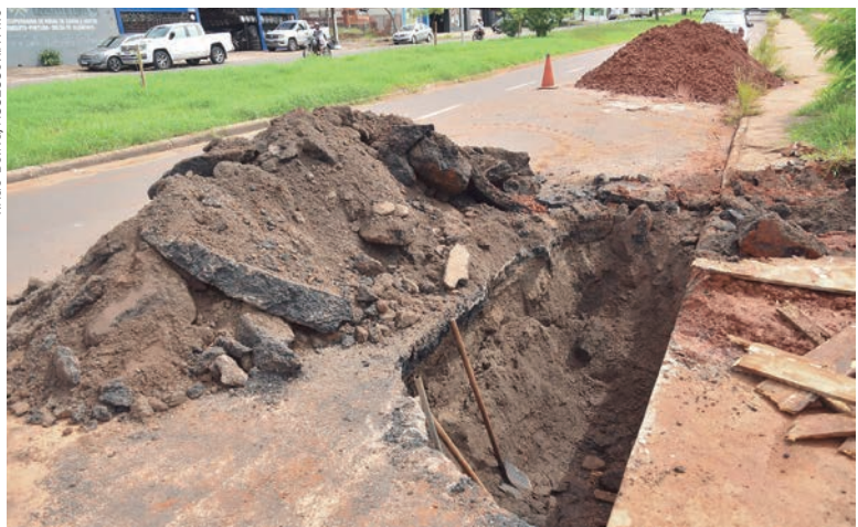
O local está sendo constantemente monitorado, porém no momento não pode passar por reparos definitivos