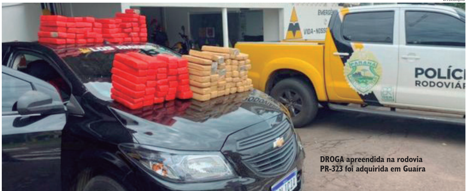
DROGA apreendida na rodovia PR-323 foi adquirida em Guaíra

Na vistoria, os policiais descobriram os tabletes de maconha escondidos em fundos falsos nas portas. O casal recebeu voz de prisão. Eles adquiriram a droga em Guaíra.