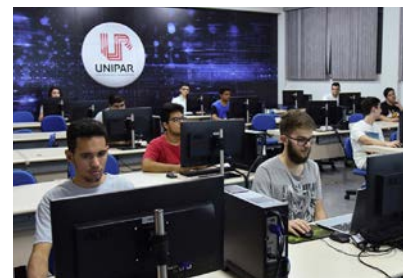
TI: Unipar oferece cursos de graduação para quem deseja seguir na área

Quer saber mais sobre o curso? Venha conversar conosco! A Unipar, oferece uma grande oportunidade para desenvolver as habilidades profissionais dos seus filhos, com estrutura para as aulas e um corpo docente formado por excelentes profissionais da área.