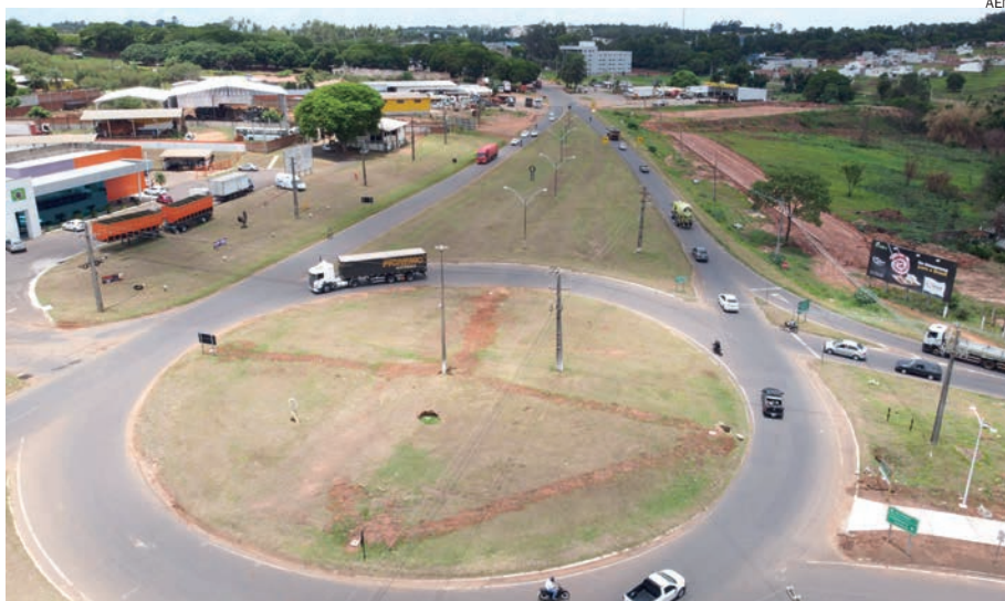
DUPLICAÇÃO e viadutos encerrarão fama de mau do Trevo Gaúcho

obras de duplicação da PR-445, entre Londrina e o distrito de Irerê, e da PR-323, entre Paiçandu e Doutor Camargo. Ambas contam com iniciativas que darão continuidade a essas duplicações. No caso da PR-445 está em andamento o projeto executivo de duplicação entre Mauá da Serra e Irerê e na PR-323 já são duas obras sendo licitadas, uma de Doutor Camargo até o Rio Ivaí e outra em Umuarama, do Trevo do Gaúcho até o entroncamento com a PR-468 (acesso para Mariluz), além de execução de terceiras faixas em 23 segmentos considerados críticos.