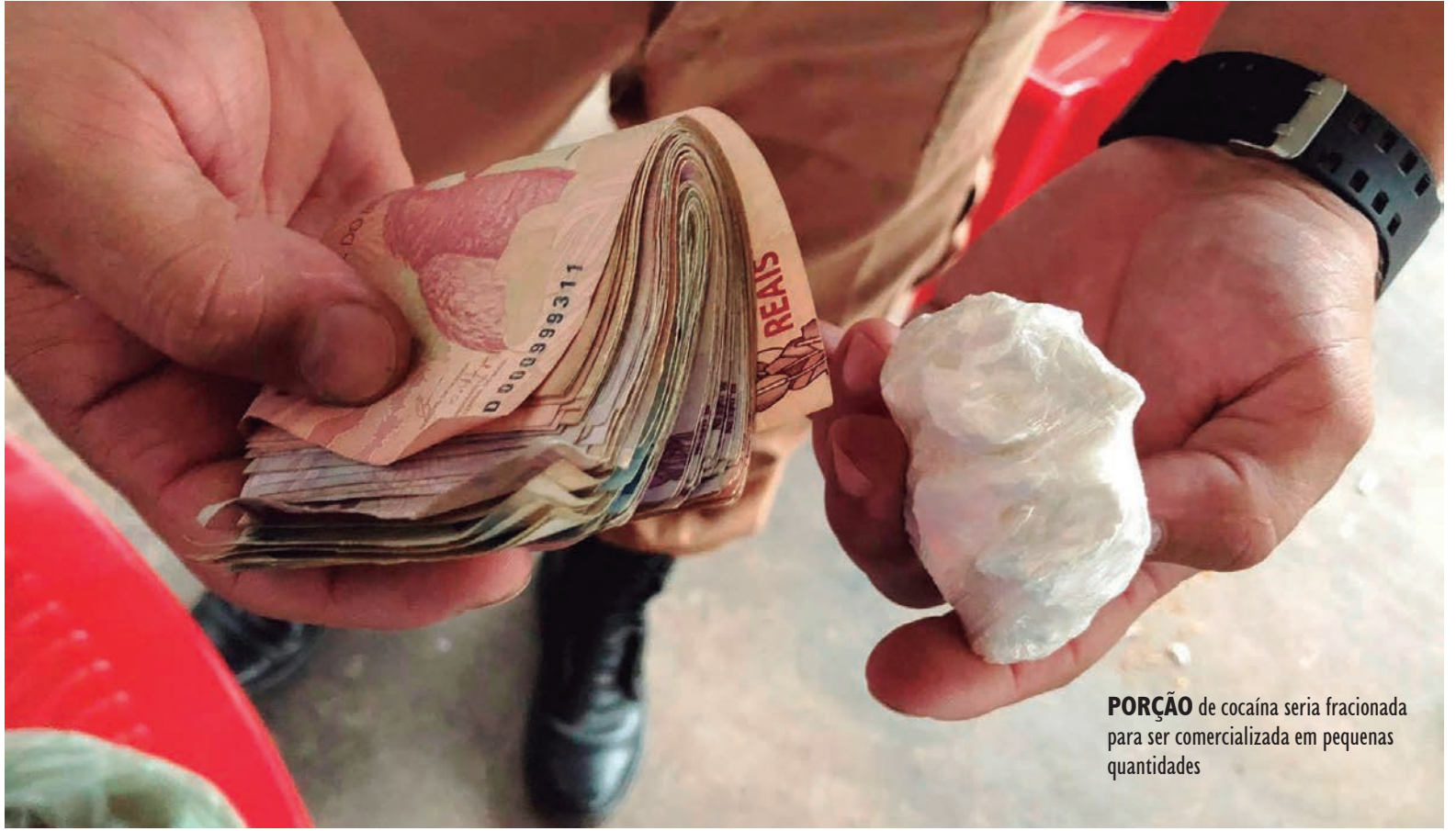
PORÇÃO de cocaína seria fracionada para ser comercializada em pequenas quantidades