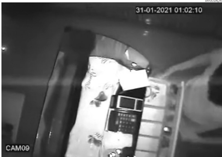
BANDIDO invadiu a sorveteria e teve acesso ao caixa. Câmeras de segurança registraram o furto

Uma sorveteria localizada na avenida Paraná, também foi alvo de ladrões no final de semana. O crime aconteceu na madrugada do domingo (31/1). Imagens do sistema particular de monitoramento da empresa capturaram a ação dos criminosos. A sorveteria também fica situada nas imediações da estação rodoviária. Um dos bandidos entrou na loja e furtou cerca de R$ 350 que estavam no caixa. Foram levadas inclusive as gavetas do caixa. Também restou ao dono, o prejuízo da porta de aço arrombada. As imagens foram repassadas à Polícia Civil.