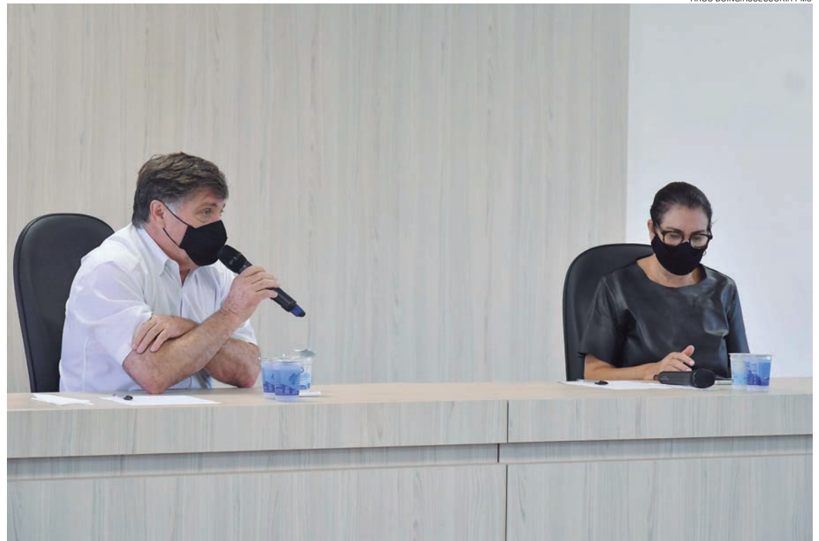
PREFEITO lembra que o governo do PR estendeu o toque de recolher, o que reforça a necessidade de manter as medidas restritivas