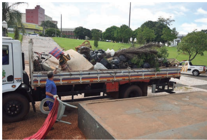
CAMINHÃO foi usado no recolhimento de colchões e entulhos apanhados pelos moradores de rua, que são deixados na Praça da Bíblia

A distribuição de marmitas nas praças públicas também foi lembrada pelo secretário. “Conforme discutimos com as instituições e autoridades, a alimentação deve ser fornecida em pontos fixos, com condições apropriadas, direcionando o público-alvo para longe das praças. Dessa forma se estimula o hábito de que as pessoas se alimentem nas entidades, evitando deixar restos de comida jogados nas praças, nas ruas, acumulando água, lixo e fomentando outros problemas de saúde pública”, completou.