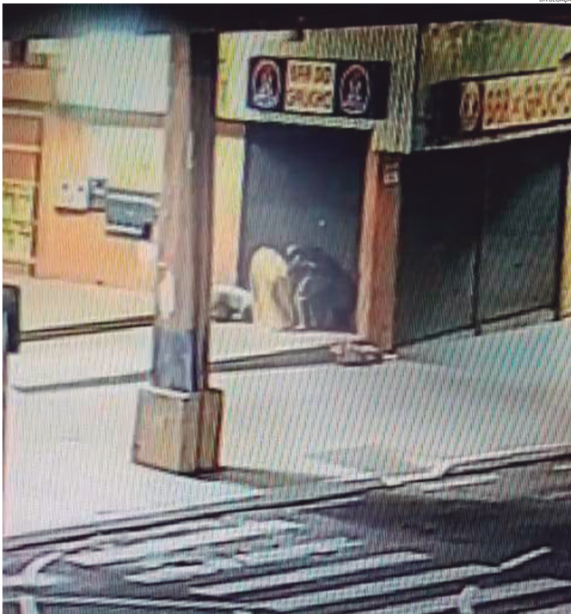
BAR tradicional situado na Estação Rodoviária foi alvo dos criminosos

Após praticarem o arrombamento, a Polícia Militar encontrou os suspeitos em um motel, nas imediações de onde aconteceu o