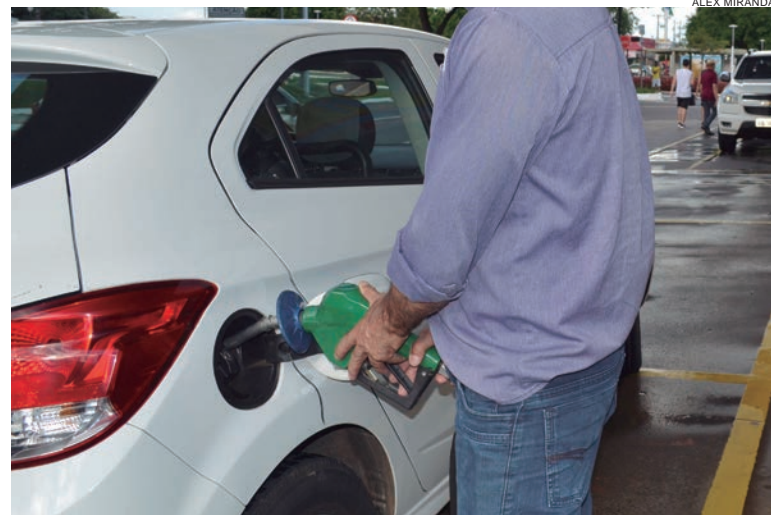
O preço médio da gasolina nas refinarias será de R$ 2,25 (aumento de R$ 0,17 por litro). O diesel vai à R$ 2,24 (aumento de R$ 0,13 por litro)

"Importante ressaltar que os valores praticados nas refinarias pela Petrobras são diferentes dos percebidos pelo