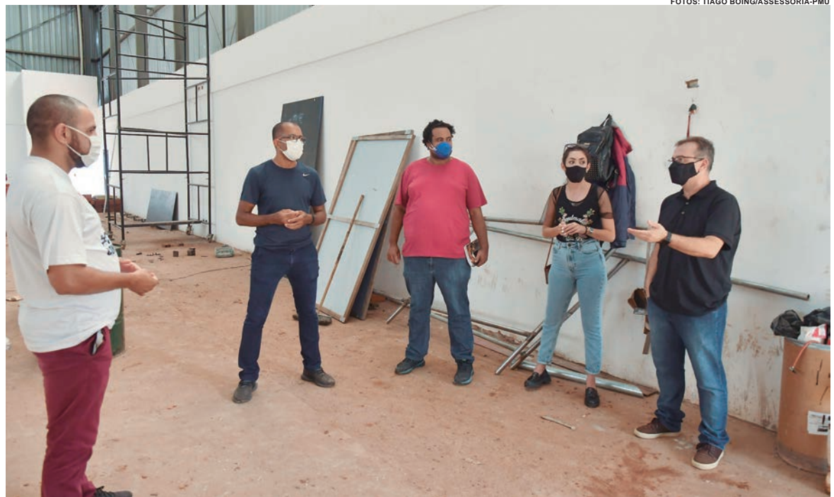
O grupo acompanhou a construção do centro esportivo e conheceu onde serão desenvolvidos os projetos da Smel para atender à comunidade do Sonho Meu

A comunidade também teve espaço para expor a realidade local, suas carências e aspirações durante a reunião. “Uma das ações da central das favelas é dar voz à população. O vereador também atua como porta-voz e o poder público está atento para atender na medida do possível e