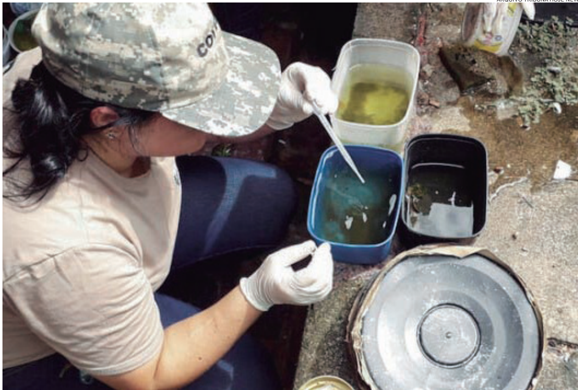
SEGUNDO a secretaria, a maior incidência foi registrada na UBS do Jardim Panorama, onde oito casos foram confirmados

As regiões de 19 Unidades Básicas de Saúde (UBS) contam com casos positivos de dengue. A maior incidência é registrada na UBS Panorama (oito casos confirmados), seguida pela UBS Guarani/Anchieta (seis) e pela UBS 26