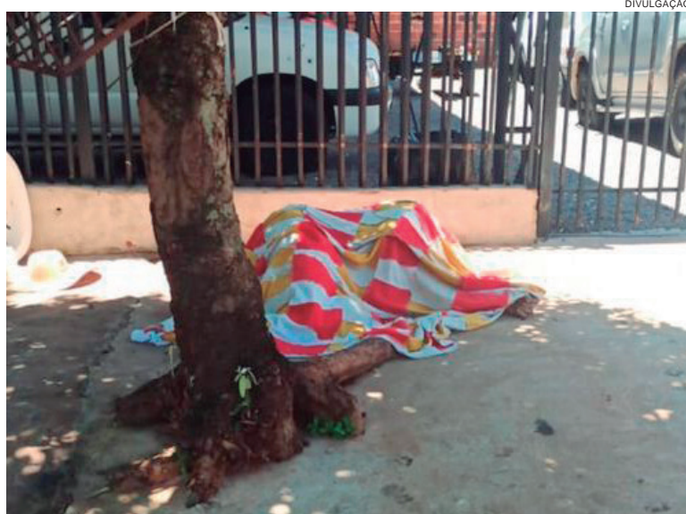
CORPO da vítima ficou estendido na calçada depois de alvejado com disparos de fuzil

De acordo com a Polícia Civil, os investigadores vão averiguar as imagens de câmeras de monitoramento