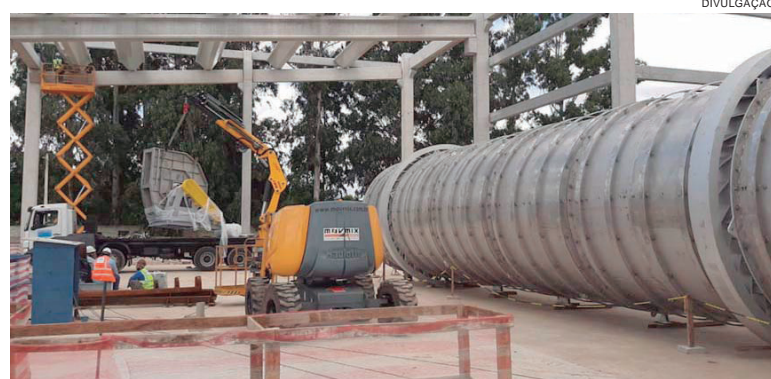
O sistema utiliza biogás e biomassa como fonte de energia que, além de economia, traz benefícios ambientais

Assim, haverá uma redução de mais de 90% no volume do produto. Esse processo de secagem é ambientalmente sustentável por usar o gás gerado