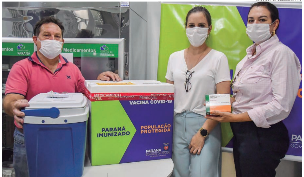
EQUIPES de vacinação se reuniram ontem para afinar a estratégia de aplicação de forma a imunizar o público-alvo no período mais curto

Equipes de vacinação da secretaria agendaram uma reunião para a tarde desta segunda, a fim de afinar a estratégia de aplicação de forma a imunizar o público-alvo no período mais curto. “Estamos tomando todos os cuidados para que o aproveitamento das vacinas continue 100%, seguindo os critérios estabelecidos pelo Plano Nacional de Vacinação, pelo plano estadual e determinações