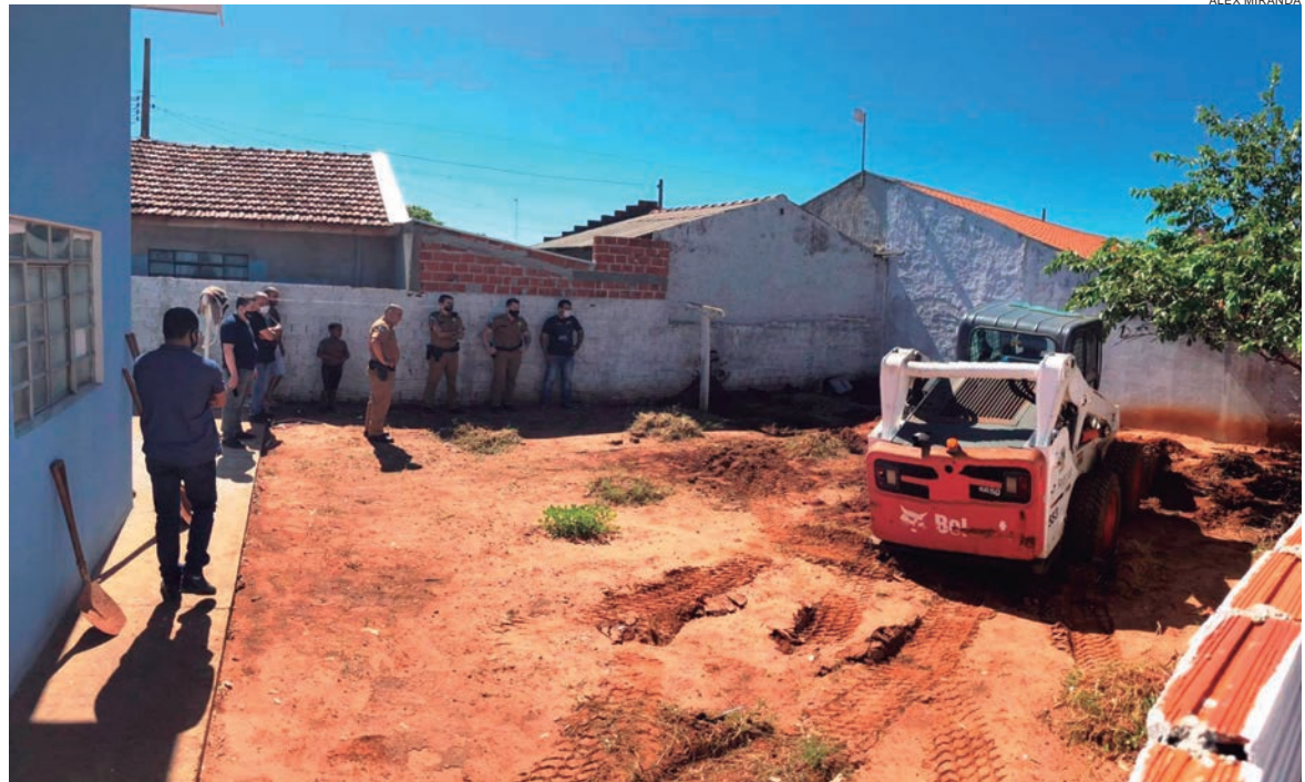
OS corpos não foram encontrados no quintal. Mas estavam enterradas uma bermuda e uma cueca, que foram levados à família das vítimas para reconhecimento

As peças do crime, levaram os policiais a iniciarem as buscas e até uma mini pá carregadeira da Prefeitura Municipal foi solicitada. Com a máquina, foi possível fazer uma varredura em toda a área do quintal onde