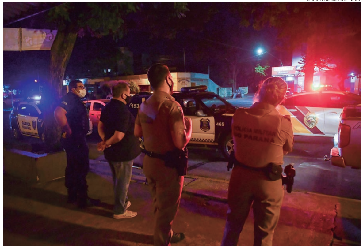
FORÇA Tarefa composta por PMs, GMs e vigilantes sanitários do município continuarão realizando fiscalizações

Não devem funcionar estabelecimentos destinados ao entretenimento ou eventos culturais (casas de shows, circos, teatros, cinemas, mu-