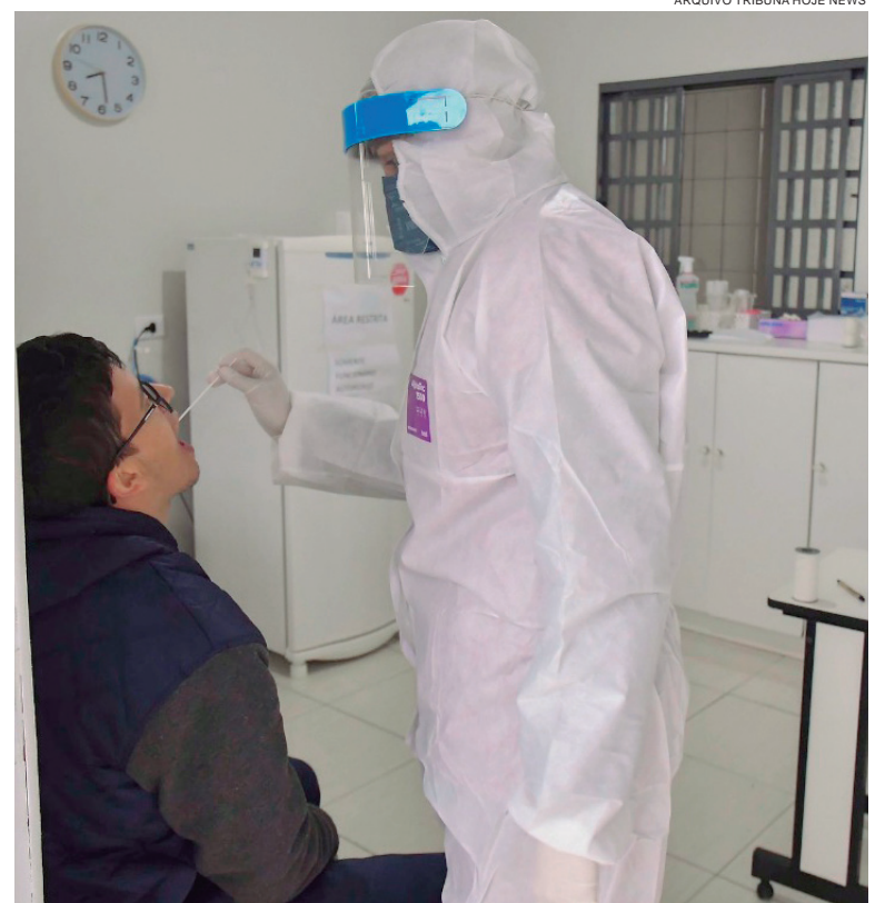
FORAM diagnosticados com a doença, 29 homens, 16 mulheres e uma criança, depois de testes feitos em Umuarama

Ainda de acordo com os registros da Secretaria Municipal de Saúde, entre os 33 leitos de UTI disponíveis nos hospitais locais, 32 estavam, até o final da tarde de ontem, ocupados, conforme a regulação da Macrorregião Noroeste da Secretaria de Estado da Saúde (Sesa), bem como 52 das 64 enfermarias exclusivas para covid-19.