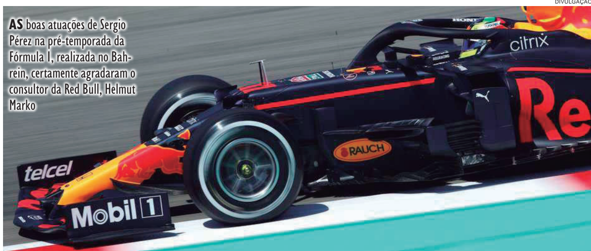
AS boas atuações de Sergio Pérez na pré-temporada da Fórmula 1, realizada no Bahrein, certamente agradaram o consultor da Red Bull, Helmut Marko

EXTRAVIO DE ALVARÁ HANNA INDÚSTRIA E COMÉRCIO DE CONFECÇÕES LTDA - ME, inscrita sob nº CNPJ 01.293.140/0001-68, estabelecido na Avenida Aracajú, 1778, CEP 87.503-370, cidade de Umuarama Estado do Paraná, comunica para os devidos fins o extravio de seu alvará municipal nº 19.978/1996. Com esta publicação o mesmo torna-se sem valor legal e comercial.