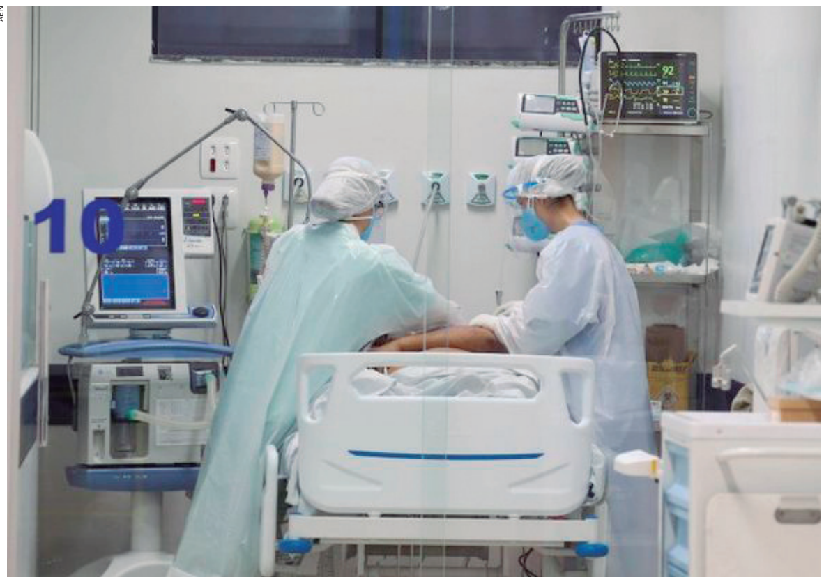
A Macronoroeste conta com 246 leitos de UTI Covid e 379 de enfermaria adulto e cinco UTIs infantis e também cinco leitos de enfermaria para crianças

As diferenças entre os números de leitos disponíveis e pacientes que aguardam internação ocorrem por conta da mobilidade de pessoas, após transferências motivadas pela evolução de cada caso, entradas e saídas, altas médicas ou óbitos.