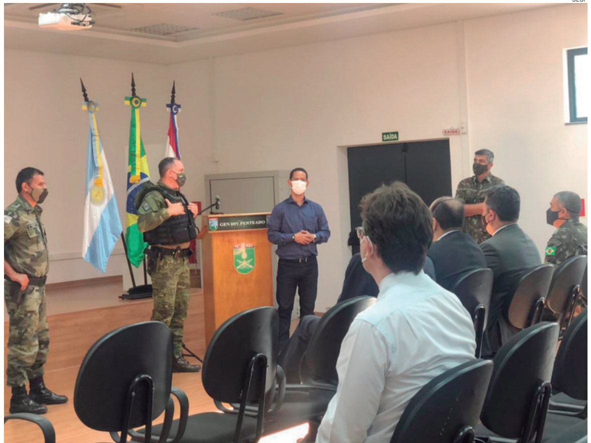
DESENCADEADA na sexta passada, ação resultou no prejuízo de cerca de R$ 15 mil ao crime organizado

Estão integrados nesta ação o Departamento de Inteligência do Paraná (DIEP); a Polícia Civil, com cinco subdivisões e o Grupamento de Operações Aéreas (GOA-PCR); a Polícia Militar (14º BPM, 19º BPM, 21º BPM, 25º BPM e 3ª CIPM); o Batalhão de Polícia de Fronteira (BPFron); o Batalhão de Polícia Ambiental – Força Verde (BPAMB-FV); o Batalhão de Polícia Rodoviária (BPRV); a Polícia Científica; o Departamento Penitenciário (Depen); a Polícia Rodoviária Federal (PRF); e o Exército Brasileiro, por meio da 15ª Brigada de Infantaria Mecanizada.