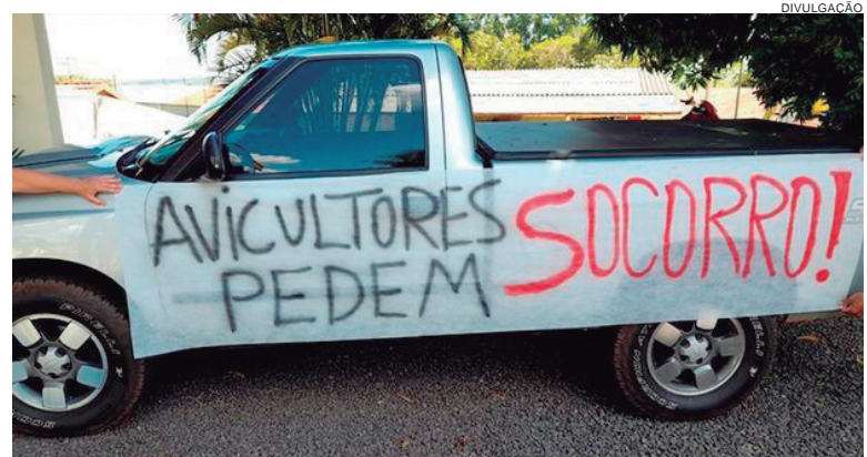
Os produtores defendem o valor de R$ 1,13 por ave para manter a produção. A empresa promete chegar a R$ 1 até setembro

Destaca ainda que empresa tem feito um grande esforço, mesmo com o alto preço dos insumos, para repassar de forma gradual mais um reajuste aos integrados, cujo aumento chegará em R$1 por ave, o que deve acontecer até setembro deste ano, ou seja, um aumento total de 17%, passando para uma margem