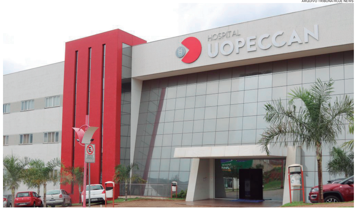
FRENTE ao esgotamento iminente de recursos, o Hospital manifesta preocupação com a evolução da pandemia e dos óbitos decorrente

Por isso, frente ao esgotamento iminente e absoluto de recursos, a Uopecan vem a público manifestar preocupação com a evolução da pandemia da covid-19 e os possíveis óbitos decorrentes desta e solicita que todos reforcem as medidas de prevenção, evitando locais aglomerados e o contato físico (aperto de mão e abraços), utilizando sempre a máscara e higienizando as mãos com álcool em gel ou sabão.