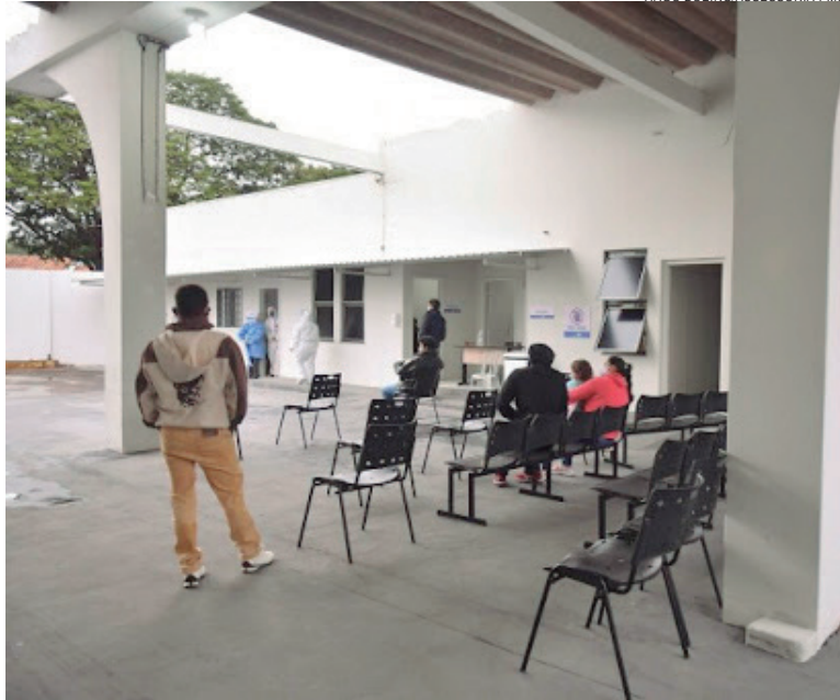
UMA das mortes aconteceu no Ambulatório de Síndrome Gripais e outra foi no Pronto Atendimento, as vítimas aguardavam a abertura de leitos

Das 21.708 notificações de síndromes gripais acumuladas desde março do ano