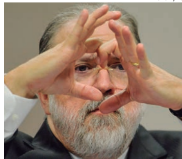
O procurador-geral da República, Augusto Aras, concedeu o benefício aos procuradores do MPF, que serão reembolsados pelos gastos com o plano de saúde privado

Em nota, a PGR informou que a portaria atende a uma decisão do Conselho Nacional do Ministério Público que prevê a criação do auxílio-saúde para membros e servidores do MPF.