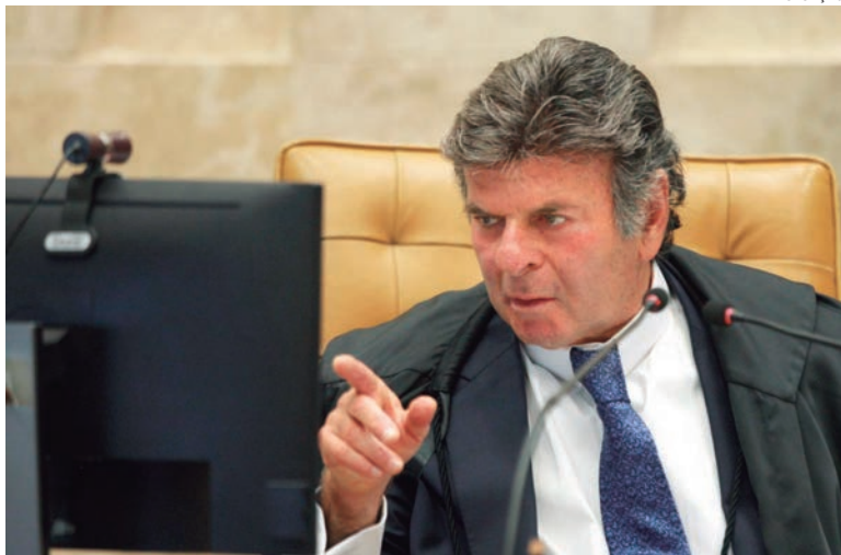
A análise seria marcada a partir de 16 de abril – próxima sexta-feira. Fux decidiu antecipar a sessão

O presidente do Senado, Rodrigo Pacheco (DEM-MG), disse