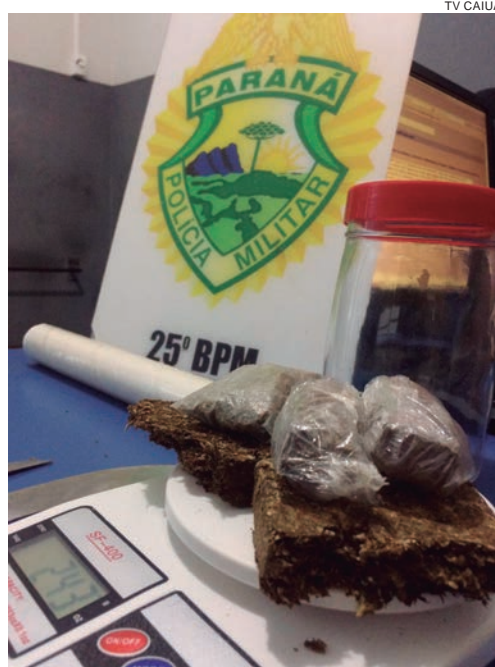
DROGA apreendida no salão enquanto acusado de tráfico cortava o cabelo de cliente

O cabeleireiro, que não possui antecedentes criminais, foi conduzido à delegacia e denunciado. A droga e as facas também foram apreendidas.