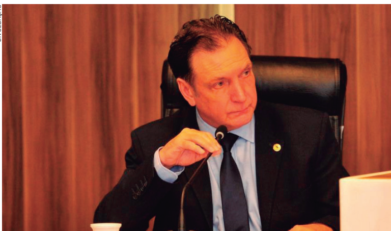
BIER foi filiado ao PMDB por quase três décadas. Em 2018, se filiou ao PSD a convite do governador Ratinho Jr

Entre os cargos públicos, Bier também foi prefeito da