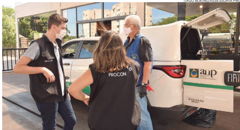
A coleta das amostras foi necessária uma vez que o teste local revelou indícios de mistura etanol anidro por litro de gasolina acima do permitido

“A coleta das amostras foi necessária uma vez que o teste local revelou indícios de mistura etanol anidro por litro de gasolina acima do permitido”, explicou. Os testes laboratoriais vão apontar se a diferença está ou não dentro da margem de tolerância. Em todos os postos foram verificados os docu-