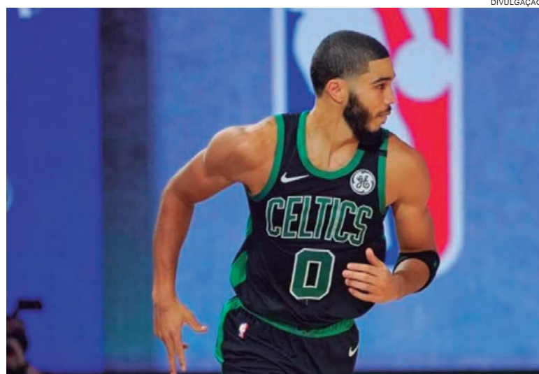
TATUM comandou o Celtics a três vitórias em quatro partidas no período

quatro partidas no período, ficando perto de recolocar a equipe na zona de classificação direta para os playoffs. O ala acumulou médias de 31.5 pontos, 8.5 rebotes e 3.8 assistências, convertendo 39% dos tiros de longa distância tentados e 28 de 29 lances livres que cobrou. Na sexta-feira, se tornou o mais jovem atleta do Boston a marcar 50 pontos em uma partida, contra o Minnesota. George, por sua vez, liderou o Clippers na semana invicta, vencendo quatro adversários. Só ele esteve presente em três desses e registrou 33.7 pontos, 4.3 rebotes e 5.7 assistências por jogo