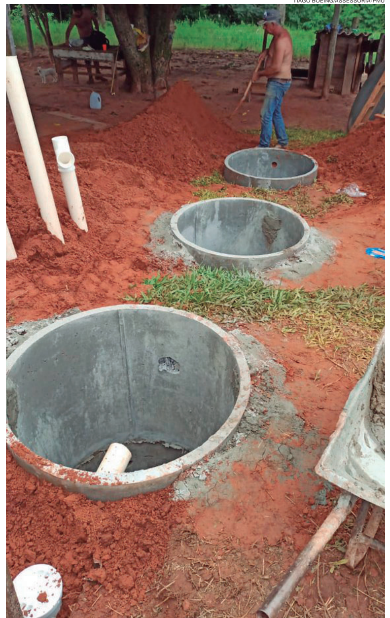
DIRETORIA de Meio Ambiente contratou empresa para a construção de fossas num sistema que ajuda a evitar a contaminação do solo com o despejo de resíduos