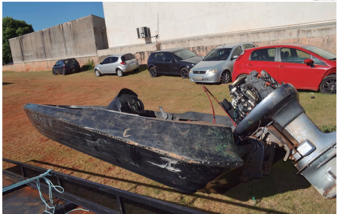
EMBARCAÇÃO apresenta ranhuras no casco que configuram eventual choque que pode ter sido contra a lancha usada pelos PMs na madrugada do atentado

Ao descobrirem que afundaram a lancha policial, os contrabandistas deram a volta, passando a procurar pelos naufragos. “Acreditamos que eles atentariam novamente contra a vida dos policiais, que conseguiram se esconder. Dois delas nas margens perto do local onde aconteceu o atentado e outros