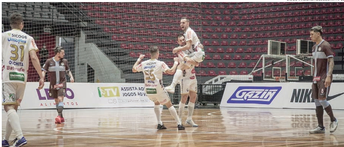
COM o placar de 1 x 1 contra o Corinthians, o Umuarama Futsal segue em 7º colocado na geral

O próximo desafio da AFSU será sábado dia primeiro de maio, às 13h em casa, no Ginásio de Esportes Amário Vieira da Costa, com portões fechados para o público. O jogo será contra a experiente equipe do Joaçaba.