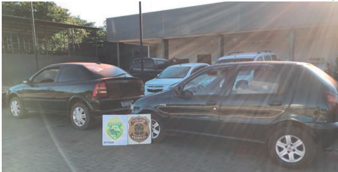
VEÍCULOS apreendidos foram encaminhados com as cargas à Delegacia da Polícia Federal de Guaira

O Batalhão de Polícia de Fronteira (BPFron) em conjunto com a Polícia Federal (PF) realizou um patrulhamento na madrugada de ontem (terça-feira, 27) que resultou em um prejuízo estimado em R$ 130 mil ao crime organizado da região.