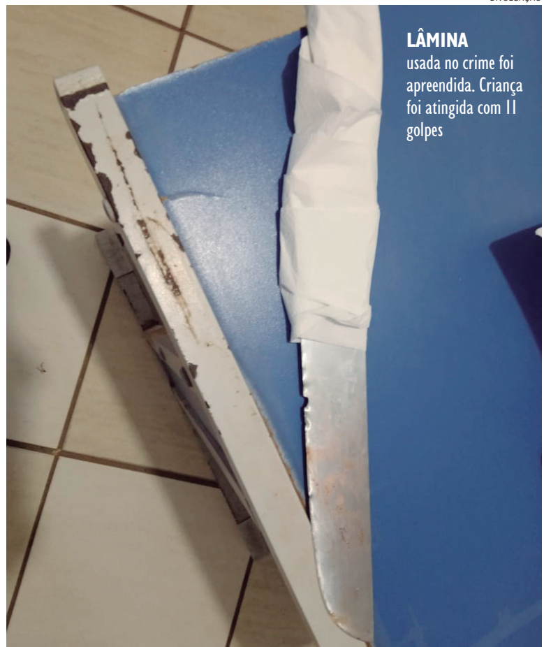
LÂMINA usada no crime foi apreendida. Criança foi atingida com 11 golpes

A criança foi socorrida pelo Serviço de Atendimento Móvel de Urgência (Samu). Ele sofreu ao menos 10 perfurações provocadas por uma faca, que foi apreendida pela Polícia Militar e entregue para a Polícia Civil, que já investiga a tentativa de homicídio.