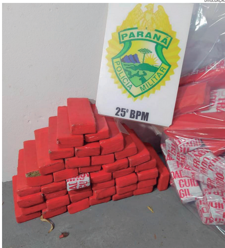
DROGA apreendida estava dentro de veículo supostamente tomado de assalto

Perto de um canalial foram encontrados rastros de um veículo que havia entrado em alta velocidade. Partindo daí os PMs começaram a segui-lo e, aproximadamente um