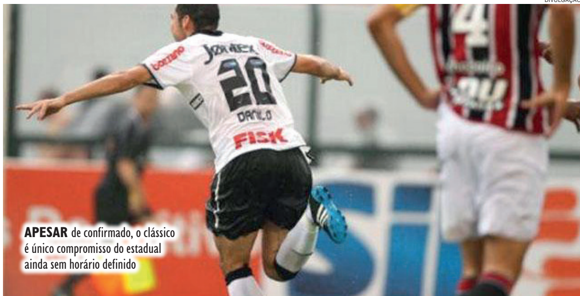
APESAR de confirmado, o clássico é único compromisso do estadual ainda sem horário definido

Pela 11ª rodada, a Federação também confirmou o clássico entre Palmeiras e Santos - no dia 06. O confronto acontece no Allianz Parque, às 21h de quinta-feira.