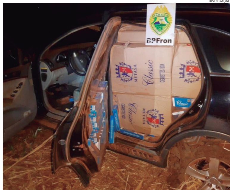
VEÍCULO carregado com cigarros paraguaios foi perseguido e apreendido pelo BPFron em Umuarama

A ação que terminou com esta apreensão faz parte da "Operação Remanso", desencadeada em toda a faixa de fronteira no noroeste do Paraná, com reforço de policiais de Maringá e Cascavel, depois que uma equipe que atua no programa Vigia sofreu um atentado no rio Paraná, ocasião em que contrabandistas atiraram o barco sobre a lanha em ocupada pelos policiais.