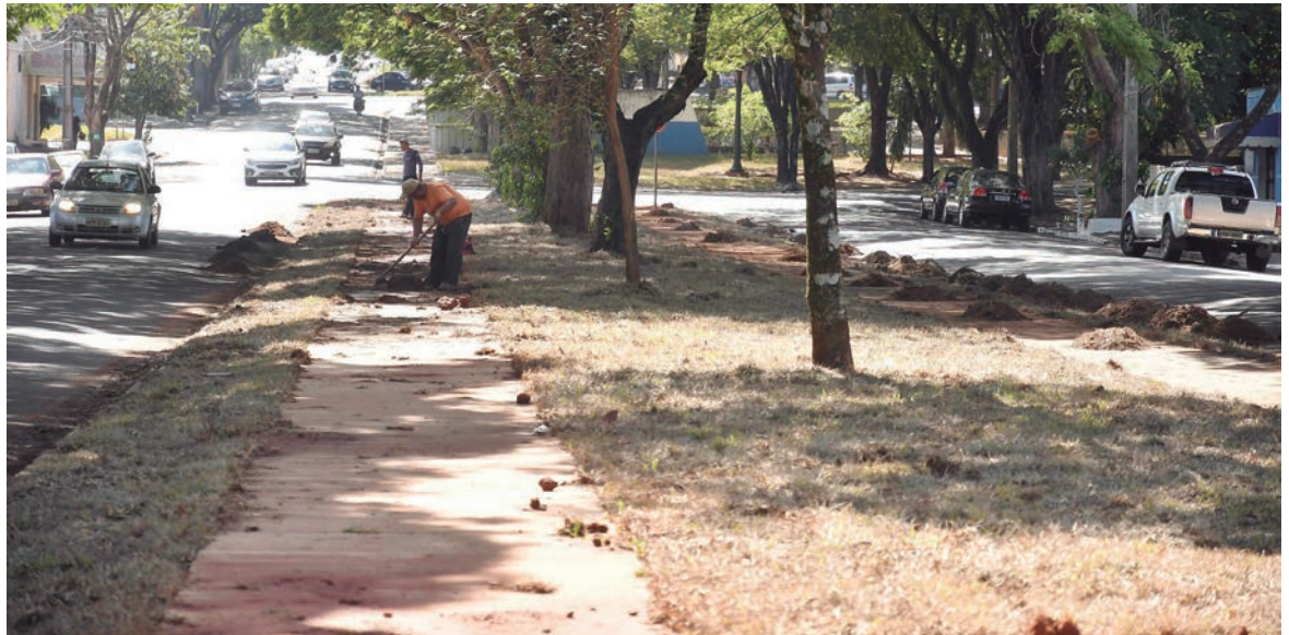
A ciclovia se estende desde o início da Avenida Rio Grande Norte até o trecho final da Avenida Tapuia, terminando na Rua Monteiro Lobato

A ciclovia se estende desde o início da Avenida Rio Grande Norte até o trecho final da Avenida Tapuia, terminando na Rua Monteiro Lobato. Serão 12.937,83m 2 de obras e um investimento de R$ 1.532.940,33 em recursos do Contrato de Financiamento à Infraestrutura e ao Saneamento (Finisa) do Ministério das Cidades/ Caixa Econômica Federal.