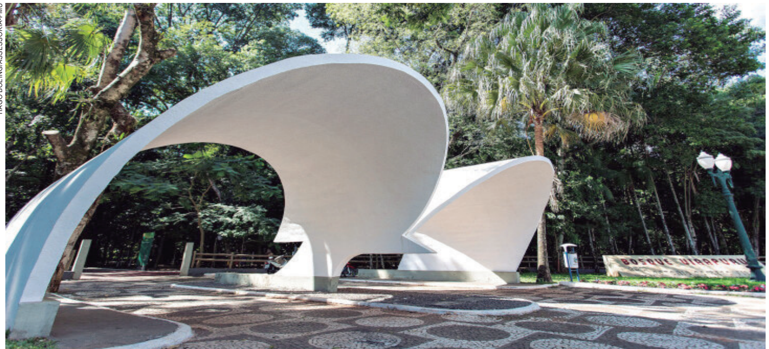
BOSQUE Uirapuru será liberado novamente para a prática de atividades físicas

O decreto proíbe ainda aglomeração de pessoas e o consumo de bebida alcoólica nas ruas e locais públicos e reunião de trabalho presencial ou qualquer outra ação que gere aglomeração; feiras estão proibidas, com exceção das feiras de quarta, sexta-feira e domingo. O funcionamento do estabelecimento público ou privado destinado ao entretenimento ou a eventos culturais, (casa de shows, circo, teatro e atividade correlata, exceto cinema e piscina de uso público, seguem proibidos bem como estabelecimentos destinados a eventos sociais em espaços fechados (casas de festas, de eventos ou recepções) e parques infantis e temáticos.