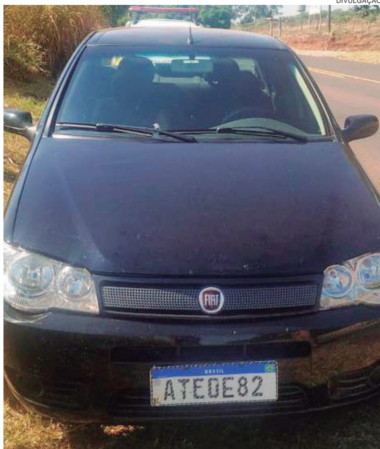
CARRO foi encontrado abandonado à beira da rodovia na saída para Xambê

Assim que encontraram o Siena, realizaram uma averiguação e descobriram que se trata de um carro com alerta de roubo. O crime foi praticado no último dia 22 de abril, em Maringá. As placas estavam disfarçadas com fita isolante preta, para confundir as letras. O veículo foi guinchado para a sede do 25º Batalhão da Polícia Militar, em Umuarama, e após comprovações, será devolvido ao dono.