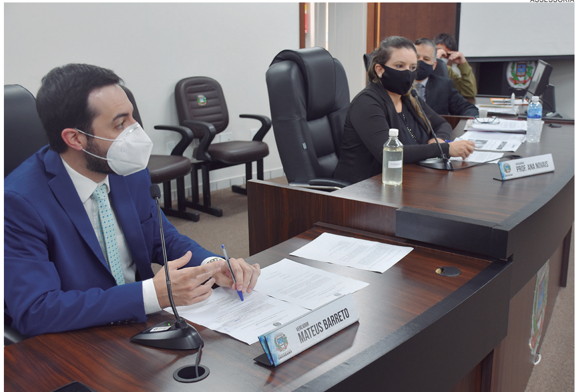
COMISSÃO deu início às convocações para investigar desvios de R$ 19 milhões em recursos do Fundo Municipal de Saúde

A primeira reunião no formato de oitiva marca o início dos trabalhos com a convocação de testemunhas.