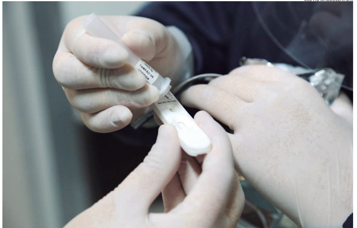
SESA envia 85 mil testes rápidos para pesquisa do antígeno viral SARS-CoV-2 e 640 oxímetros aos municípios sede das 22 Regionais de Saúde

O Estado é um dos que mais testa no País, segundo