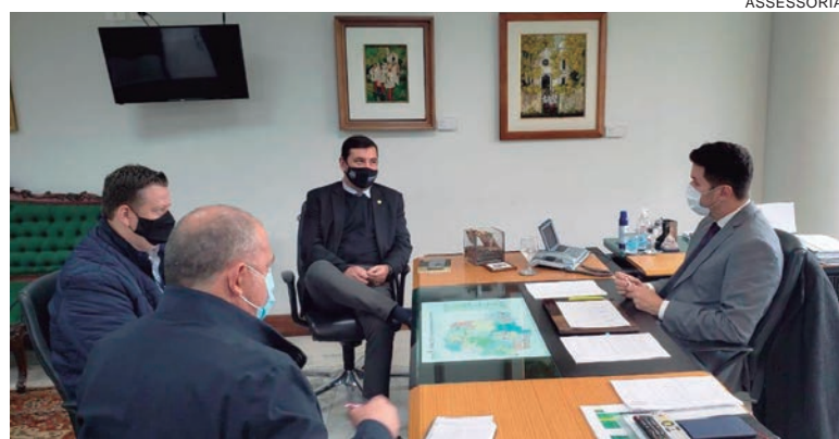
REUNIÃO com chefe da Casa Civil tem o objetivo de atender demandas que podem melhorar a segurança dos paranaenses

De acordo com o parlamentar, que tem ampliado o diálogo com as forças de segurança e o governo do Estado,