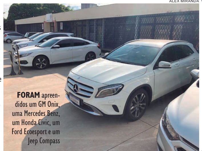
FORAM apreendidos um GM Onix, uma Mercedes Benz, um Honda Civic, um Ford Ecoesport e um Jeep Compass

Com autorização judicial, houve o sequestro e apreensão de cinco veículos dos investigados, com vistas a buscar a garantia de reparo dos danos causados ao patrimônio público pelos desvios praticados. Os bens deverão ir a leilão, podendo ser utilizados temporariamente por autoridades de segurança até que sejam leiloados. As investigações foram iniciadas pelo Gepatria de Umuarama, com apoio do Gaeco de Cascavel, no começo de 2020. Diante do envolvimento de suspeitos com prerrogativa de foro, também atua na apuração a Subprocuradoria-Geral de Justiça para Assuntos Jurídicos do MPPR.