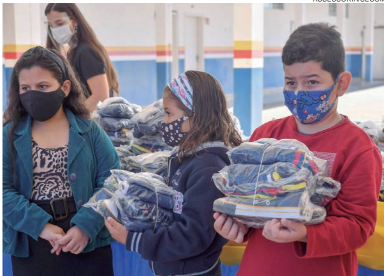
OS conjuntos são formados por tênis, camiseta, agasalho, shorts ou short-saia e são personalizados com as cores do município

Serão entregues 5.891 pares de tênis, 9.812 camisetas, 5.891