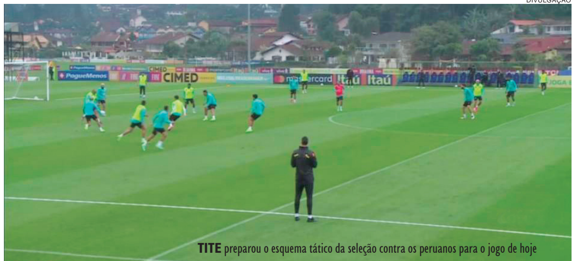
TITE preparou o esquema tático da seleção contra os peruanos para o jogo de hoje

EXTRAVIO DE ALVARÁ FARMÁCIA SECOFAL DE UMUARAMA LTDA, inscrita sob nº CNPJ 78.458.460/0001-55, estabelecido na Rua Arapongas, 3919, Zona II, CEP 87.502-180, cidade de Umuarama Estado do Paraná, comunica para os devidos fins o extravio de seu alvará, Inscrição Municipal nº12.391. Com esta publicação o mesmo torna-se sem valor legal e comercial.