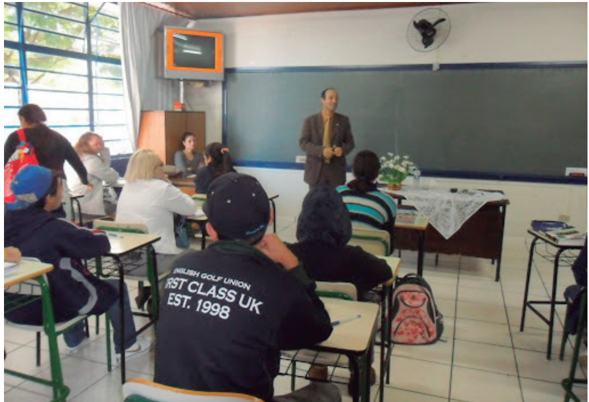
SE a decisão atingir o Núcleo Regional de Umuarama, aproximadamente 2500 alunos ficarão sem aulas na modalidade de Educação de Jovens e Adultos

Lemos também questionou sobre uma empresa terceirizada, com sede em São Paulo, que ganhou uma licitação para a contratação de servidores para as escolas da regional de União