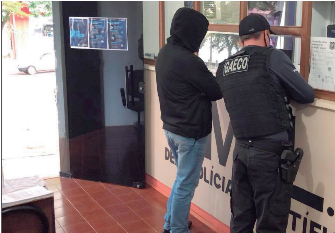
UM dos detidos foi submetido a exame de lesões no IML (procedimento padrão determinado pela Secretaria de Segurança Pública do Paraná)

Dois dos cinco mandados de prisão referem-se a investigados que já estavam