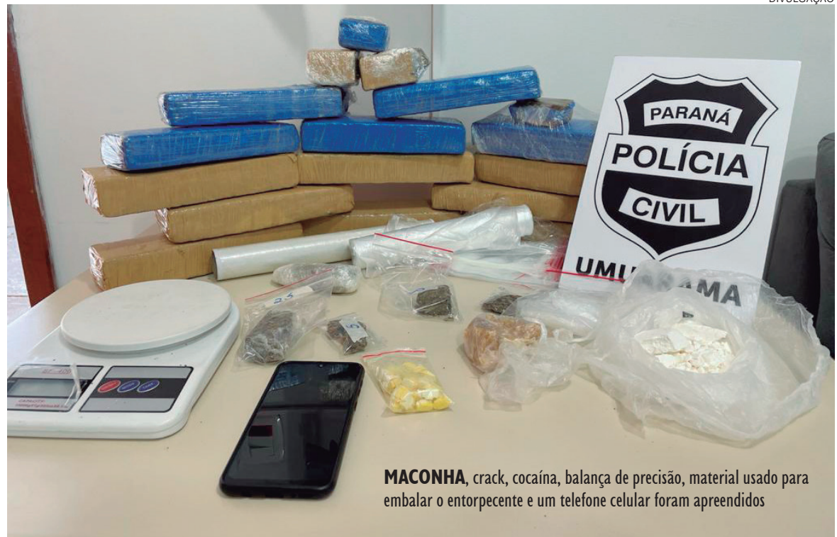
MACONHA , crack, cocaína, balança de precisão, material usado para embalar o entorpecente e um telefone celular foram apreendidos

A mulher presa foi encaminhada para a carceragem da 7ª SDP. Durante interrogatório, ela manifestou o direito de permanecer em silêncio, mas foi denunciada por tráfico de drogas.