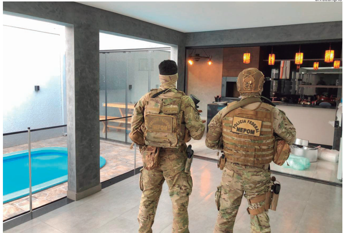
IMÓVEIS avaliados em mais de R$ 1,56 milhão que eram propriedade dos envolvidos no grupo criminoso, foram sequestrados

O valor total do patrimônio tomado dos criminosos foi de R$ 2.176.049. Em espécie foram recolhidos R$ 32.951. Outros R$ 43.080 em cheques, além de contas bloqueadas com valores de