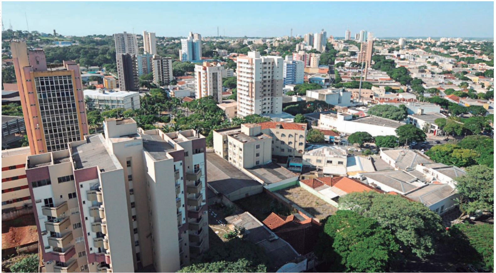
NÃO houve consenso entre o Sindicato dos Empregados no Comércio e o Sindilojistas, que formalizam a Convenção Coletiva de Trabalho