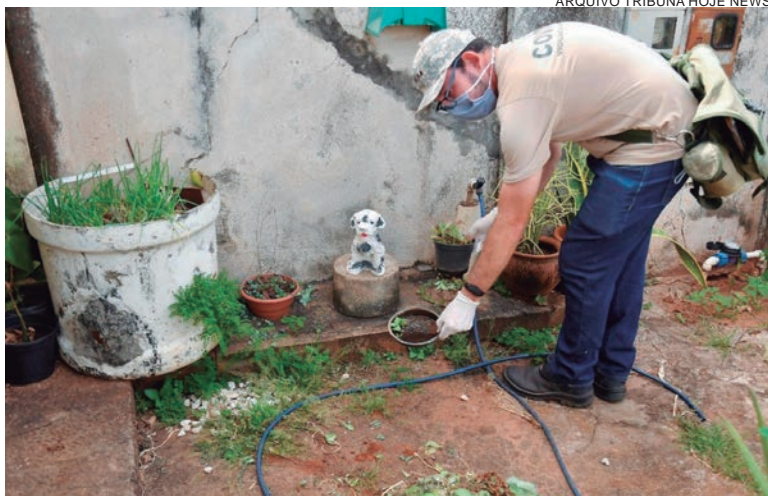
ENTRE 26 de julho de 2020, até sábado (3), foram registrados 1.092 casos, sendo que 930 foram descartados (85%), 136 positivos e 26 ainda em investigação

Ainda de acordo com o informe, as regiões com mais números de notificações de casos são a do Guarani (20 notificações), Central (14), Panorama (13), 26 de Junho (10) e Jardim Lisboa (9). Já as regiões que tiveram os menores registros de possíveis casos foram o Parque Jaboticabeiras e Bem Estar, com duas notificações, São Cristóvão, zona