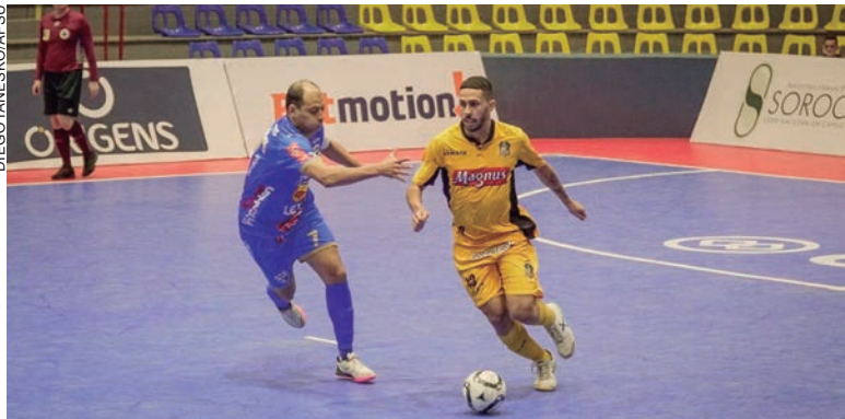
UMUARAMA pega na 10ª rodada da Liga Nacional, dia 11, às 15h, no Ginásio Tênis Clube, o São José dos Campos

O Umuarama levou 7 a 0 do líder Magnus em jogo disputado na noite da última sexta-feira (2), no Ginásio de Esportes Amario Vieira da Costa. A partida foi realizada pela Liga Nacional de Futsal. Com isso, o clube paranaense já soma seis derrotas em oito jogos e segue na lanterna do Grupo A da Liga, com apenas dois pontos.