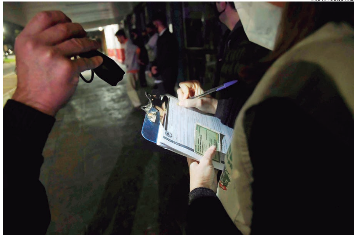
VIGILÂNCIA emitiu cinco infrações em CPF, infração a lanchonete, orientações para bares e notificou um deles no final de semana

No sábado, 3, foram realizadas cinco vistorias em eventos autorizados, uma lanchonete foi notificada e uma conveniência, a festa que ocorria em uma chácara e uma tabacaria receberam autos de notificação por desrespeitarem as medidas contra a pandemia. Foram fiscalizadas festas na Rua 13 de Maio, chácara na Estrada Jaborandi (som