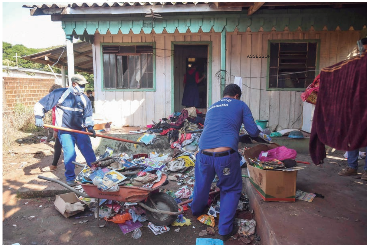
TAMBÉM houve o pedido, por parte do MP, de medida protetiva, que foi negado pela Justiça

O Ministério Público do Paraná (MP-PR) ingressou com ação de interdição da mulher, porém por enquanto o juiz não acatou o pedido. Também houve o pedido, por parte do MP, de medida protetiva e, da mesma forma, também negado pela Justiça. “Nossa real preocupação é com a segurança da vida dessa pessoa. A situação de acumulação