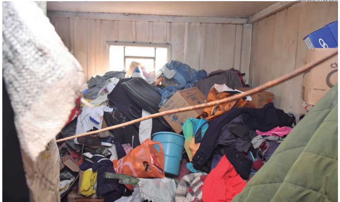
TODOS os cômodos da residência estavam abarrotados com tantos materiais acumulados, a maioria recicláveis

A acumuladora mora sozinha e uma vizinha tenta, de alguma forma, cuidar dela, porém sem muito sucesso. De acordo com Silva, quando viu a equipe da Prefeitura se aproximar, ela empreendeu fuga pelos fundos do quintal. “É realmente um caso muito complicado e esperamos que a Justiça consiga oferecer proteção a essa senhora. Ouvimos relatos dos vizinhos dando