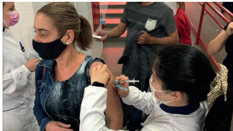
Em 10, dos 22 municípios que fazem parte da área compreendida pela 12ª Regional de Saúde de Umuarama, foram aplicadas 4.334 doses

O Centro de Medicamentos do Paraná (Cemepar) providenciou a distribuição de mais de 197 mil vacinas contra a