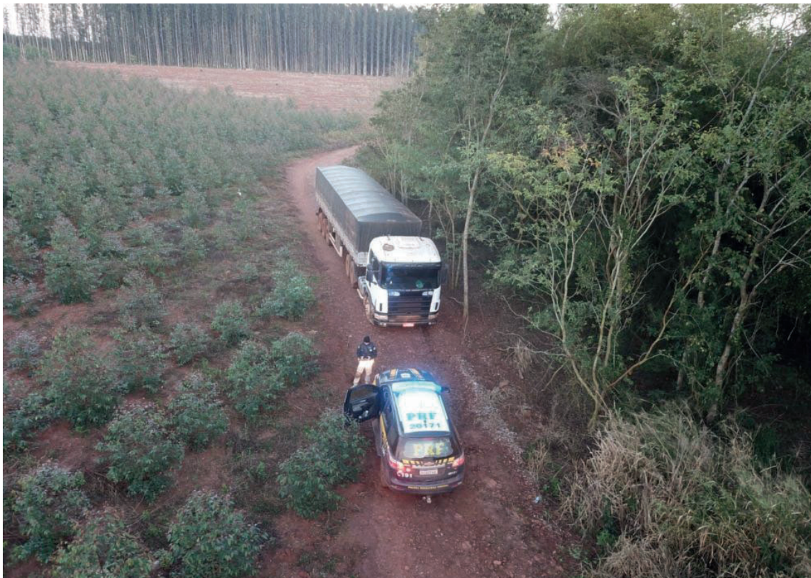
UM dos veículos apreendidos, carregados com contrabando, pela Polícia Rodoviária Federal, em estrada vicinal na madrugada de ontem

A Polícia Rodoviária Federal (PRF) apreendeu quase um milhão de maços de cigarros contrabandeados do Paraguai na madrugada de ontem (12). A ação correu por volta das 2h, em Francisco Alves (70 quilômetros de Umuarama), quando os patrulheiros federais abordaram o motorista de um bitrem, que estava acompanhado de duas pessoas (entre elas um adolescente de 16 anos). Durante a vistoria, encontraram nos compartimentos de carga, cerca de 500 mil maços de cigarros. Na cabine, ainda encontraram diversas placas de identificação, que eram usadas para despistar a fiscalização