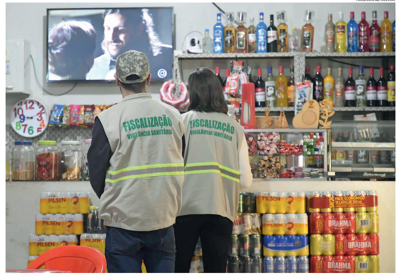
FORAM lavradas infrações de bares, lanchonetes e açaiterias e realizadas orientações entre sexta-feira e domingo

Conforme relatório da Guarda Municipal foi verificada denúncia de ônibus com excesso de lotação no distrito de Lovat, receberam notificação uma empresa de marmiteix e um bar no Parque Bonfim, um bar na Avenida Maringá, lanchonete na Londrina, casa de açaí na Av. Paraná, bares na Praça 7 Setembro na Rua