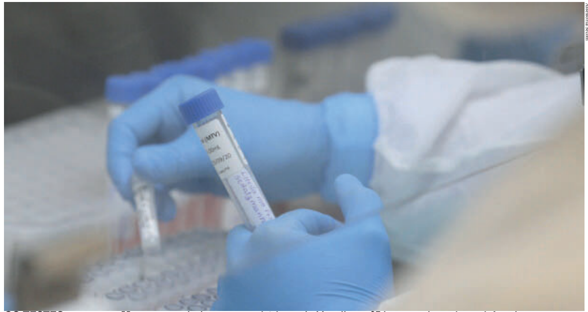
OS TESTES constataram 55 novos casos da doença no município, sendo 16 mulheres, 37 homens e duas crianças infectadas

Nos hospitais locais com alas exclusivas para tratamento da covid-19, 36 das 37 UTIs estão ocupadas, assim como 60 dos 64 leitos de enfermarias.