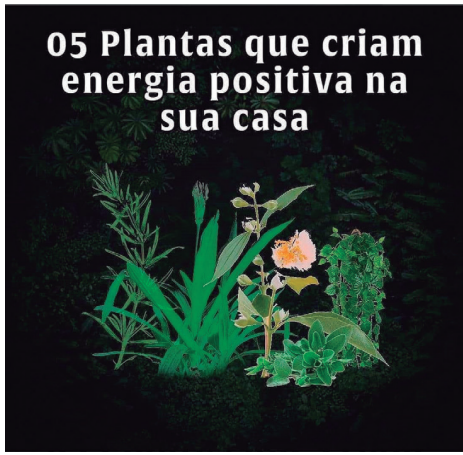
05 Plantas que criam energia positiva na sua casa

1 - Jasmim: as pessoas na Pérsia consideravam esta planta sagrada, graças aos seus inúmeros benefícios, como aumentar os níveis de energia, diminuir os níveis de ansiedade, melhorar a produtividade, aumentar a autoestima e melhorar a qualidade do sono.