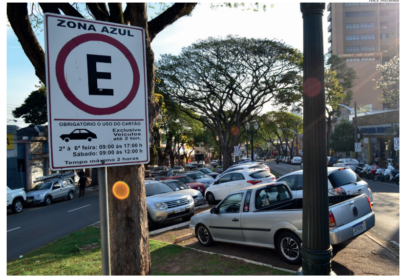
A DECISÃO entendeu pela legalidade do edital, após o trânsito em julgado e feitas as devidas anotações, fica determinado o encerramento dos autos

A concessão contempla a implantação, operação e gestão do Sistema de