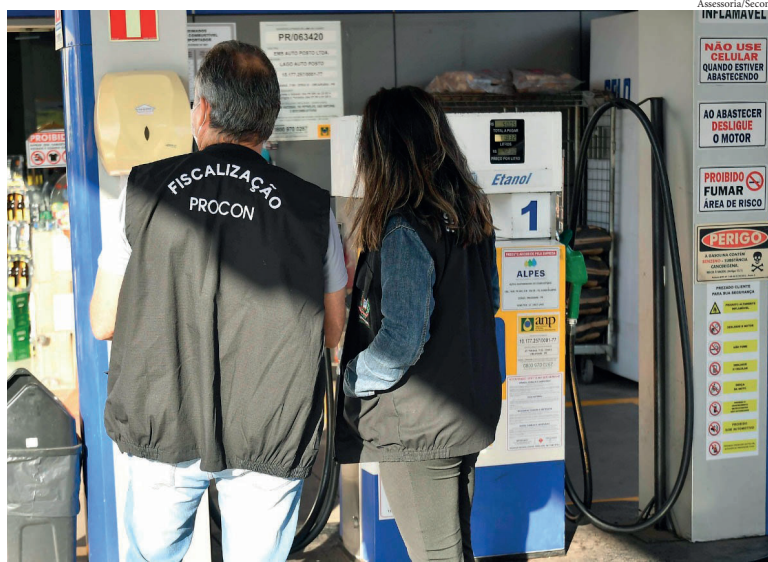
UMA grande variação de preço foi notada na gasolina comum, cuja média subiu de R$ 5,58 para R$ 5,77, no litro

Os combustíveis registraram aumento significativo nos preços, com variação de 3,3% na gasolina comum, 2,7% na aditivada, 2,3% no diesel comum e 2,1% no diesel S10,