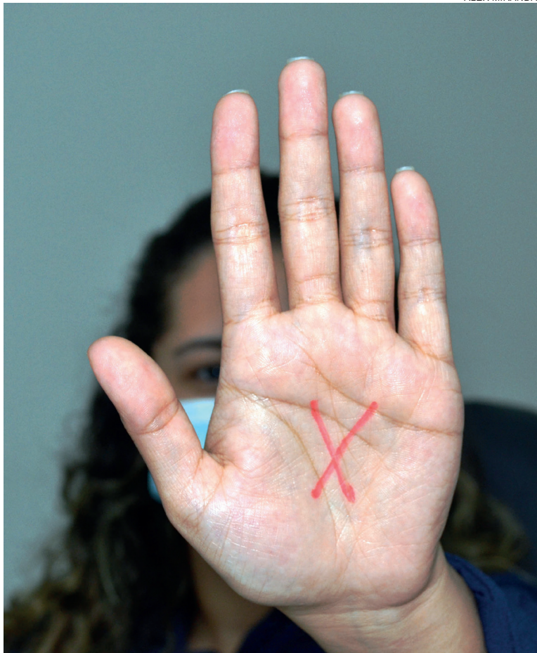
O programa consiste na decodificação de um X gravado na mão da mulher, como um sinal de denúncia de situação de violência em curso

Para facilitar a denúncia e evitar maiores consequências, mulheres vítimas de violência doméstica têm uma alternativa silenciosa, mas eficaz para comunicar que correm