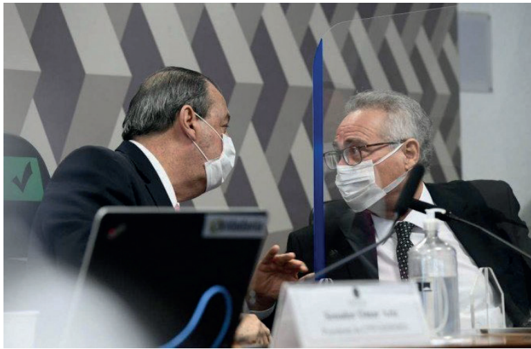
TRIO paranaense figura na lista de políticos organizada pela CPI da Covid que investiga a atuação de políticos na disseminação de fake news sobre a pandemia

Além da lista de políticos, a CPI da Covid investiga a origem de 68 perfis na internet, com milhares de seguidores, que espalharam, por exemplo,