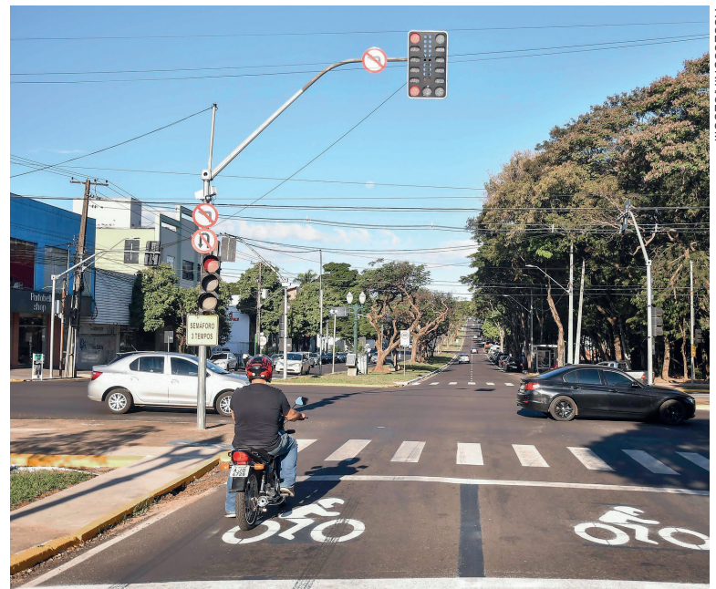
A Umutrans orienta que os demais condutores devem ficar atentos e respeitar o espaço exclusivo dos motociclistas