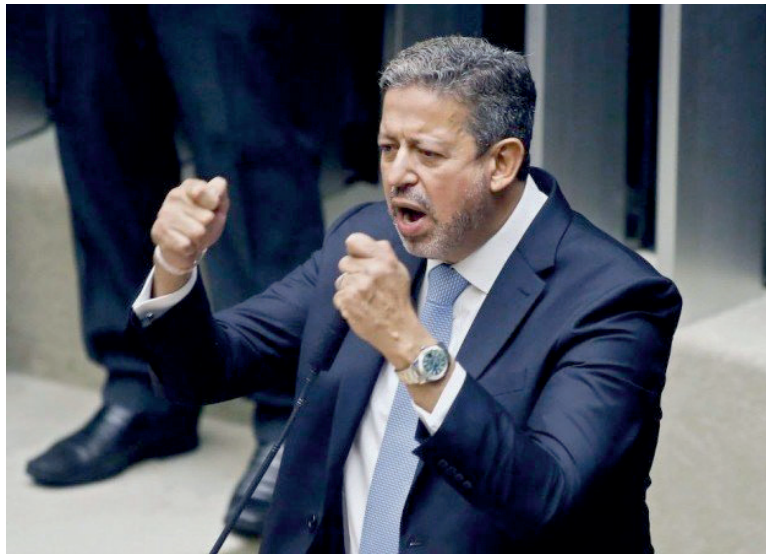
PRESIDENTE da Câmara dos Deputados passou a defender o modelo publicamente e dizer que o assunto tem sido discutido por líderes partidários

semipresidencialismo prevê ainda um período de transição entre o modelo atual (presidencialista) e o novo. Uma das figuras que existirá nesse prazo, que não é definido no texto, é o ministro-coordenador, que será uma espécie de chanceler interino. "Fica criado, enquanto vigorar o atual sistema presidencialista, o cargo de ministro-coordenador", detalha o texto.