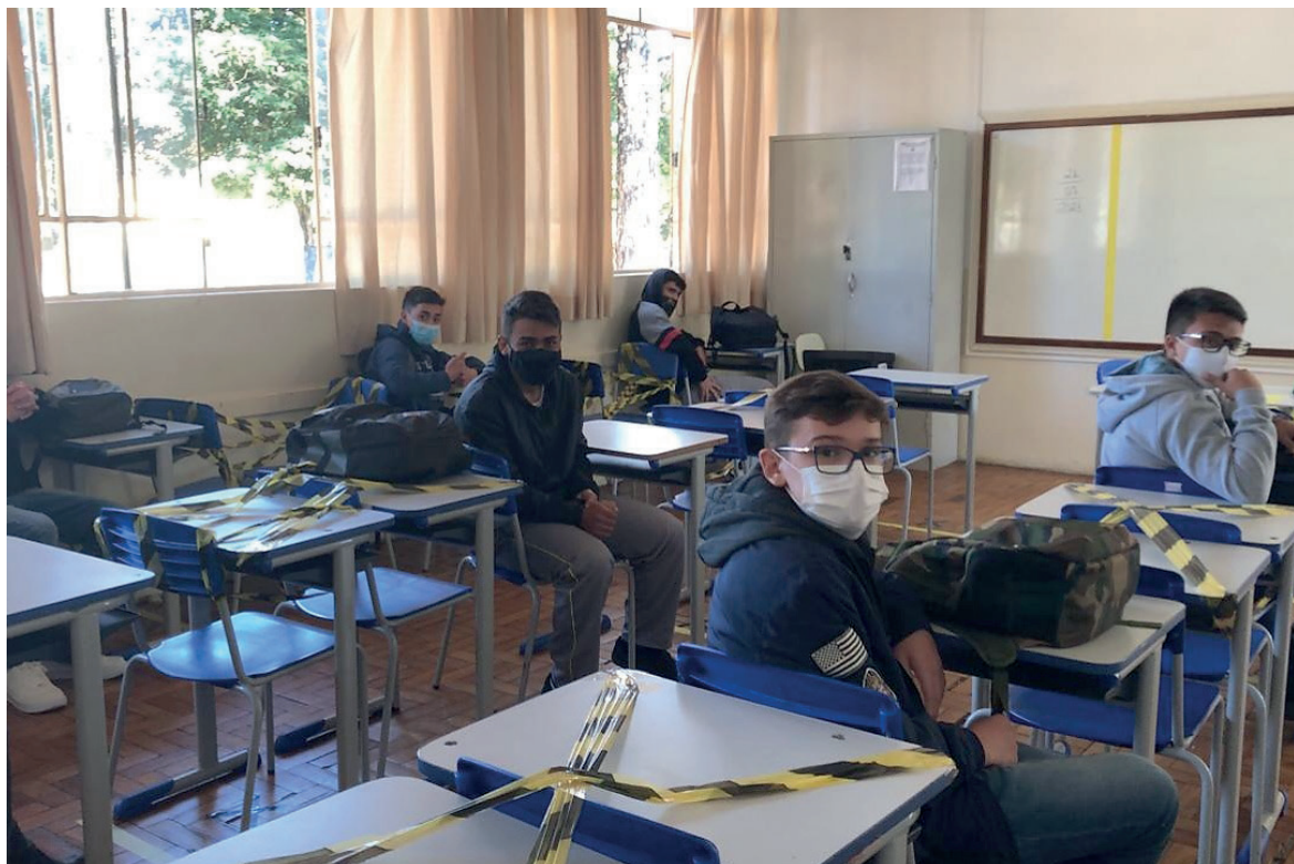
NA área do Núcleo Regional de Educação de Umuarama os portões de 19 escolas foram abertos para pouco mais de 2 mil alunos

Mais de 90% das 2.100 escolas estaduais foram reabertas – total ou parcialmente – ontem (quarta-feira, 21), no retorno do recesso escolar e início do segundo semestre do ano letivo de 2021. São 500 a mais do que no encerramento do primeiro semestre, segundo informa a Secretaria de Estado de Educação e do Esporte.