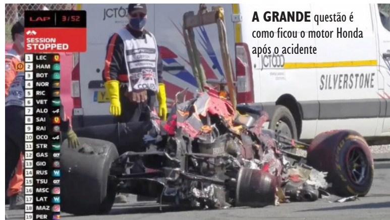
A GRANDE questão é como ficou o motor Honda após o acidente

O preço da forte batida de Max Verstappen é estimado em 750.000 euros. A grande questão é como ficou o motor Honda após o acidente. O fornecedor de motor japonês, espera que os danos não sejam muito graves e que a unidade de potência possa ser reutilizada. Se não, a Red Bull tem um problema.