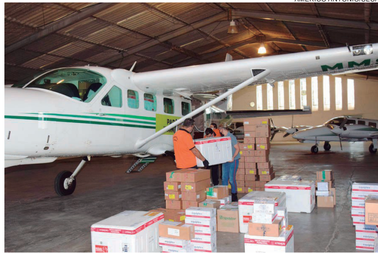
SERÃO 4.404 doses da Pfizer para primeira aplicação — destinadas à 12ª RS de Umuarama. No total, para D1 e D2, a regional recebe hoje 10.342 doses

Os envios acontecem por via terrestre para as Regionais de Paranaguá, Metropolitana,