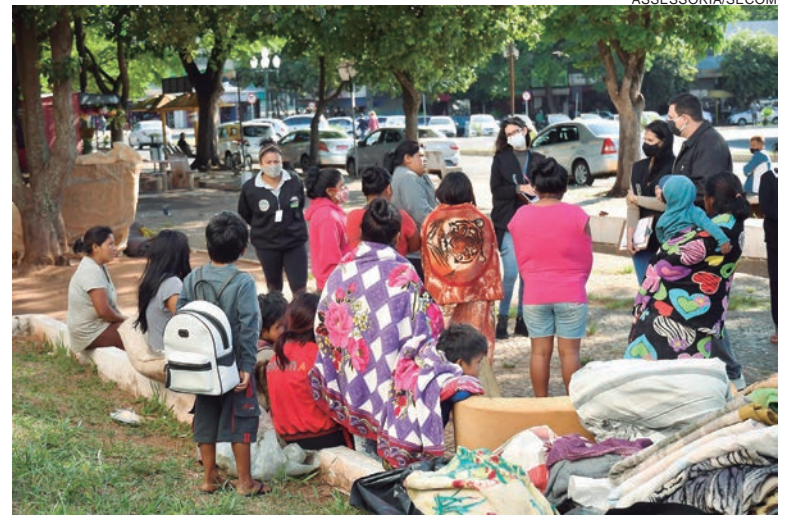
AÇÃO ofereceu acolhida aos cerca de 30 indígenas, adultos e crianças, da etnia caingangue, da aldeia Rio das Cobras de Laranjeiras do Sul