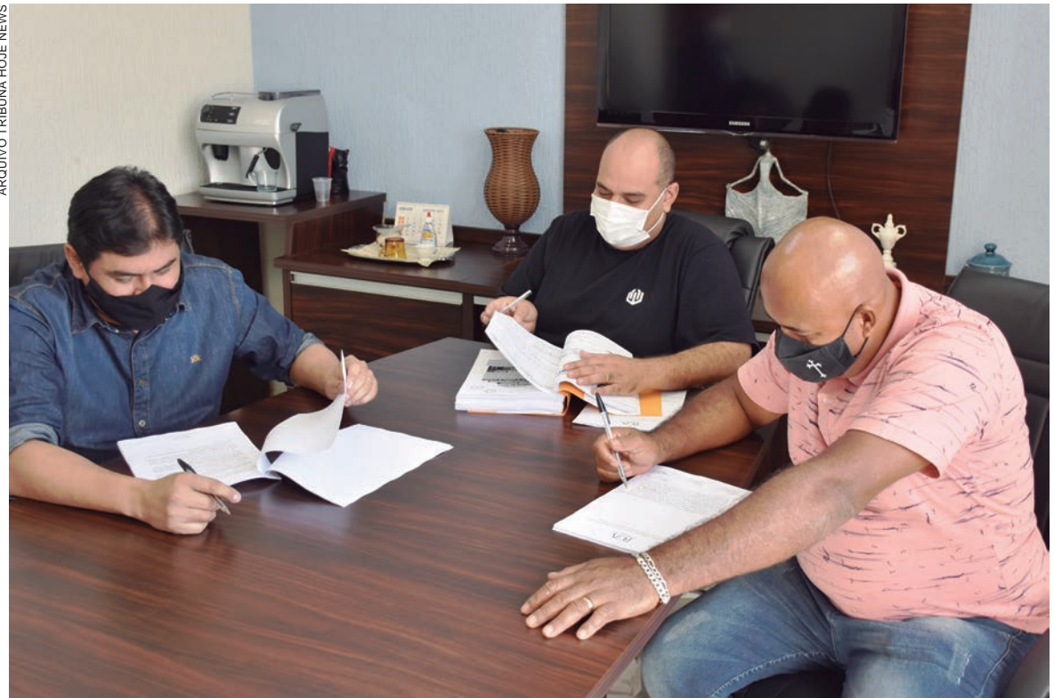
VEREADORES se reúnem para deliberar sobre os trabalhos da comissão e ontem foi decidida a data das oitivas, com prefeito, ex-servidores e ex-secretários