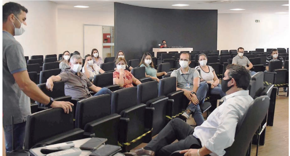
PIMENTEL segue a flexibilização vinda do Governo Estadual e quebra o toque de recolher que proibia a circulação e venda e consumo de bebidas alcoólicas na madrugada

O Decreto Municipal 233/2021 agora acabou com as restrições de horário para livre circulação pelos municípios (popularmente chamado de 'toque de recolher') e retira a proibição da comercialização e consumo de bebidas em espaços públicos. Continua