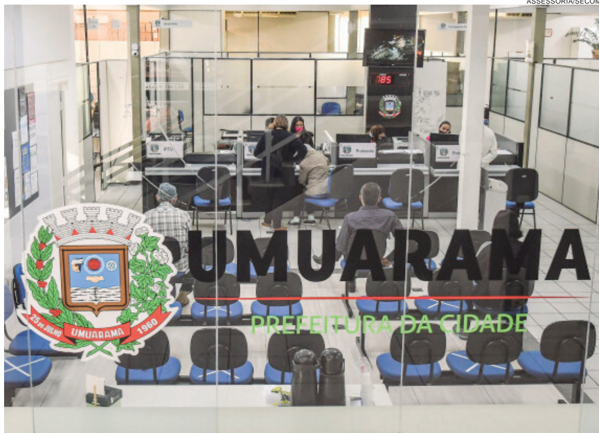
AS contratações são para preenchimento de vagas e formação de cadastro de reserva de estágio remunerado e 10% das vagas são reservadas para estudantes com deficiência

As bolsas auxílio variam de R$ 540,00 a R$ 790,00 mais R$ 60,00 de vale-transporte, que totalizam de R$ 600,00 a R$ 850,00 mensais, para um período máximo de dois anos de contrato. Os candidatos serão chamados de acordo