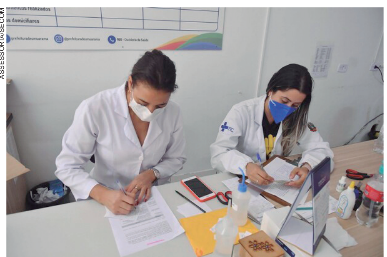
PROFISSIONAIS de Saúde verificaram que entre os 31 novos casos, 12 são de mulheres, 14 homens e cinco de crianças infectadas pela doença

Até ontem (20), a Secretaria de Saúde acumulava 40.458 notificações de síndromes