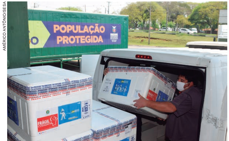
COM a ajuda das vacinas, o Paraná dará início a mais uma etapa da campanha de vacinação com a aplicação das doses de reforço (terceira dose)

Segundo os dados do Vacinômetro, o Paraná já aplicou 12.412.029 doses, sendo 7.894.999 primeiras doses; 322.484 doses únicas (DU) e 4.195.414 segundas doses (D2). O Estado já atingiu 94,23% da população adulta, estimada em 8.720.953 pessoas com, pelo menos, uma dose.