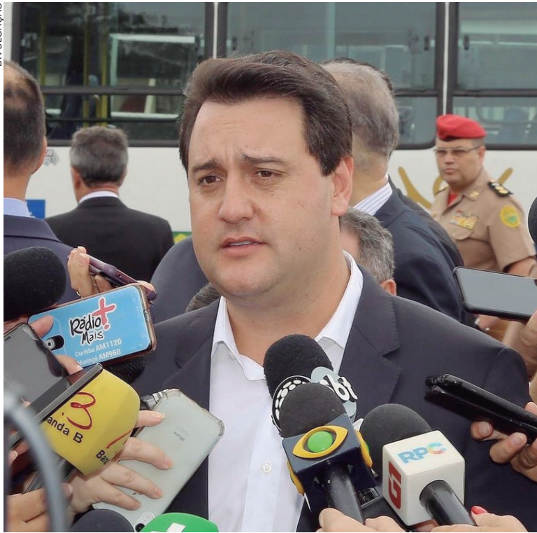
ALÉM do paranaense, outros seis governadores não assinaram o texto que rebate acusações do presidente, com relação ao aumento do ICMS no combustível

De acordo com carta, nos últimos 12 meses, o preço da gasolina registrou um aumento superior a 40%, “embora nenhum Estado tenha aumentado o ICMS incidente sobre os combustíveis”. Para os signatários, o problema envolvendo