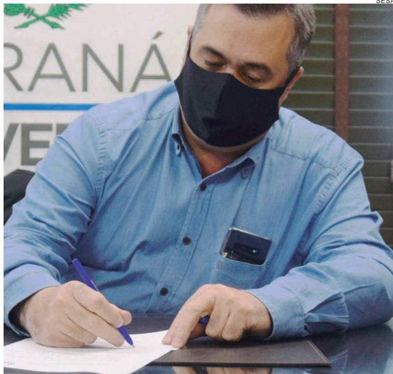
BETO Preto ressalta que a doação desonera os municípios, que podem realocar bens para o gerenciamento da frota, que muitas vezes precisa ser dinamizada

“O repasse dos veículos aos municípios viabiliza a continuidade de serviços que já estavam sendo realizados e que