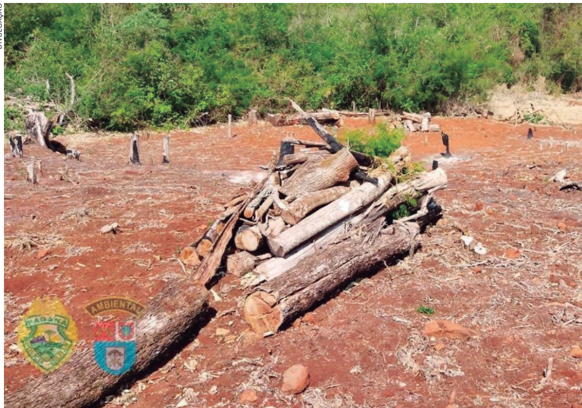
FOI descoberta a extinção de aproximadamente 1 hectare de vegetação nativa do bioma Mata Atlântica

Além do crime de tentativa de homicídio, o homem preso responderá por todos os crimes ambientais citados anteriormente, bem como receberá as respectivas autuações administrativas. Os policiais tiveram algumas escoriações leves e passam bem.