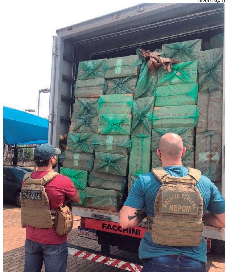
O motorista do caminhão foi acusado também por ter oferecido propina aos policiais para se livrar da prisão

Policiais militares de Umuarama localizaram por volta das 6h30 de ontem (28) um caminhão Volvo, ano 2010, de São Paulo, carregado com 800 caixas (400.000 maços) de cigarros, da marca GIFT de origem Paraguaia. A ação aconteceu durante um patrulhamento pela rodovia PR-323, perto do trevo de acesso ao Jardim Arco-íris. Foi visualizado o caminhão que entrava em um posto de combustíveis. Assim que o motorista notou a aproximação da viatura, mudou rapidamente de direção, fator que chamou a atenção dos PMs. Foi feita a abordagem e, na consulta do emplacamento constava que o mesmo seria de cor branca, diferentemente da cor atual, que era preta. Na conferência da carga, os policiais encontraram o contrabando. O motorista disse que levaria para Curitiba e aceitou o caminhão para pagar a dívida da uma fiança, pela última vez que foi preso, também pelo crime de contrabando.