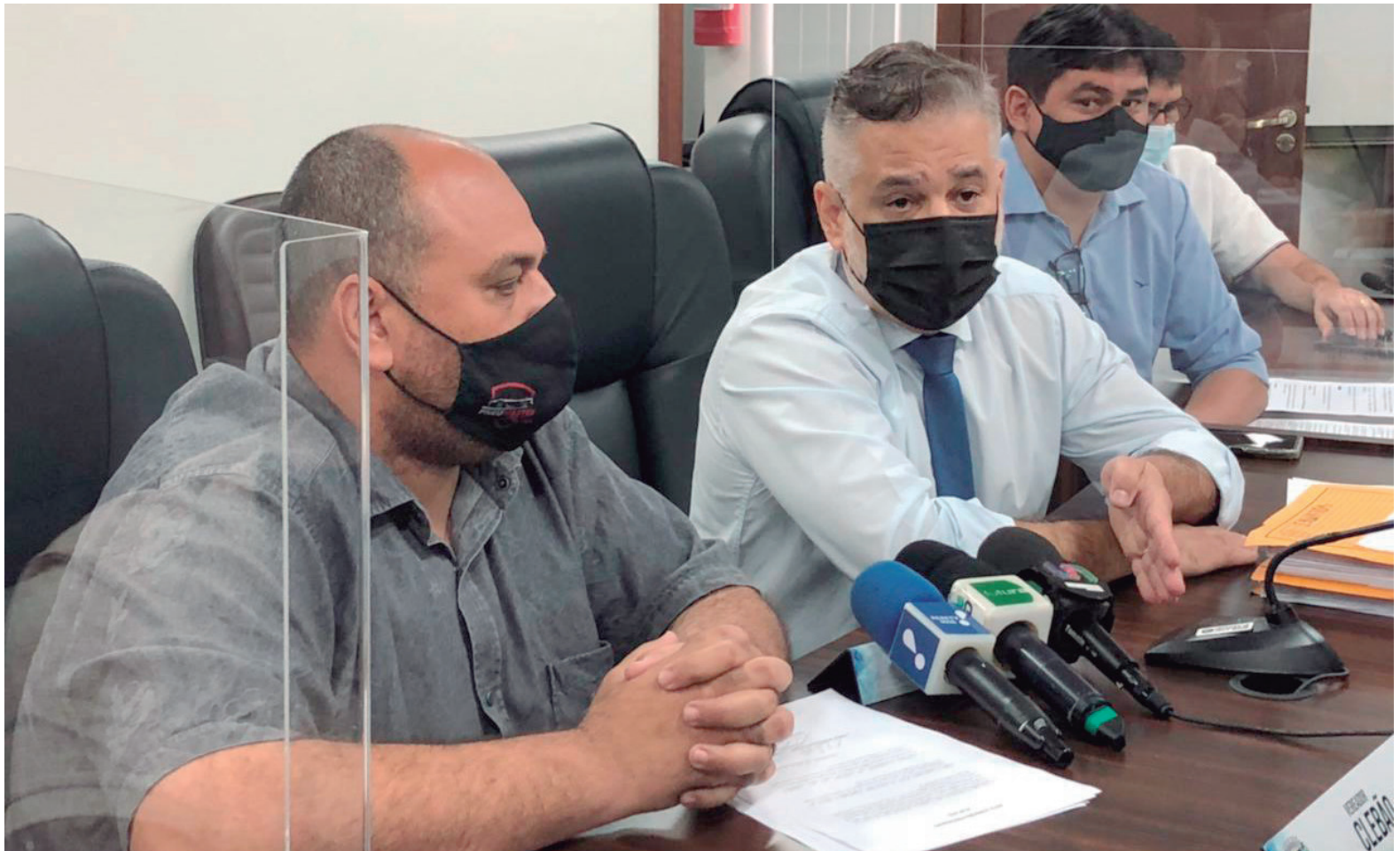
PROCURADOR Jurídico, acompanhou os membros da Comissão e explicou detalhes do trâmite, além do prazo de 10 dias para recorrer em busca de reverter a suspensão

Liminarmente, ou seja, sem julgar o mérito da questão,