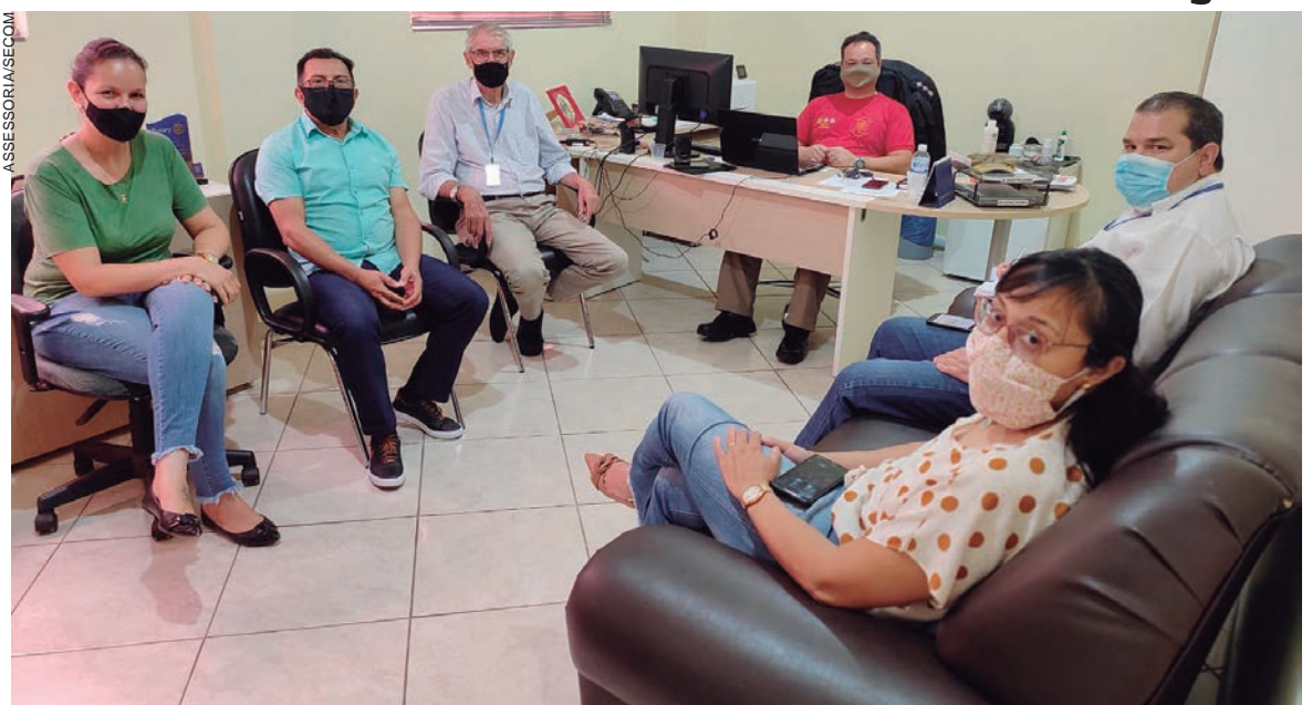
Os detalhes foram acertados em reunião com na sede do 6º Subgrupamento de Bombeiros Independente – Corpo de Bombeiros de Umuarama