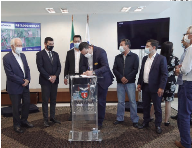
O governador Ratinho Junior (PSD) assinou convênio para pavimentação de estrada rural e disponibilizou R$ 3 milhões em investimentos

“O trecho a ser pavimentado será muito importante para o desenvolvimento local e vai contribuir com o