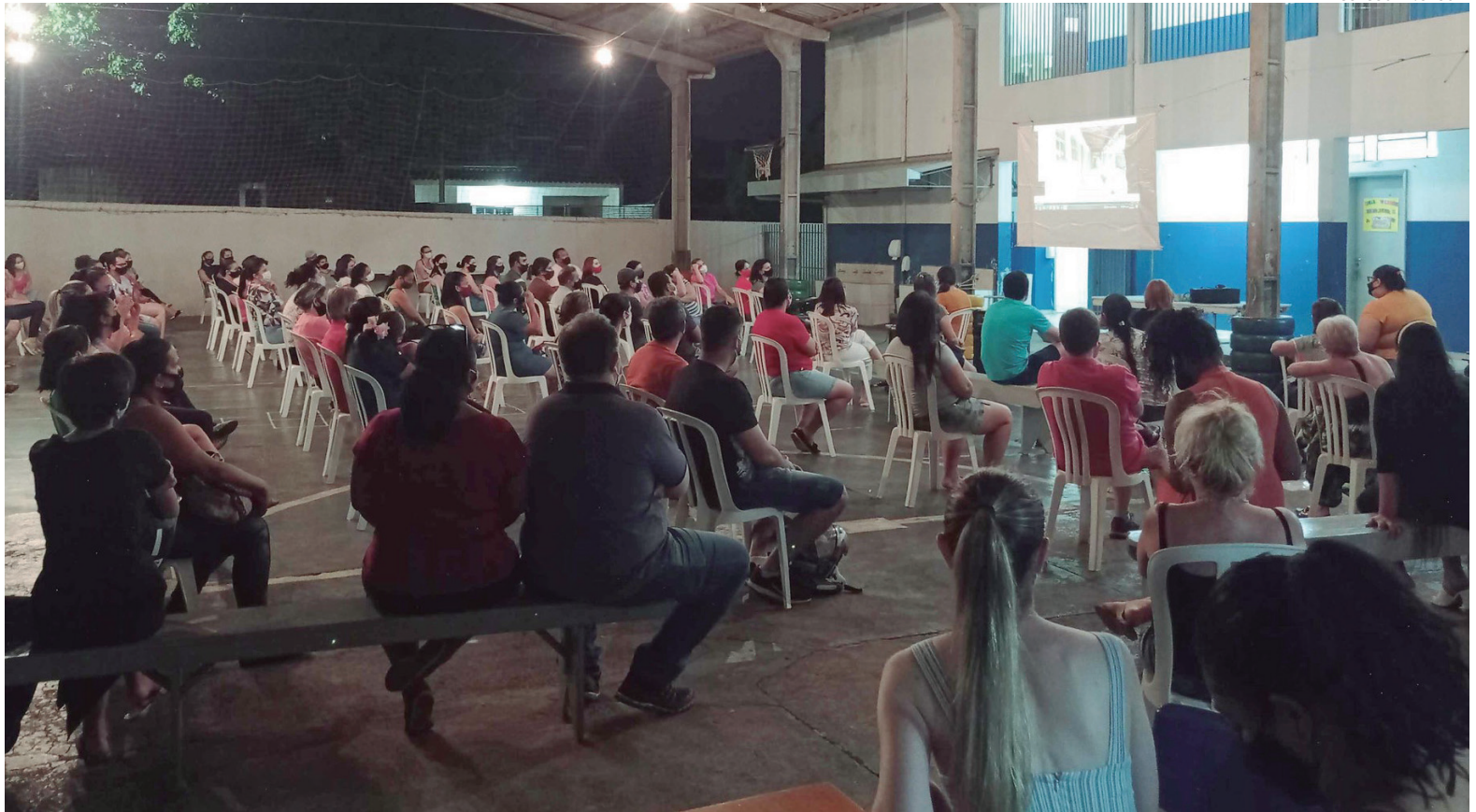
A comunidade escolar se reuniu para decidir sobre a mudança de endereço e a possibilidade de um novo nome para a escola

A diretora contou que, num segundo momento, a proposta era com relação à mudança da carga horária para o sistema de atendimento em tempo integral, que também foi recebida com euforia pela comunidade escolar – que inclui também professores