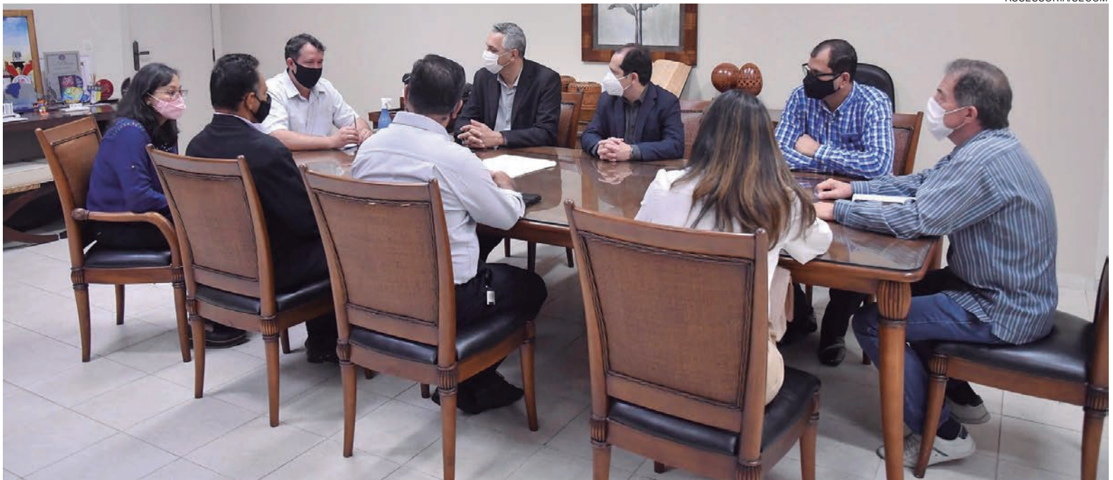
DAS 16 vagas existentes no Crevd, oito são para atendimento de pacientes das unidades de saúde (por meio do SUS), porém exclusivas para homens

Das 16 vagas existentes no Crevd para tratamento de dependência química, oito são contratadas pelo município para encaminhamento de pacientes atendidos nas unidades de saúde (por meio do SUS), porém exclusivas para