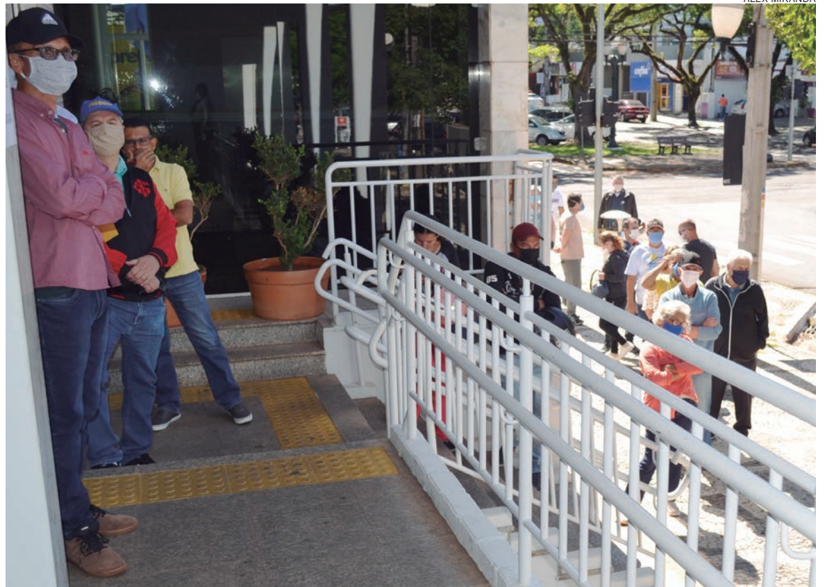
ALÉM da aplicação das multas, outros nove processos também foram instaurados por reclamações individuais de consumidores

O secretário esclarece que os valores arrecadados por meio das multas impostas pelo Procon são destinados, integralmente, ao Fundo Municipal de Direitos Difusos (FMDD), e os recursos têm destinos variados, sempre com o objetivo de custear as