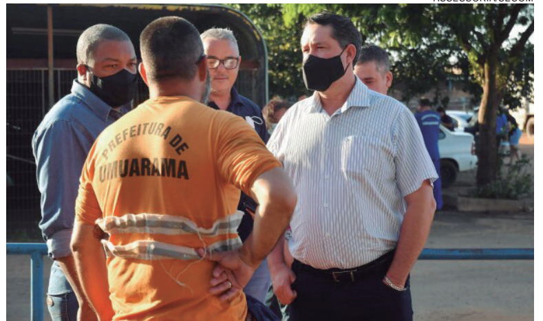
PREFEITO interino vai tentar garantir aos servidores municipais o recebimento do reajuste concedido em janeiro deste ano