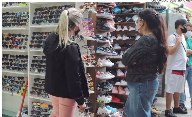
ESPECIALISTAS dos setores em alta apontam que os números são resultado da movimentação econômica, alavancada pelos índices de imunização no Estado

Especialistas dos setores em alta apontam que os números são resultado direto da movimentação econômica, alavancada pelo aumento dos índices de imunização no Estado. “O resultado positivo é decorrente do programa nacional de vacinação implementado pelos órgãos