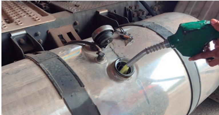
CAMINHONEIROS prometem parar e reivindicam aposentadoria especial e fim da política de preço da paridade de importação da Petrobras para combustíveis