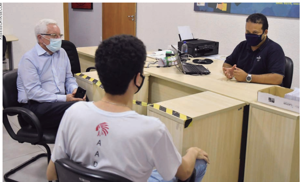
OS MEI movimentam um grande volume de recursos na economia de Umuarama e o microcrédito é uma ferramenta efetiva para a expansão das atividades

Empresas em início de atividade (menos de 12 meses) podem financiar até R$ 5 mil. Já em fase de consolidação (mais de 12 meses, somando o tempo de atividade formal e informal) o valor aumenta para até R$ 10 mil. E empresas em expansão (mais de 12 meses de atividade) podem contratar até R$ 20 mil. A carência é de três meses e o prazo máximo para pagamento (incluindo a carência) é de 36 meses.