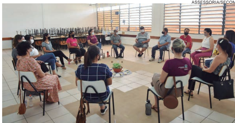
O círculo tem o objetivo de fortalecer vínculos, possibilitando ao participante reconectar-se com suas histórias, promovendo autoconhecimento

momentos como esses são importantes para o cuidado com a saúde mental dos profissionais, “além de desenvolver um sentimento de pertencimento, acolhida e cuidado com toda a equipe”, acrescentou.