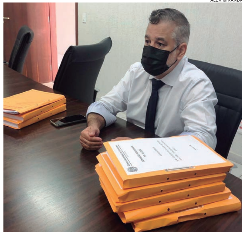
COMISSÃO Processante pode deixar de ouvir as demais testemunhas e inclusive o prefeito afastado durante o processo

De qualquer forma, segue mantido o cronograma para a