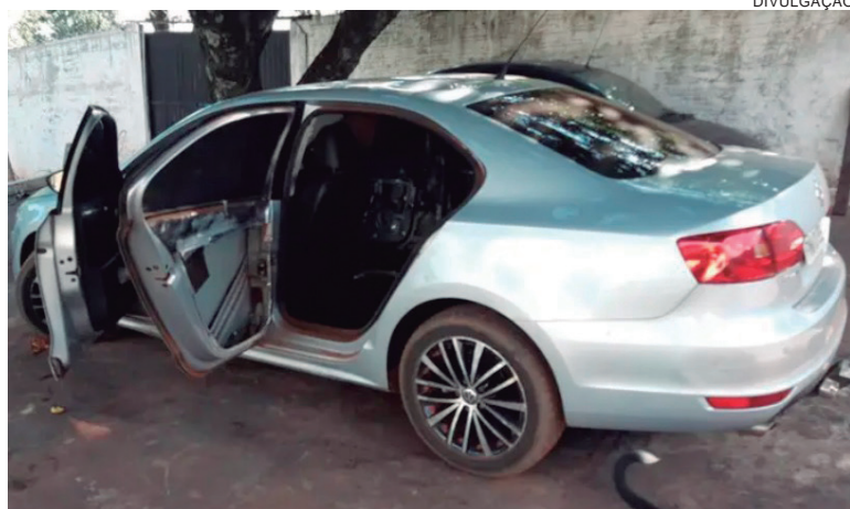
JETTA que havia sido preparado para ser usado no transporte de mercadorias ilícitas foi apreendido dentro de uma residência

Será instaurado um inquérito policial para investigar o