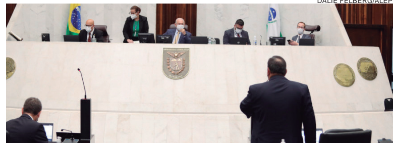
DEPUTADOS aprovaram proposta do Poder Executivo que altera a remuneração dos coordenadores das atividades cívico-militares nos colégios estaduais

O montante, de acordo com o Governo do Estado, já está