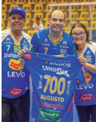
A quadra foi o lugar mais visitado durante 20 anos pelo atleta de 35 anos