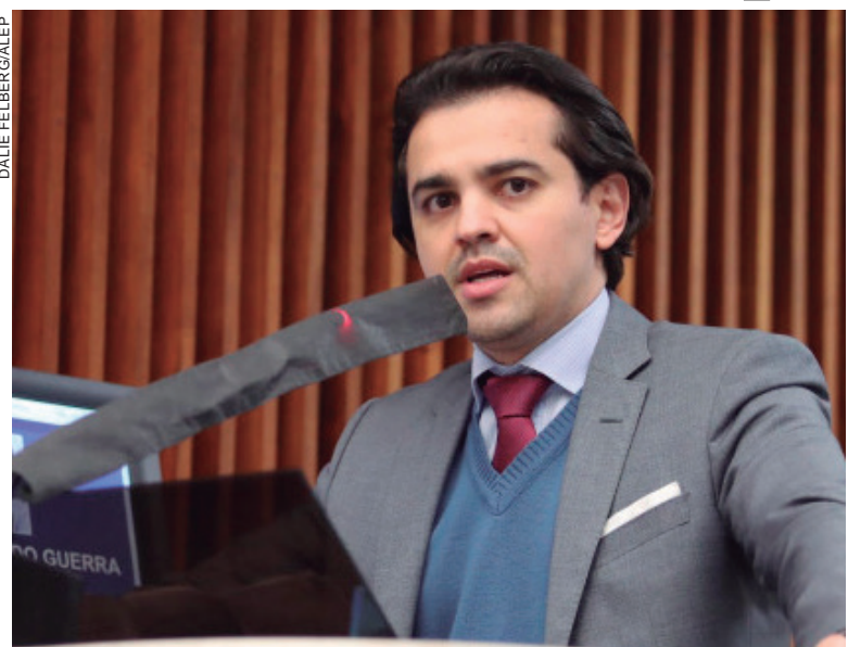
BLOCO é formado pelo PSL e pelo PTB cujas bancadas são integradas por cinco deputados na Assembleia Legislativa do Paraná