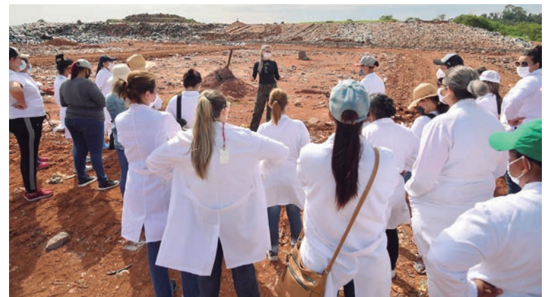
OS alunos conheceram as células de deposição, lagoas de tratamento e a usina de processamento de resíduos da construção civil

Em seguida, o grupo conhece a Cooperativa dos Trabalhadores e Prestadores de Serviço na Reciclagem