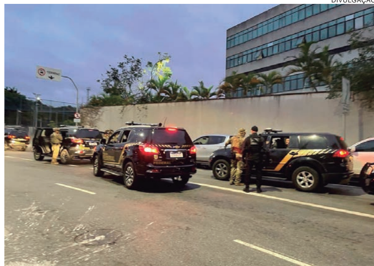
POLICIAIS Federais cumpriram mandados de prisão preventiva e de busca e apreensão em seis Estados

Os investigados responderão pelos crimes de furto qualificado