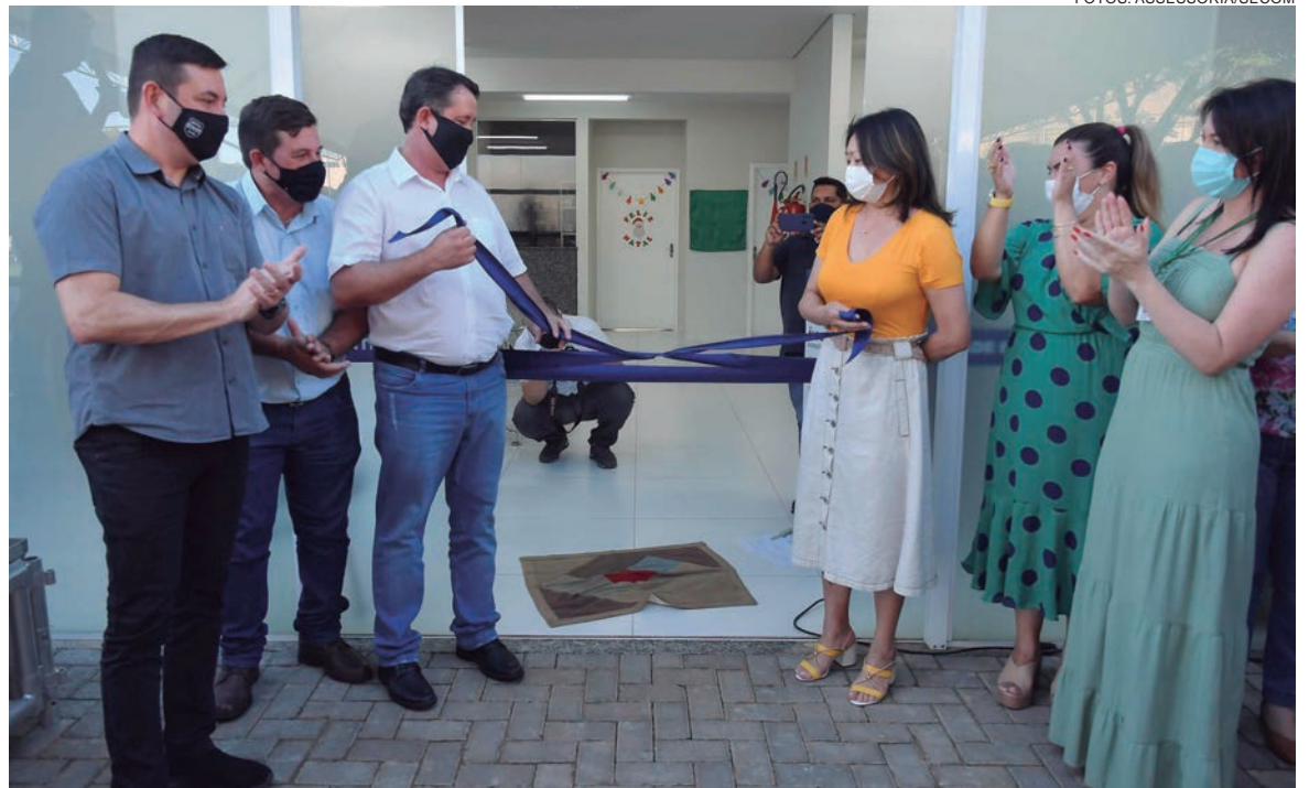
POSTO de Saúde Central unidade tem área construída de 416,08 m 2 e é uma das mais modernas do Noroeste do Paraná, tendo inclusive a própria usina de oxigênio