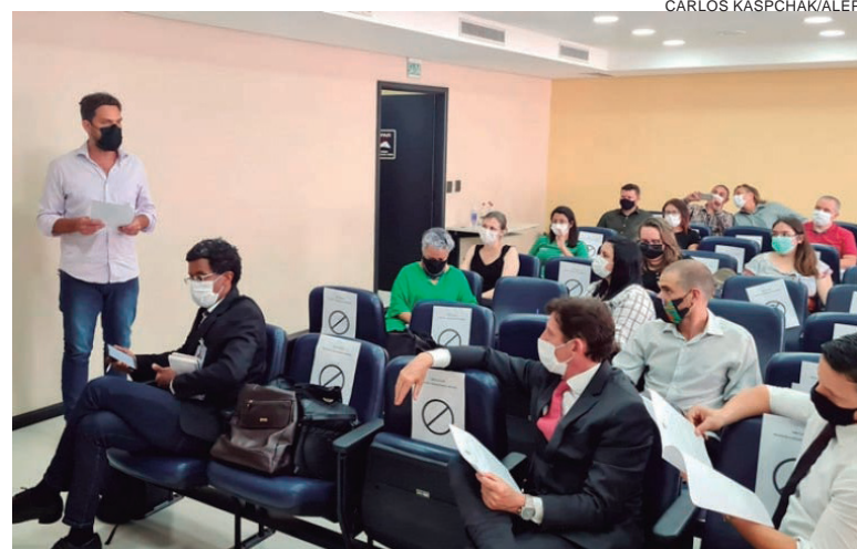
COMISSÃO de Meio Ambiente da Alep integra o grupo de trabalho que vai fiscalizar acordo da Petrobras no caso do desastre ambiental no Rio Iguaçu

A Petrobras firmou acordo para pagamento de quase R$ 1,4 bi de indenização por danos ambientais pelo vazamento de quatro milhões de litros de petróleo no Rio Iguaçu pela Refinaria Presidente Getúlio Vargas, em Araucária, na RMC, em 16 de julho de 2000. O desastre causou graves prejuízos ambientais que têm impactos até os dias atuais.