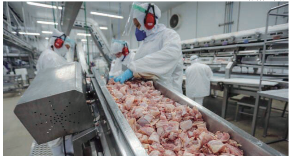
CONFORME o levantamento da Sejuf, Umuarama ocupa a oitava colocação entre as 216 agências do Estado, em números absolutos

“Além de suspender a necessidade de agendamento, o que já agiliza o