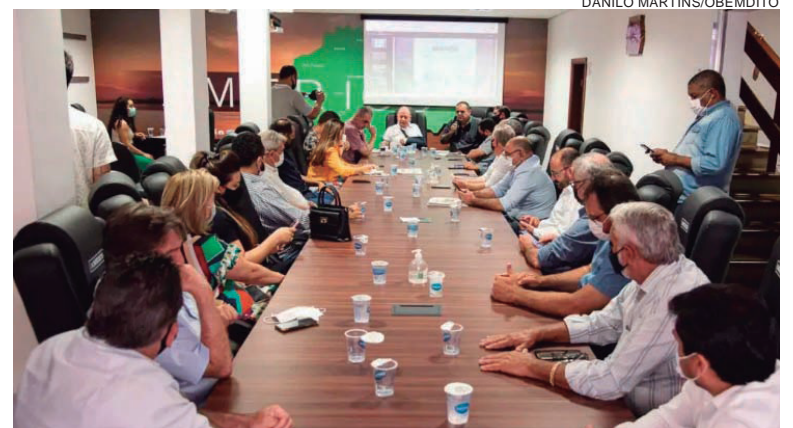
SECRETÁRIO fez o anúncio de investimentos do governo do Estado na região e lembrou sobre a nova estação rodoviária financiada pela SEDU

Em Umuarama, uma grande construção que conta com recursos do governo estadual e financiamento da SEDU