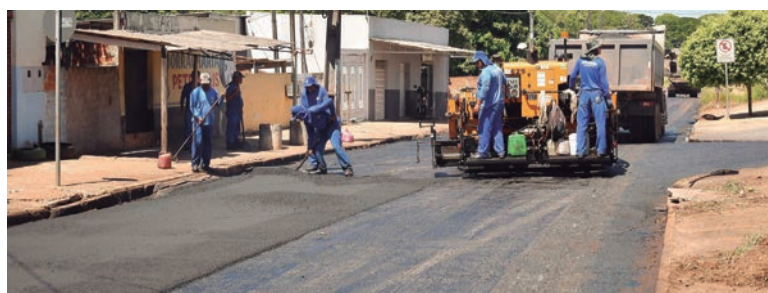
EXECUTADAS com mão de obras da Prefeitura, o trabalho tem o objetivo de melhorar as condições de tráfego, dando mais segurança e conforto aos usuários

A rede principal com mais de 800 metros de galerias já foi implantada, bem como as travessas. Já as bocas de lobo serão construídas após a terraplenagem e aplicação de solo-cimento. Com o novo acesso, não será mais necessário transitar pela rodovia PR-323 para chegar ao aeroporto.