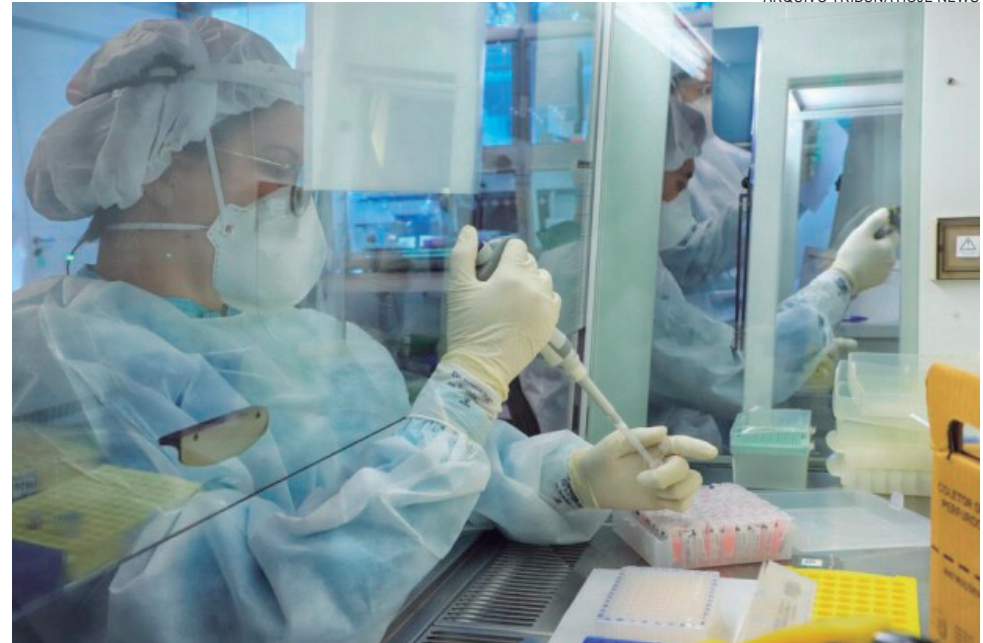
NA última sexta-feira (3) foram diagnosticados 13 pacientes positivados e ontem (segunda-feira, 6) outros 24 novos casos foram confirmados