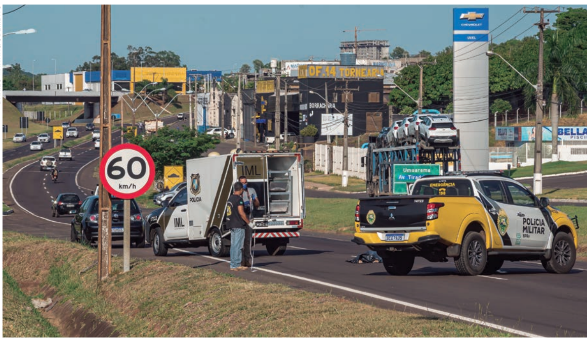
CORPO do homem atropelado ficou estirado no asfalto e coberto por uma lona até a chegada das autoridades

Durante os levantamentos feitos por peritos da Polícia Científica, acabou-se verificando que o homem foi arremessado a uma distância de 38,5 metros do ponto da colisão. Já a Polícia