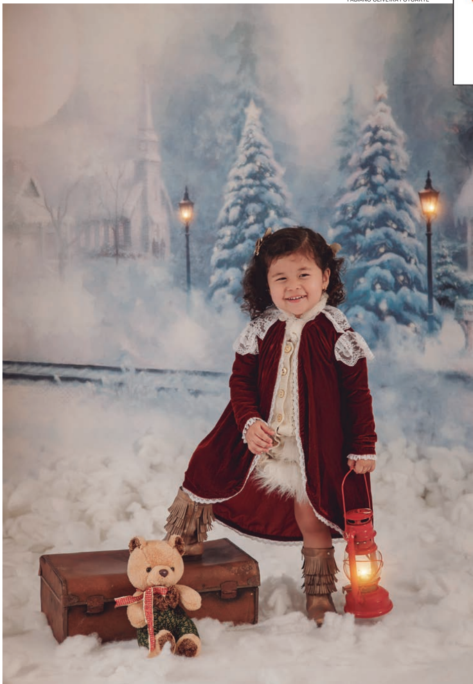
FABIANO OLIVEIRA FOTOARTE