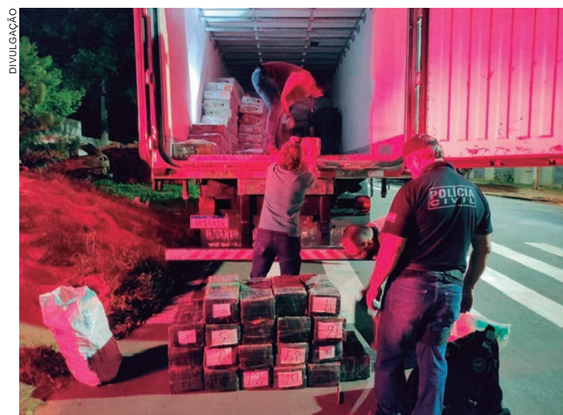
DROGA estava escondida no baú frigorífico onde era transportada uma carga de frango congelado

Havia um veículo GM Astra de cor prata que o