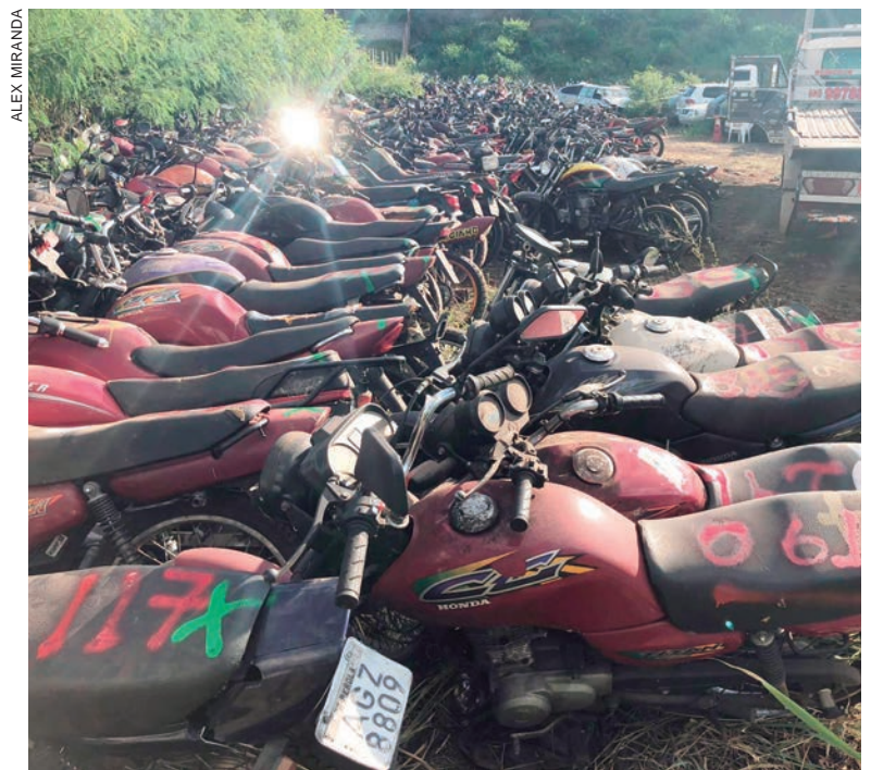
ALÉM dos espaços do Detran e da Polícia Militar, foram leiloados, por força de convênio, veículos que estavam nos pátios de diversas delegacias da PC

Os leilões de reciclagem neste ano contemplaram 287 pátios distribuídos em 218 municípios do Estado.