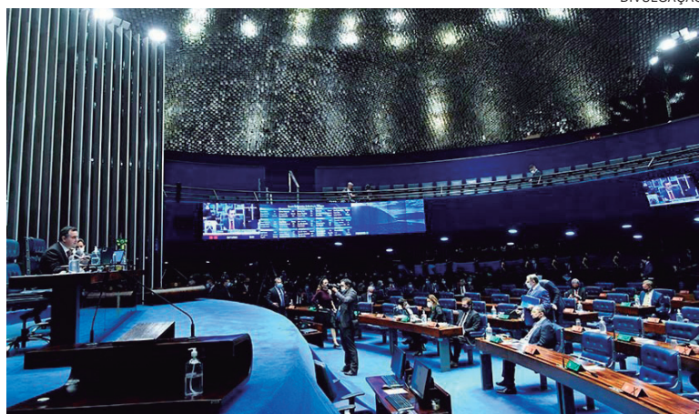
O projeto já havia sido aprovado no Senado, passou por mudanças na Câmara dos Deputados e agora volta para a decisão final dos senadores

A propaganda partidária não tem relação com o horário eleitoral. Trata-se de uma inserção anual garantida aos partidos políticos com registro no Tribunal Superior Eleitoral (TSE). A ferramenta foi extinta na reforma eleitoral de 2017 e é recuperada pelo projeto que pode ser votado na quarta-feira.