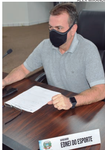
AUTOR do projeto retirou o texto da pauta, fazendo pela segunda vez, um pedido de vistas à proposição

O parlamentar tem a intenção de isentar do Imposto Predial, Territorial e Urbano (IPTU), empresas do setor econômico ligadas ao esporte. Entre elas estão inclusas as academias de ginástica, de lutas, de musculação, de dança, de atividades esportivas, estúdios e similares. O pedido é decorrente dos efeitos econômicos da pandemia provocada pela covid-19. Por conta do pedido de vistas aprovado, o projeto foi retirado de pauta e, desta forma, não foi submetido à votação.