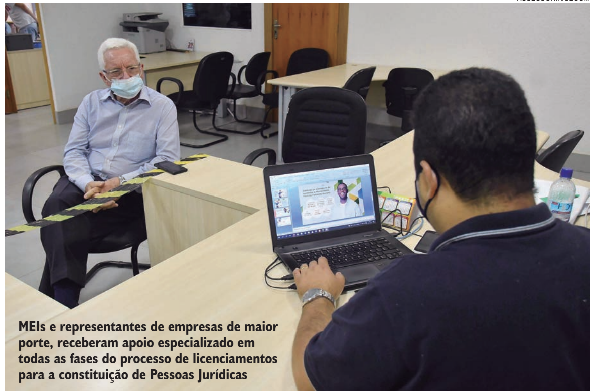
MEIs e representantes de empresas de maior porte, receberam apoio especializado em todas as fases do processo de licenciamentos para a constituição de Pessoas Jurídicas

De janeiro a dezembro a Casa do Empreendedor de