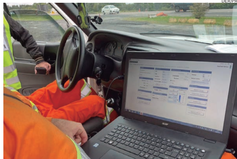
AUDITORIA do Departamento de Estradas de Rodagem vê problemas no pavimento em todos os lotes do Anel de Integração

Durante os levantamentos de campo também foi avaliado o índice de gravidade global (IGG) das rodovias, que atribui um parâmetro numérico à deterioração do pavimento. Neste caso foram analisados os defeitos de superfície, como