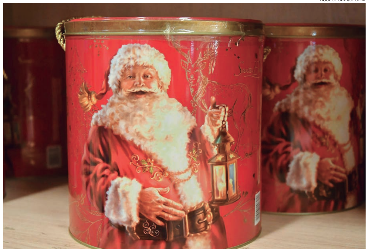
O chocotone com 400 gramas, encontrado em um supermercado a R$ 6,99, foi visto em outro com o preço de R$ 12,70, uma variação de 143%

Deybson Bitencourt, secretário do Procon, reforça a necessidade de pesquisar antes de comprar. “No caso desta pesquisa realizada no dia 21 de dezembro, foram