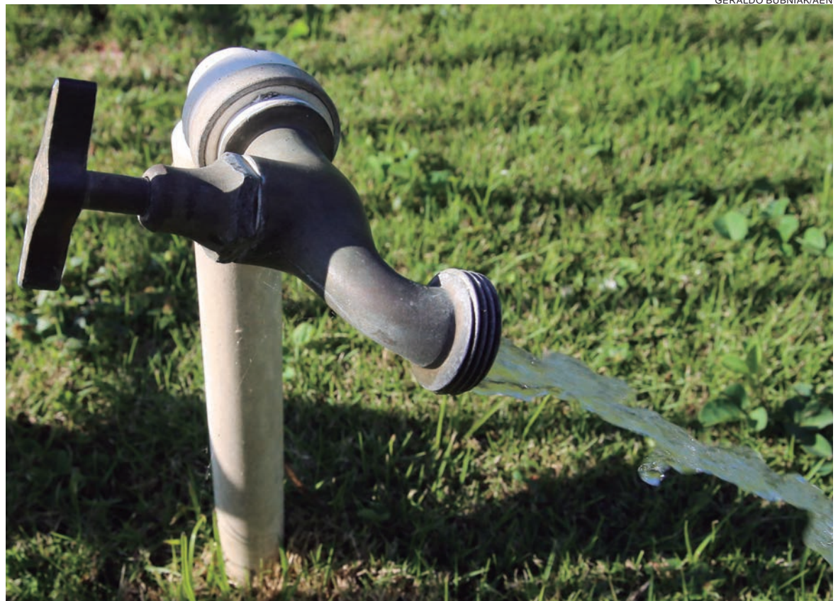
DESPERDÍCIO e mau uso da água potável pode afetar o abastecimento à toda a população de Umuarama

Conforme recomendação da ABNT (Associação Brasileira de Normas Técnicas) é importante que todos os imóveis tenham reservatórios. A Sanepar sugere que cada imóvel tenha uma caixa-d'água de pelo menos 500 litros. Assim, é possível ter água por 24 horas, no mínimo.