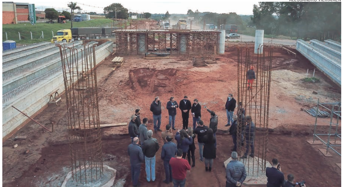
COM investimento de R$ 66,1 milhões, o novo trevo do Gauchão resolve o principal gargalo logístico para os que chegam por Guaíra, vindos do Paraguai ou do MS

Estão em andamento ainda a restauração em concreto (whitetopping) da PRC-280 entre Palmas e Santa Catarina, a correção de greide em pontos de alagamento da PR-650