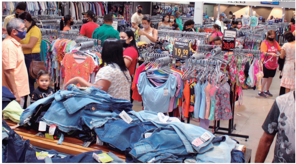
A campanha atingiu até a noite de quinta-feira, 364 mil cupons cadastrados, registrando a participação aproximada de 36 mil consumidores

De qualquer modo, após um período prolongado de dificuldades, o ‘aquecimento’ plausível das vendas é sinônimo de alento e confiança. “O resultado está dentro das expectativas. Marca essa retomada que aguardávamos ansiosamente”, ressalta o gerente da loja Magazin