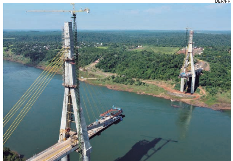
NA implantação da rodovia de acesso entre a ponte e a BR-277, a perimetral leste de Foz do Iguaçu, os trabalhos continuam avançando nos viadutos

Com a conclusão dos mastros principais em ambos os lados, os trabalhos agora estão concentrados no posicionamento das aduelas metálicas, das lajes pré-moldadas e na concretagem das mesmas para compor o tabuleiro da ponte, e no tensionamento dos estais no vão central e dos estais de retaguarda. Em ambos os canteiros também está em andamento a pré-montagem das aduelas metálicas que serão posicionadas em breve. A ponte terá 760 metros de