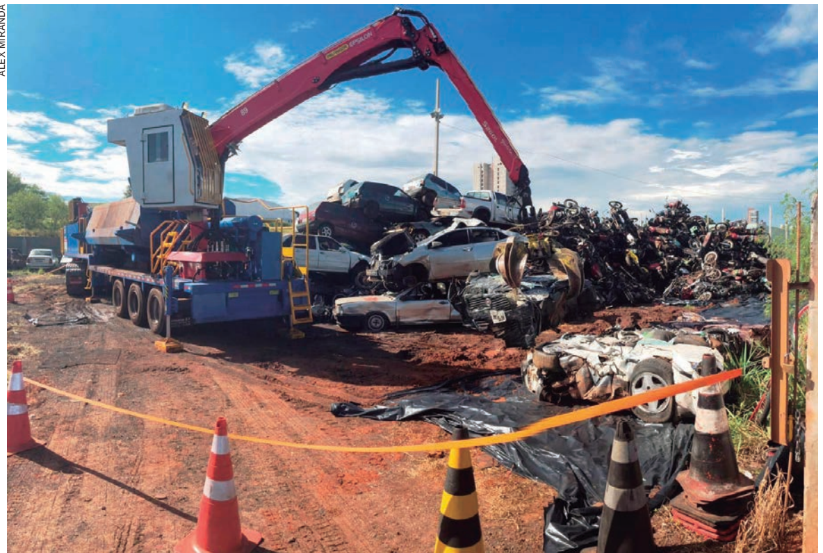
CARROS e motos que ocupavam pátios das Polícias Civil e Militar estão sendo prensados depois que foram leiloados pelo Governo do Estado

De acordo com o Governo do Paraná, os recursos arrecadados com tais leilões servirão para quitar as dívidas acumuladas com multas, taxas, impostos e gastos com a estadia e remoção dos veículos.