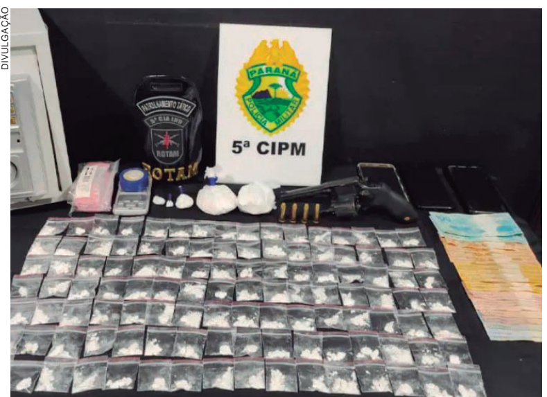
TODA a droga foi apreendida em dois imóveis com o casal acusado de tráfico de drogas

Um casal foi preso por policiais militares, sob a acusação de tráfico de drogas, em Cianorte (cidade localizada a 95 quilômetros de Umuarama). Na casa do homem os policiais encontraram uma arma e papetes de cocaína. A ocorrência foi encaminhada para a sede da 21ª Subdivisão Policial.