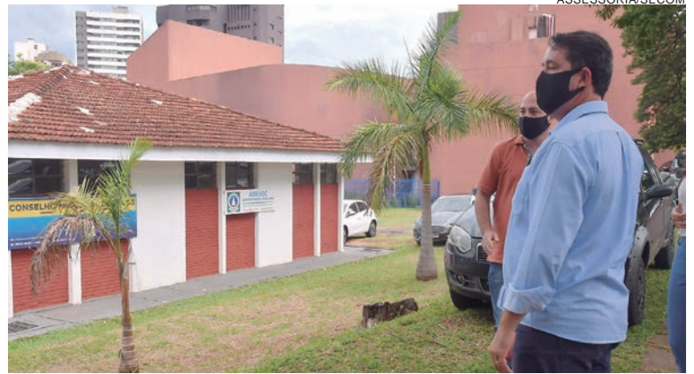
O terreno tem 2.145,17m 2 e fica localizado na Avenida do Rio Branco, ao lado do Centro Cultural Vera Schubert

Centro Cívico abrigará instalações administrativas de secretarias hoje instaladas em prédios de terceiros, como a Saúde, ou em imóveis cedidos de forma condicional ao município, como a Assistência Social. “Além da economia