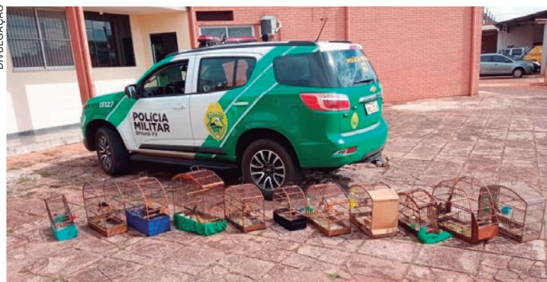
AVES estavam presas em gaiolas e foram recolhidas pela Polícia Ambiental depois de uma denúncia feita à Promotoria de Justiça

Na ocasião, dois homens foram encaminhados para a sede da Companhia da Polícia Militar para lavratura das medidas administrativas. Foram lavrados quatro autos de infração por crimes ambientais, além de multa no valor de R$ 15.500. Os pássaros foram