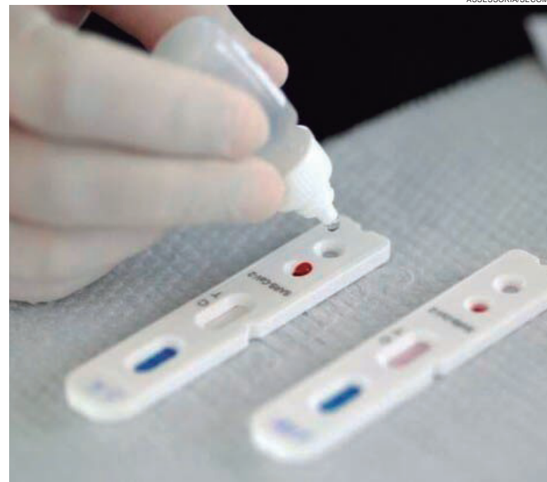
LABORATÓRIO de Umuarama que anunciou exame de covid a R$ 59,90 estaria cobrando R$ 90 no balcão

Janeiro começou registrando um aumento expressivo de casos de covid-19 em Umuarama e, mais que isso, um grande número de pessoas com sintomas gripais tem lotado a Tenda Covid. “Esses fatores foram responsáveis por também fazer aumentar a busca por laboratórios particulares que realizam exames rápidos de covid na cidade. A atuação desta Secretaria leva em consideração o atual cenário que envolve a nova escalada de casos. Estamos atentos às movimentações do setor”, pontuou.