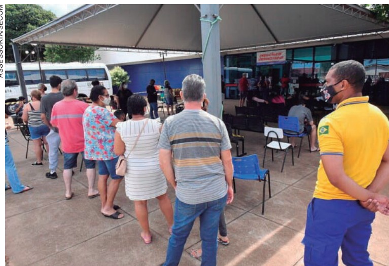
DESDE março de 2020, 21.133 pessoas foram diagnosticadas com a doença e 20.582 se recuperaram

RT-PCR e mais 67 testes rápidos de antígenos, com 27 tendo resultado positivo.