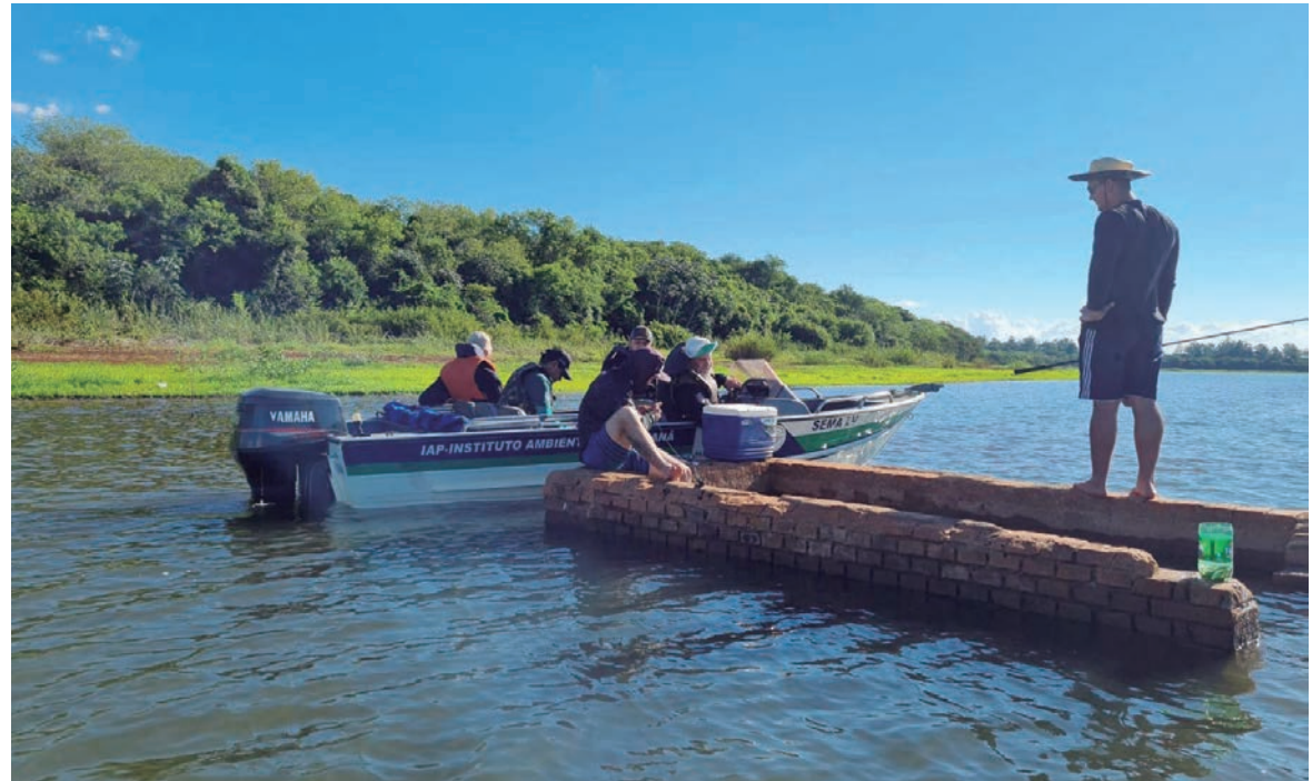
FORÇA -tarefa do Instituto combate crimes contra o desmatamento, pesca e caça ilegal, nas regiões Oeste e Noroeste do Paraná

O Instituto Água e Terra (IAT) divulgou ontem (quarta-feira, 19) o balanço de mais uma operação de força-tarefa durante o Verão Paraná – Viva a Vida. O objetivo foi identificar irregularidades no período da piracema, além da caça ilegal e crimes de desmatamento.