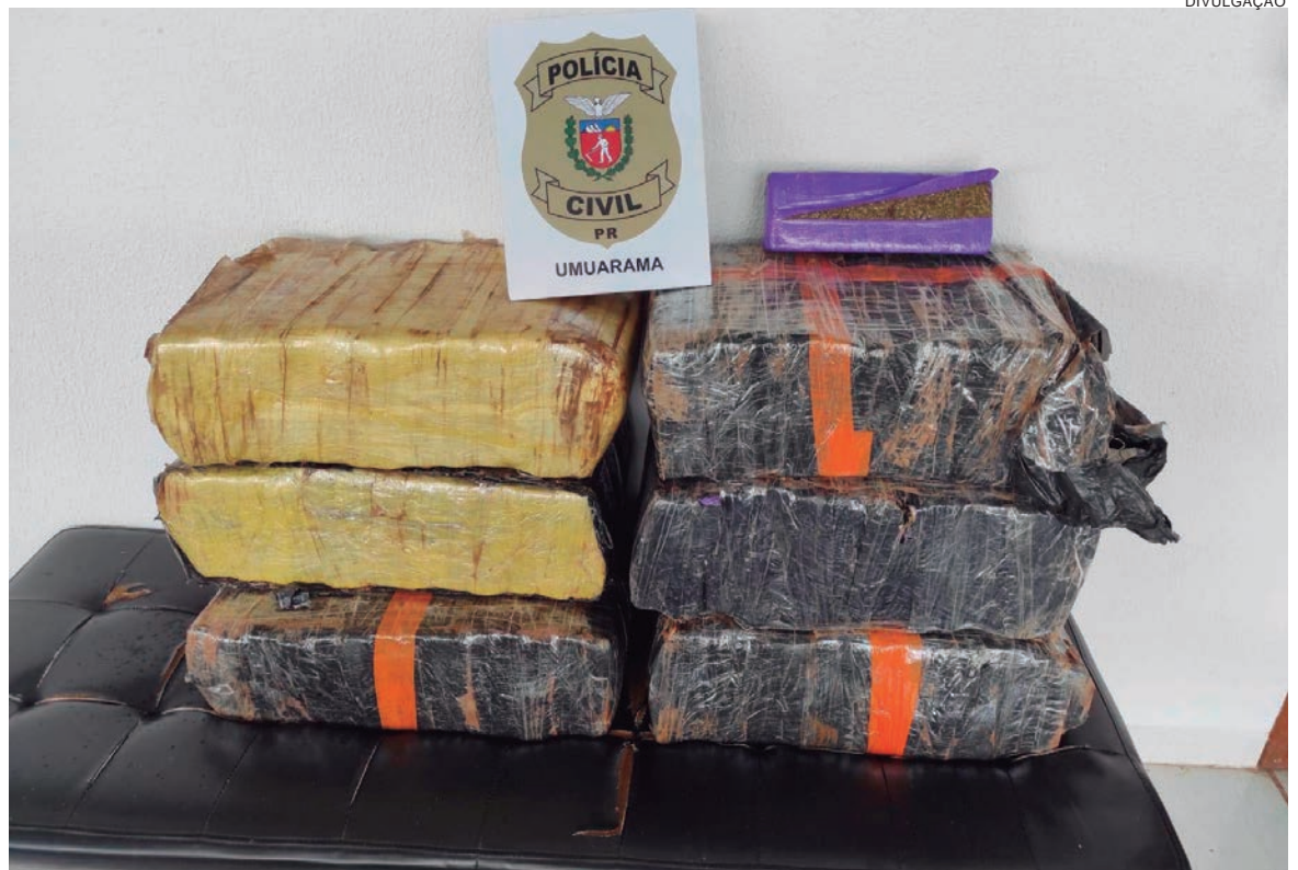
O homem detido revelou aos investigadores que havia adquirido toda a maconha na cidade de Pérola e faria a entrega em Umuarama

De acordo com o delegado chefe da 7ª Subdivisão Policial (SDP) de Umuarama, os trabalhos de investigação não pararam na apreensão da droga. "Os investigadores do GDE prosseguem nas diligências visando localizar demais integrantes de uma possível quadrilha de traficantes que está distribuindo drogas para toda a região", relatou Osnildo Carneiro Lemes.