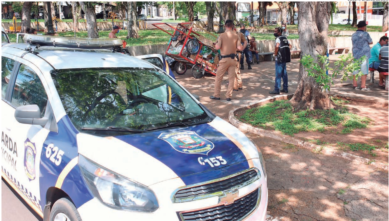
ATITUDES dos moradores de rua têm gerado reclamações de coação e ameaça, diante da negativa aos pedidos de esmola, geralmente é usado para o consumo de álcool

A situação é agravada pelo abuso de bebidas alcoólicas e entorpecentes. “Nossa equipe orienta e encaminha para os serviços de acolhimento disponíveis, como a Apromo (banho,