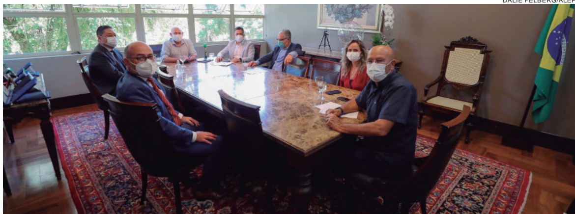
A diretoria da Federação apresentou à Alep proposta para transmissão na TV Assembleia do Campeonato Paranaense temporada 2022

EXTRAVIO DE ALVARÁ COMÉRCIO E REPRESENTAÇÕES LTDA ME, inscrita sob nº CNPJ 07.453.105/0001-45, estabelecido na Rua Amadeu Borges Neto, 515 – Parque Daniele, CEP 87506-450 cidade de Umuarama Estado do Paraná, comunica para os devidos fins o extravio de seu alvará nº 25.847/2005. Com esta publicação o mesmo torna-se sem valor legal e comercial.