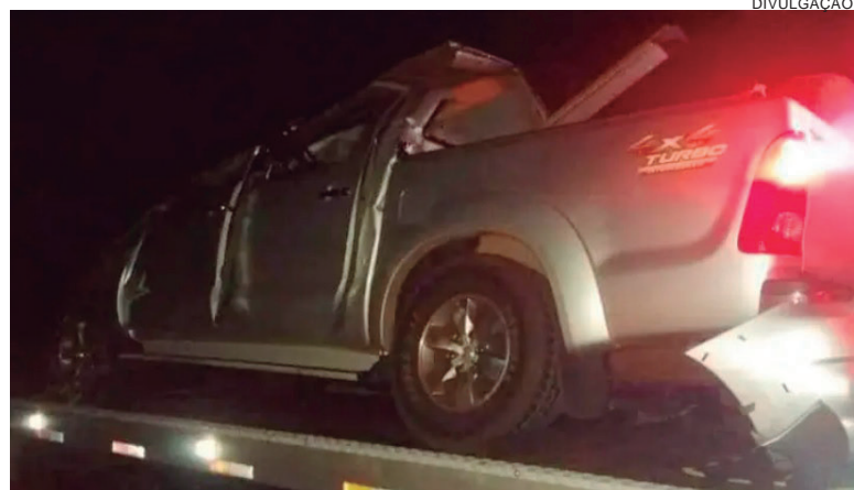
VEÍCULO que capotou foi guinchado ao pátio da Delegacia de Polícia de Pérola, depois que o corpo do motorista foi recolhido ao IML

O veículo capotou e o condutor morreu na hora. Já as ocupantes – três mulheres de 20, 21 e 28 anos ficaram feridas, duas em estado grave. Além delas, também havia uma criança de três anos no interior da Hilux. Esta sofreu apenas ferimentos considerados leves. Os sobreviventes foram levados ao hospital municipal de Pérola e o veículo foi recolhido ao pátio da delegacia de Pérola.