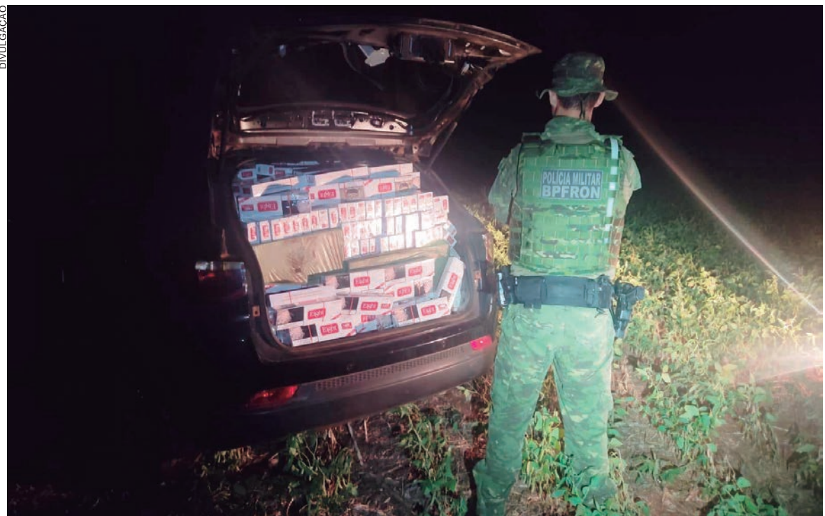
CARRO carregado estava abandonado em meio a uma mata dentro dos limites do município de Terra Roxa

Policiais que atuam na região de fronteira apreenderam ontem (sexta-feira, 21), um carregamento de cigarros contrabandeados do Paraguai. A ação integrada envolveu policiais federais PMs do BPFron, que realizavam patrulhamento na área rural de Terra Roxa, durante Operação Hórus. Ao passarem por uma região de mata, encontraram um veículo abandonado e carregado com os cigarros. Outros pacotes de cigarros contrabandeados foram encontrados nas proximidades. O veículo que tem emplacamento de Belo Horizonte/MG e o contrabando apreendido, foram encaminhados para a delegacia da Polícia Federal em Guairá. No total foram apreendidos 5.000 pacotes de cigarros contrabandeados.