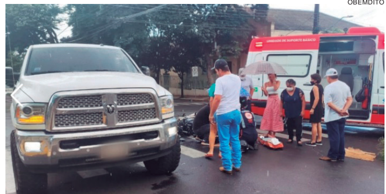
POPULARES protegiam os socorristas da chuva enquanto era prestado socorro à vítima ferida

trânsito do 25º Batalhão registraram o boletim de ocorrência de Polícia Militar (25º BPM) da ocorrência.