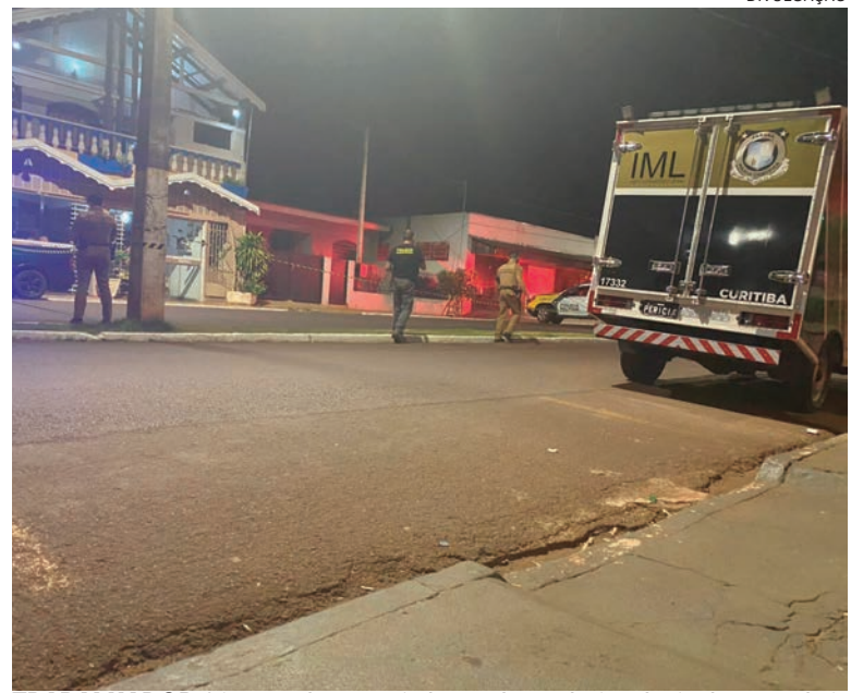
TRABALHADOR foi executado com mais de uma dezena de tiros de pistola na escadaria do hotel em Quarto Centenário

O crime ocorreu na Avenida Bandeirantes, em Quarto Centenário e, depois que uma perícia foi realizada, os policiais descobriram que a vítima foi assassinada com 11 disparos de arma de fogo. A prisão preventiva foi deferida pelo Poder Judiciário da comarca, após a conclusão das investigações pela Polícia Civil. Os detidos foram levados para a delegacia de Goioerê.