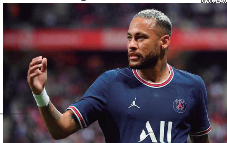
NEYMAR não entra em campo desde novembro do não passado pelo PSG

apareceu na lista de Tite para os próximos jogos da Seleção Brasileira nas Eliminatórias da Copa do Mundo. O PSG lidera o Campeonato Francês, com 50 pontos, 11 à frente do vice-líder do Nice. A expectativa é que o brasileiro retorne para o confronto contra o Real Madrid, pela Champions League.