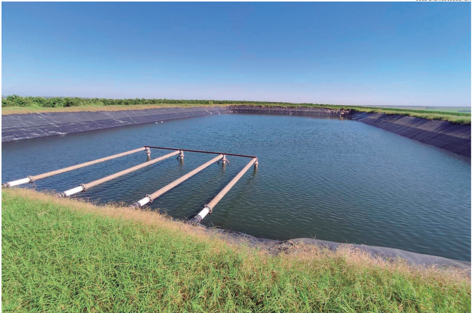
EM 2021, os contratos no PR totalizaram R$ 1,4 bilhão, com 29,5% destinado à produção agropecuária, e R$ 151 milhões a investimentos das cooperativas

O porte de investimentos destinados aos produtores