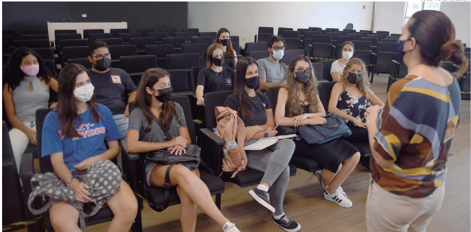
MAURIZA fez uma exposição da estrutura da Educação, detalhando a divisão das cerca de 9,5 mil crianças matriculadas na rede por faixa etária

Além de atender à necessidade do município, a parceria também aproximará os acadêmicos da atividade prática. “Será uma excelente oportunidade para eles aplicarem