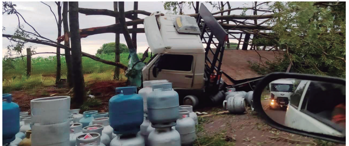
CARGA se espalhou pela pista, mas foi recolhida por populares ao ajudarem o motorista, que não se feriu

Motoristas que passavam pelo local e se depararam com o caminhão tombado, ajudaram o motorista a recolher os botijões e organizá-los ao lado do veículo para que não fossem causas de novos acidentes. Devido à força do impacto, a árvore foi arrancada. O local foi sinalizado em seguida, até a chegada de uma patrulha rodoviária estadual (PRE) que fez um levantamento oficial e registrou o acidente.