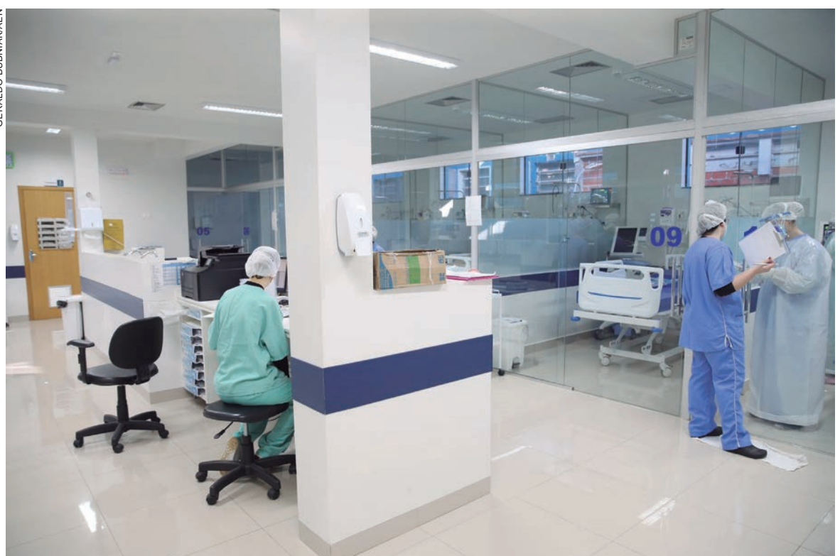
ENTRE quinta-feira (27) e sexta-feira (28), mais 162 leitos exclusivos para tratamento da Covid-19 e H3N2 foram reativados nos hospitais do Estado

“Sempre faremos todo ajuste possível nos leitos preferenciais para garantir atendimento rápido aos pacientes da Covid-19 que necessitem internamento, na busca da