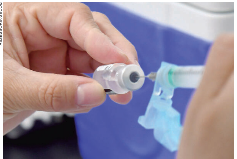
DOSES (D1) são destinadas a adolescentes a partir de 12 anos e adultos de qualquer idade

Jaqueline lembra ainda que gestantes, puérperas e lactantes devem apresentar declaração médica e, caso tenham