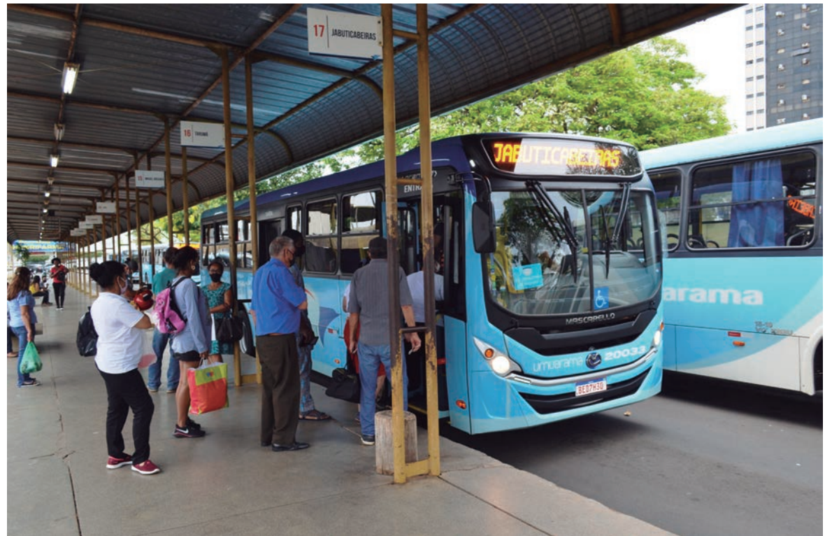
CONTRATO de renovação entre o Município e a empresa prestadora dos serviços foi considerado nulo pela promotoria

“Assim, verifica-se que apesar do Contrato Administrativo 062/2004, estar em plena vigência e execução, o Termo Aditivo 001, que prorrogou o contrato de concessão, é absolutamente nulo, a partir da sua assinatura, uma vez que um parágrafo da Lei Municipal nº 2.198/1999, que autorizava a prorrogação da concessão, sem nova licitação, já havia sido revogado por outra