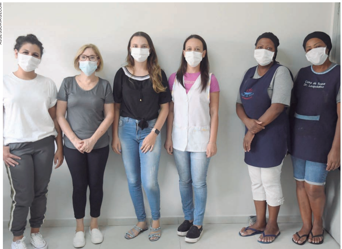
EQUIPE técnica capacita as cozinheiras da Casa da Sopa, que serve ao menos 120 refeições diárias a pessoas em vulnerabilidade e risco social

Finalmente Huana acrescentou que mais capacitações serão oferecidas a outras entidades assistenciais de Umuarama. “Estamos preparando um cronograma e vamos incluir todas as entidades cadastradas que manifestarem interesse em participar deste treinamento”, indica a nutricionista.