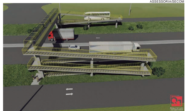
PASSARELA será implantada no ponto de grande movimentação de pedestres, tanto alunos da instituição de ensino IFPR, quanto trabalhadores daquela região

ponto é grande o movimento de pedestres, tanto alunos da instituição de ensino, quanto trabalhadores daquela região. “Garantir a segurança dessas pessoas é fundamental. Atravessar a pé a rodovia, naquele trecho, é realmente muito arriscado, desta forma, já que a rodovia está sendo duplicada neste momento, o secretário entendeu nosso apelo e tomará as providências junto ao governador Ratinho para que a obra seja iniciada o mais rápido possível”, relatou.