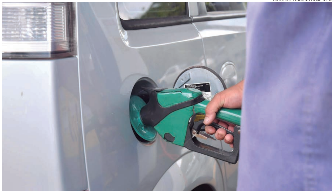
LEVANTAMENTO foi realizado em 44 postos de combustíveis da cidade. A gasolina mais barata, por exemplo, foi encontrada a R$ 6,49

Em janeiro o preço médio da gasolina estava R$ 6,57 e em fevereiro R$ 6,58, uma