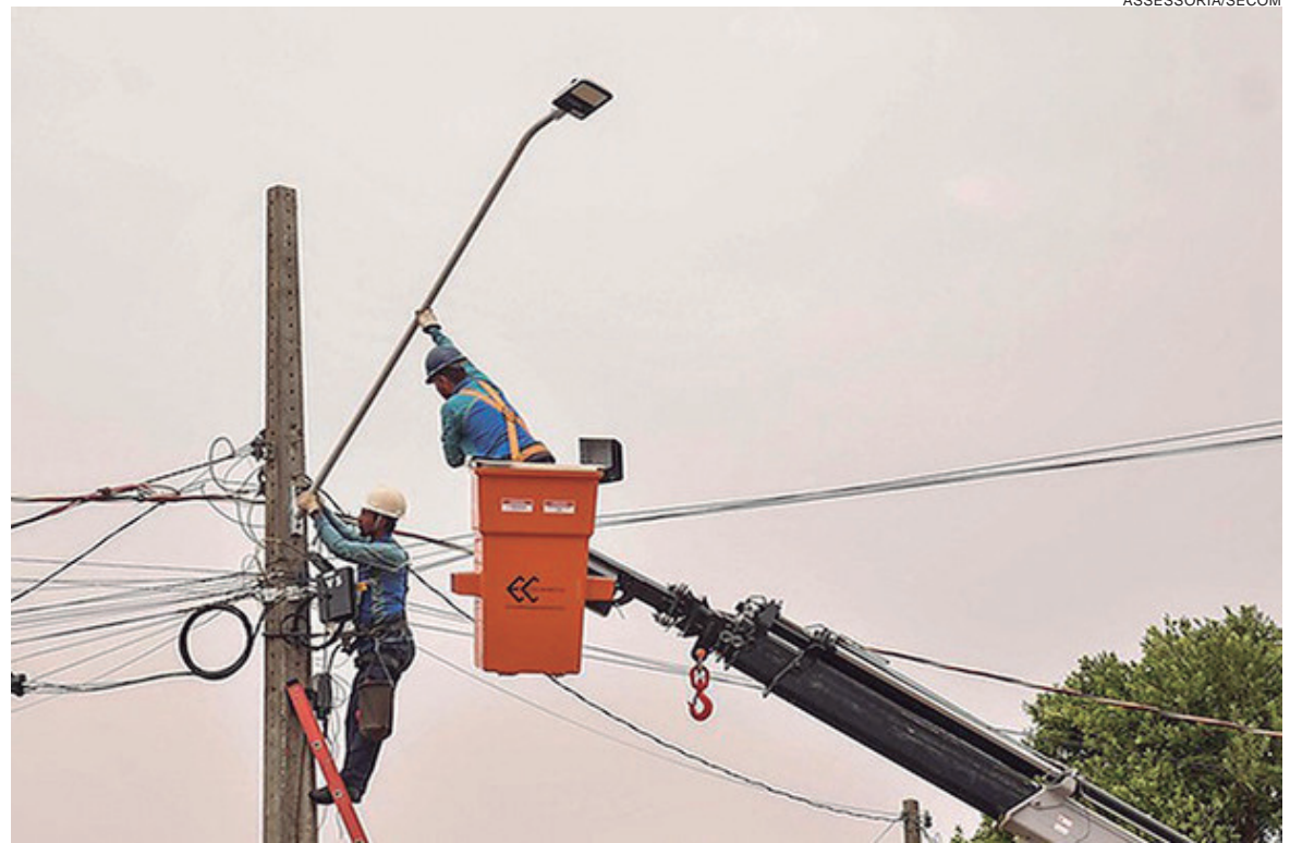
CONJUNTO Habitacional Sonho Meu, Residencial Ouro Branco e parte do Parque Irani serão contemplados logo no início do programa

Com cerca de 1.200 luminárias substituídas por meio desses dois contratos, chega perto de 50% a renovação da iluminação pública local. “Além de economizar energia elétrica, a modernização aumenta a eficiência do sistema e reduz os