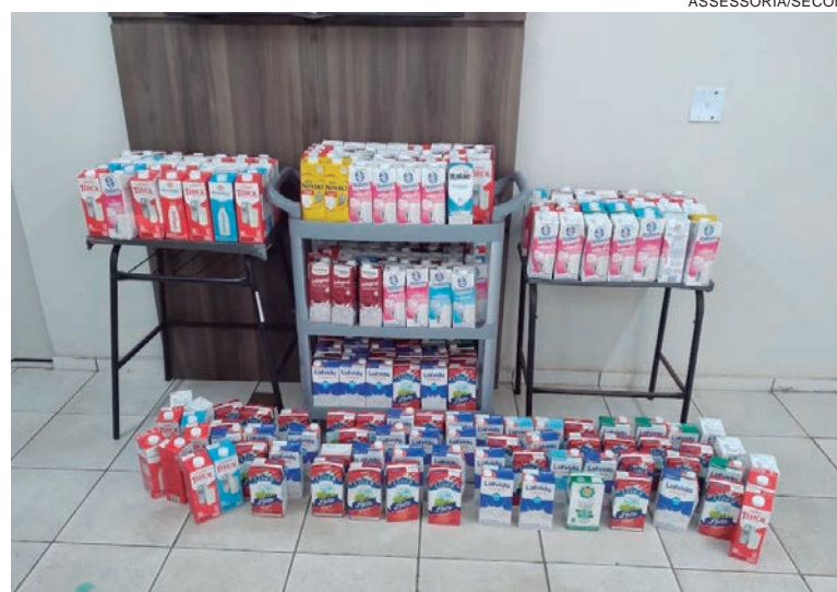
OS produtos foram arrecadados na inscrição dos competidores e serão destinados às famílias em situação de vulnerabilidade