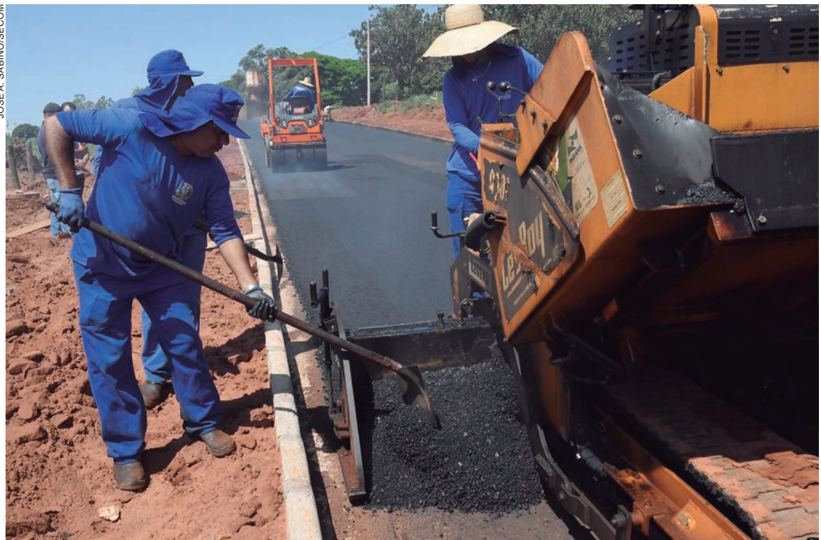
SÃO cerca de 800 metros de asfalto numa pista de oito metros de largura pavimentada com a vibroacabadora da Prefeitura

São cerca de 800 metros de asfalto. A pista tem oito metros de largura e está sendo pavimentada com a vibroacabadora da Prefeitura, que permite qualidade e acabamento de alto padrão. A estimativa de custo gira em torno de R$ 500 mil, barateado pela utilização de mão de obra própria. A previsão inicial de conclusão em janeiro foi atrasada por conta do período chuvoso e também de casos de covid-19 que