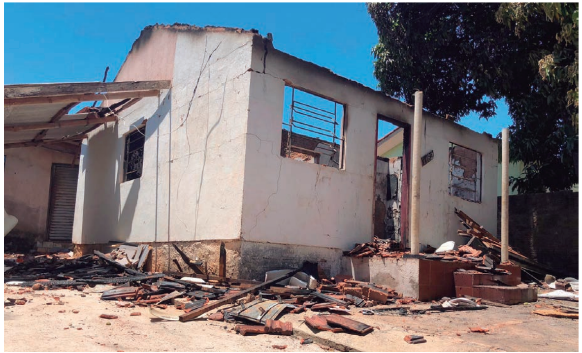
CASA ficou completamente destruída com o incêndio. Polícia acredita que possa ter sido criminoso, na tentativa de esconder assassinato da mulher