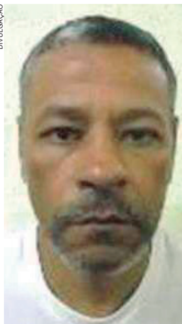
PRISÃO de mulher com caminhonete roubada terminou com a identificação do chefe da quadrilha que pratica roubos na região de Umuarama

No sábado (12), os marginais agiram em Umuarama, roubando uma Ford Ranger, que foi recuperada pela Polícia Militar em Iporã numa