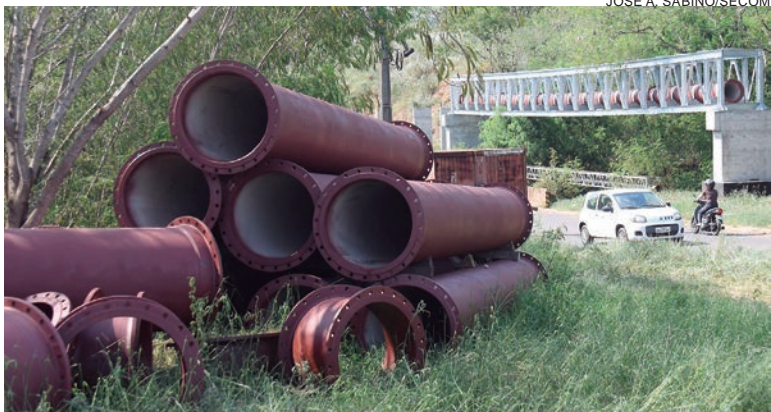
SANEPAR realizará obras preventivas na estrutura da adutora de água que fica embaixo da via