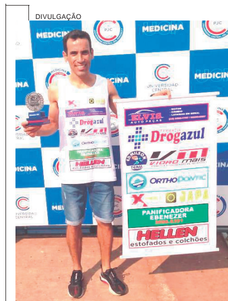
A ideia é treinar os idosos para formar equipes que possam competir na região e até representar Umuarama nos Jogos Estaduais do Idoso do governo do Estado