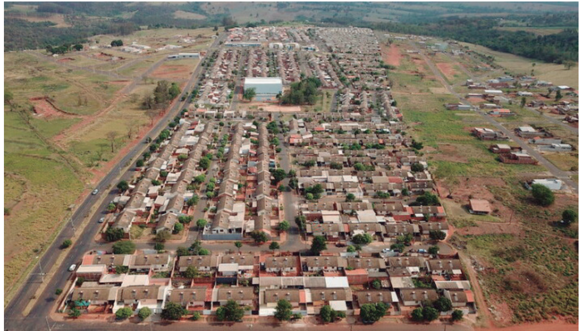
REPRESENTANTES da sociedade civil e de associações de moradores de todos os bairros, podem apresentar sua intenção de participar de assembleia pública

Após a ativação do Conselho Municipal de Habitação de Interesse Social, ele foi parte do Sistema Nacional de Habitação (SNHIS), integrando municípios, Estado e Governo Federal. “O SNHIS foi regulamentado pela Lei Federal nº 11.124 de junho de 2005 e é direcionado às famílias brasileiras que ganham de 0 a 10 salários-mínimos, priorizando a de baixa renda, que se encontra