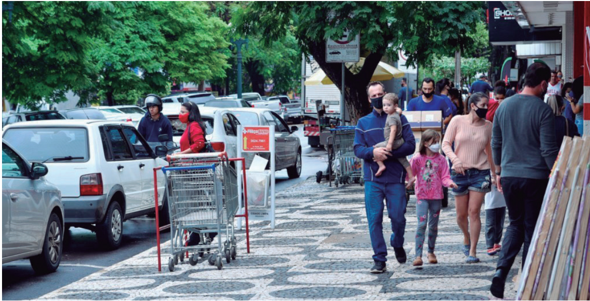
REUNIÃO entre Sindicatos Patronal e dos Empregados, definirá se o comércio funcionará normalmente na terça-feira de Carnaval