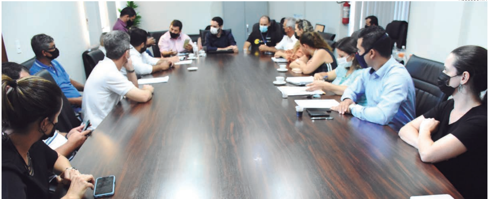
OS representantes da Viação Umuarama salientaram o momento difícil da empresa que tem dívidas de impostos, folha de pagamento e com o fornecedor de óleo diesel

Desta forma, a reunião convocada teve como propósito analisar quais fatores tem