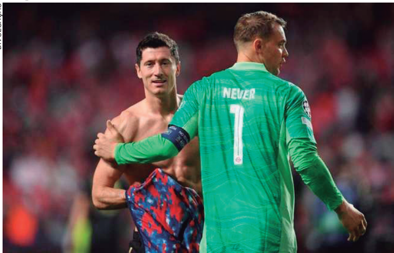
LEWANDOWSKI, à esquerda, e Neuer, à direita

Vale destacar que a carta já está em posse das autoridades, que também investigam o motivo dela ter sido entregue em Hamburgo, onde fica o St. Pauli. O porta-voz da Polícia de