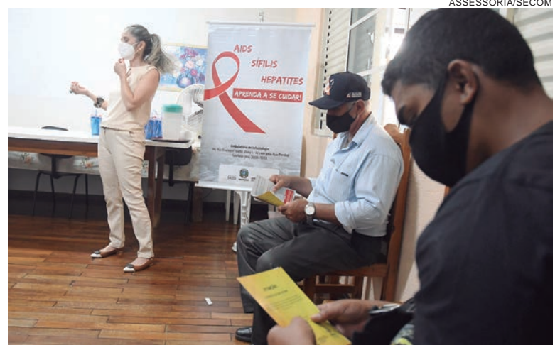
ALÉM da prevenção, a psicóloga abordou transmissão, vacinas e a importância da realização do teste rápido para o diagnóstico precoce das doenças

Além da prevenção, em sua explanação a psicóloga abordou transmissão, vacinas e a importância da realização do teste rápido para o diagnóstico precoce das doenças. “É importante esse encontro e