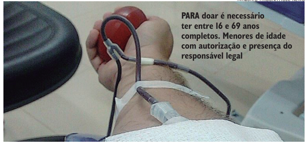
PARA doar é necessário ter entre 16 e 69 anos completos. Menores de idade com autorização e presença do responsável legal

Em Umuarama, o Hemonúcleo está localizado na avenida Manaus, 4444, no Centro Cívico. As coletas podem ser feitas de segunda a sexta-feira, das 8h às 11h30 e das 13h30 às 15h30.