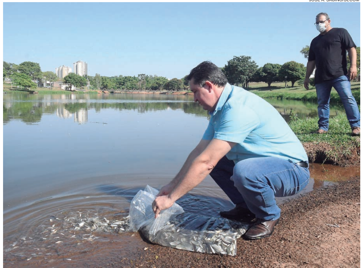
NESTA primeira etapa de repovoamento, prefeito anunciou a instalação de guarda-corpo em madeira tratada, no entorno dos lagos, para delimitar o espaço destinado à visitação