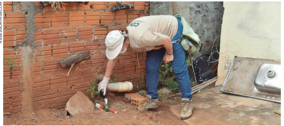
AGORA com 12 casos acumulados, a unidade Centro de Saúde Escola é a única de Umuarama em nível de alerta

Nesta semana o total de notificações subiu de 310 no último informe para 328, com a inclusão de 17 suspeitas da doença. Já foram descartados 267 casos suspeitos de dengue e 16 registros seguem em investigação, aguardando exames. Até o momento não houve óbitos, nem casos graves da doença.