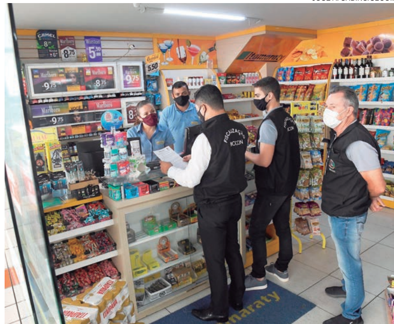
FISCAIS da Procuradoria verificaram detalhes nas notas fiscais de compra dos combustíveis nos postos averiguando se houve reajuste antecipado

O brasileiro foi surpreendido no final da tarde da quinta-feira (10) com a notícia de que os combustíveis teriam uma alta de ao menos 25%, fato que provocou a formação de longas filas nos pátios. Diante da situação, a Secretaria Municipal de Proteção e Defesa do Consumidor – Procon de Umuarama realizou uma operação para fiscalização de postos para apurar se algum deles havia cometido crime contra o consumidor, como reajuste antecipado.