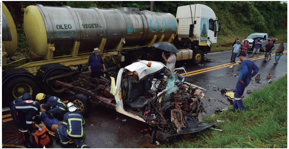
UMA das vítimas ficou presa às ferragens na Hilux. Outra vítima está na pista da rodovia. Ambas estavam na caminhonete e foram atendidas por socorristas

A Hilux pertence à empresa Gi100 Engenharia Elétrica, de Umuarama, prestadora de serviços para a Copel.