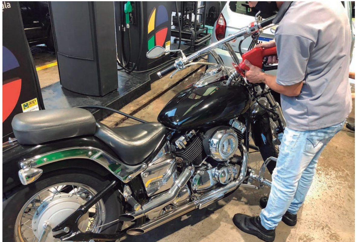
TEXTO aponta que os Estados terão de esperar 12 meses para reajustar a alíquota depois que a fixarem pela primeira vez

Atualmente, o ICMS sobre combustíveis varia de Estado para Estado e é calculado em toda a cadeia de distribuição e sobre um preço médio na bomba. A ideia é que o tributo passe a ter um preço