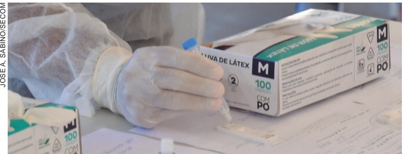
EM 24 horas a Tenda Covid realizou 65 consultas médicas e 132 exames antígenos, com 34 resultados positivos (25%) e 98 negativos (75%)

A Secretaria Municipal de Saúde informa diariamente a situação da pandemia de coronavírus em Umuarama. No informativo de ontem (sexta-feira, 11), 52 novos casos da doença foram confirmados, sendo de 25 mulheres, 20 homens e sete crianças. A média de casos desta semana ficou em 59 e novamente nenhuma morte foi oficialmente registrada, com um total de 339 óbitos.