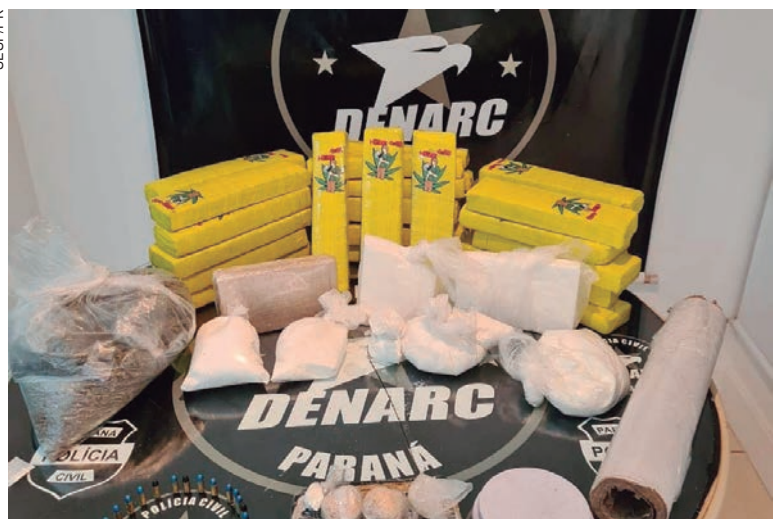
AS cidades onde mais foram apreendidos materiais ilícitos estão nas regiões Oeste e Noroeste do Estado

A região Oeste também entrou para o histórico de apreensões do Paraná. Em janeiro de 2021 foi feita a maior já registrada pelo Batalhão de Polícia de Fronteira (BPFron). Um depósito com 12,7 toneladas de maconha foi desmantelado pelos policiais e cinco pessoas acabaram presas em Toledo. Com esta apreensão, o prejuízo estimado causado ao narcotráfico foi de aproximadamente R$ 13 milhões.