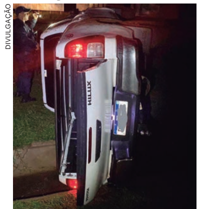
CAMINHONETE foi localizada tombada. Bandidos perderam o controle durante a fuga

Um morador de São Jorge de Patrocínio foi levado como refém durante um roubo registrado na noite da última quinta-feira (10). O idoso de 61 anos foi encontrado somente depois que os assaltantes capotaram o veículo que havia sido levado, no estado do Mato Grosso do Sul. O caso foi comunicado ao 25º Batalhão de Polícia Militar (BPM) de Umuarama.