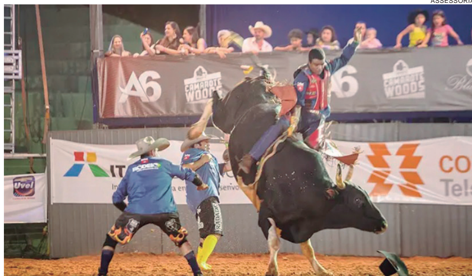
ATÉ quinta-feira, a entrada no parque será gratuita. A cobrança de ingresso acontece somente no encerramento do rodeio, domingo (20), com show de Lauana Prado

O show de Maria Victória, que não pode ser realizado no domingo (13), por conta da chuva, foi transferido para amanhã (quarta-feira, 16), às 19h, antes