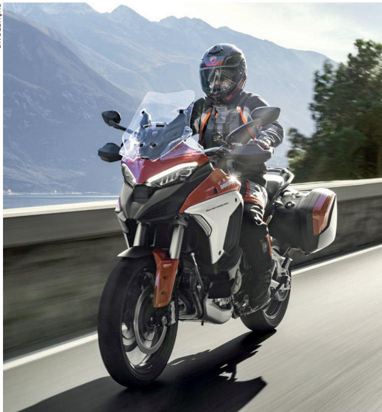
A nova Multistrada V4S confirma e amplia o conceito de “quatro motos em uma”

2010 foi a primeira “quatro motos em uma”, sendo a 1ª moto no mundo a contar com Riding Modes e que, comparativamente à versão de 2003, oferecia maior conforto tanto para o condutor quanto para