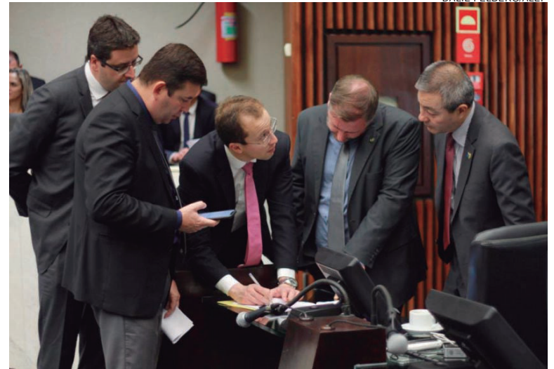
O projeto, protocolado no último dia 8, segue para análise das Comissões da Assembleia antes de ser analisado pelo plenário.

O primeiro passo para o desenvolvimento do Laboratório de Práticas Legislativas (LPLegis) foi dado ontem (14) com a assinatura de mais um termo de cooperação entre a Alep, por intermédio da Escola do Legislativo, e a Universidade Federal do Paraná (UFPR). Parceiras de longa data, as instituições atuarão de forma conjunta para fomentar a pesquisa acadêmica sobre as atividades e políticas públicas desenvolvidas pelos poderes legislativos estadual e municipal e também na capacitação