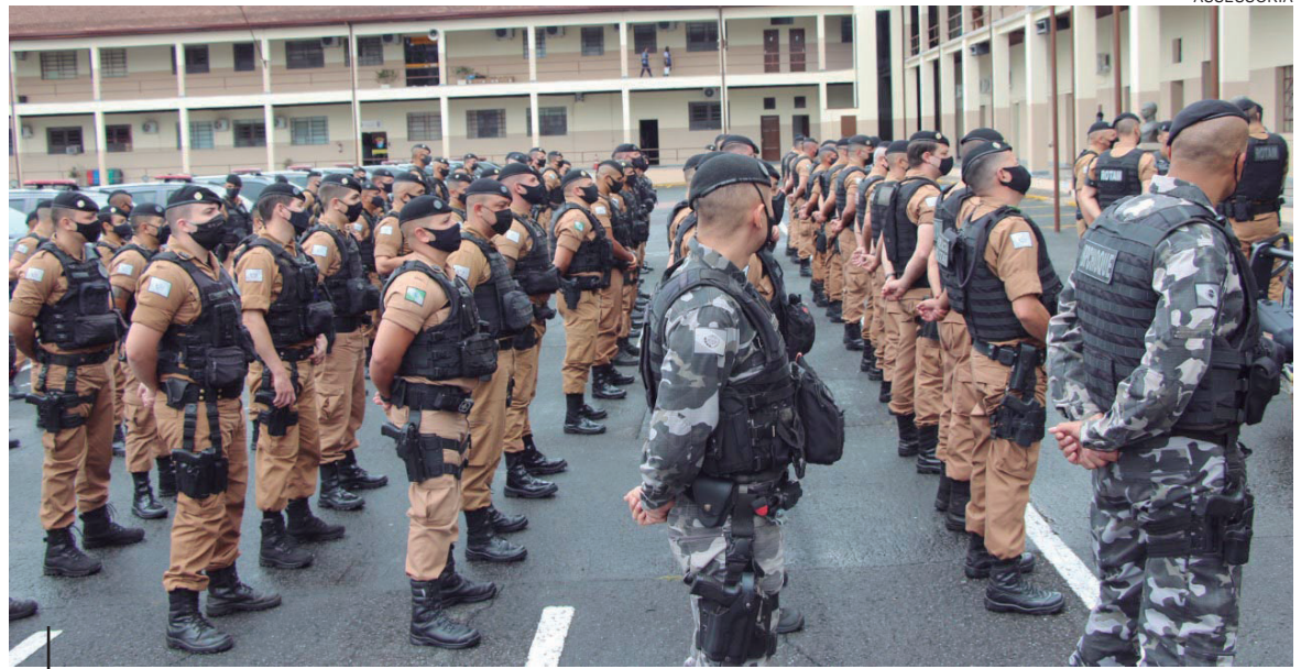
AÇÃO de segurança pública coloca mais de 80 policiais nas regiões Oeste e Noroeste do Estado para inibir crimes de alta periculosidade