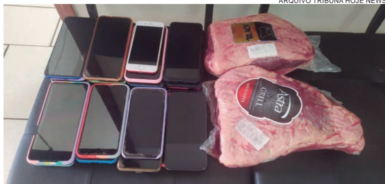
JUNTO com as peças de picanha furtadas, os aparelhos celulares que foram levados de vítimas de Umuarama

A vítima deverá comparecer com documento que comprove a propriedade do aparelho. Caso tenha ocorrido o extravio de nota fiscal ou documentos que comprovem a aquisição do aparelho, serão admitidas outras formas de prova da propriedade, tais como desbloqueio do aparelho mediante indicação da senha ou mesmo digital entre outros. Não foram realizadas prisões dos autores dos furtos, mas apenas a