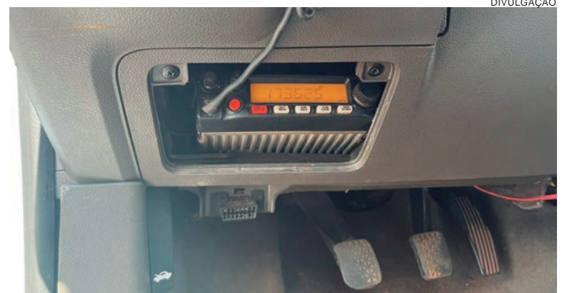
CARRO estava com rádio amador instalado no painel. Conductor fugiu a pé por um matagal à beira da pista

Durante um patrulhamento de rotina pela rodovia PR-323, perto da cidade de Perobal, patrulheiros rodoviários deram início a uma abordagem a um veículo GM Cobalt. O motorista fugiu e foi perseguido no sentido à Iporã, até que parou o carro na margem da pista e correu para um matagal. Ele não foi mais encontrado. Ao olhar dentro do