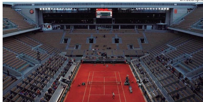
APÓS empate em 6-6, ganha o primeiro que fizer 10 pontos

Wimbledon tinha um tiebreak de sete pontos quando