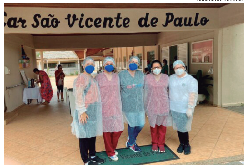
CADA equipe das unidades de saúde tem uma referência para ILPI e realizam semanalmente testagem para covid de todos os internos e funcionários

Para Rafaela, o avanço da campanha de vacinação contra a Covid é responsável pelo controle da pandemia, porém, a atenção ao público das ILPI deve sempre ser privilegiada. “Como atualmente temos a maioria da população com proteção vacinal parcial ou completa, com ao menos duas doses do imunizante, nos permite o início da flexibilização