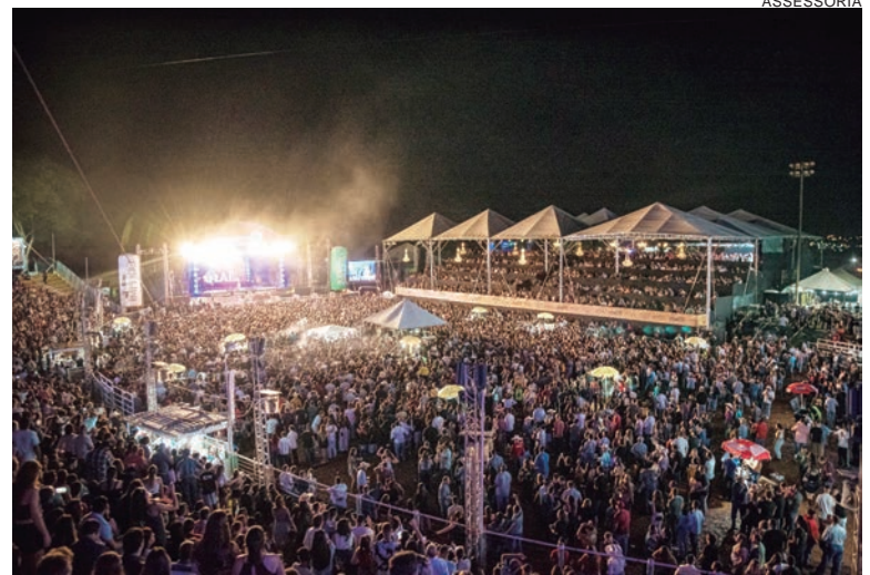
EXPECTATIVA da SRU era de receber entre 180 a 200 mil pessoas no parque de exposições nos 11 dias da feira. Negócios firmados podem ultrapassar os R$ 60 milhões