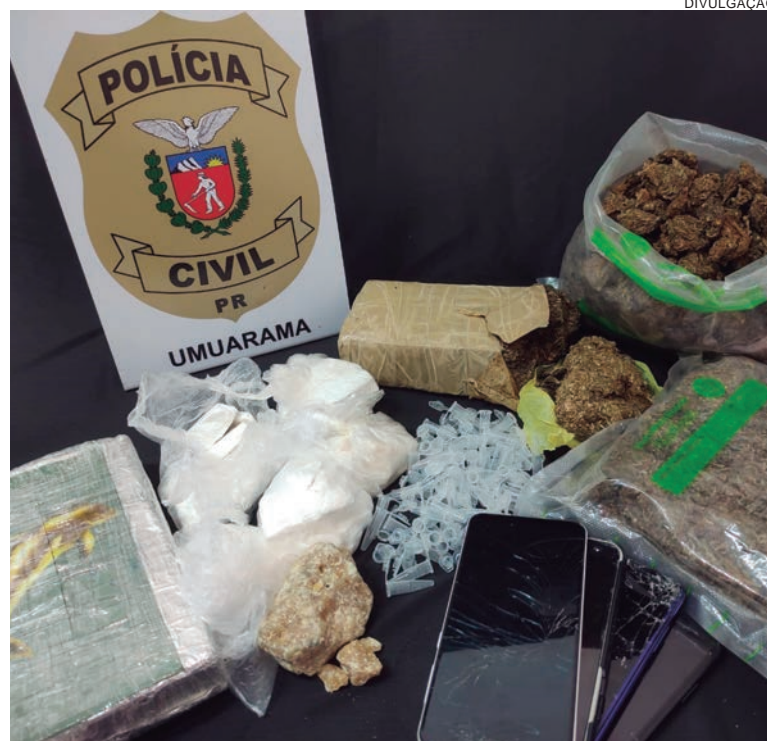
COCAÍNA, crack, maconha (murruga) foram apreendidos junto a telefones celulares que serão analisados por peritos

“O traficante tentou se safar alegando que a droga era da sua companheira, mas sua ficha criminal de 10 anos de cadeia não deixou dúvidas