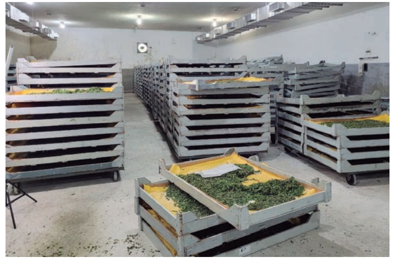
FORAM 910 caixas de larvas do bicho da seda descartadas, totalizando mais de 220 famílias de sericicultores no Paraná que tiveram sua renda mensal comprometida

São 61 municípios que apresentaram ocorrências de deriva de agrotóxicos impactando a Sericicultura em 2022.