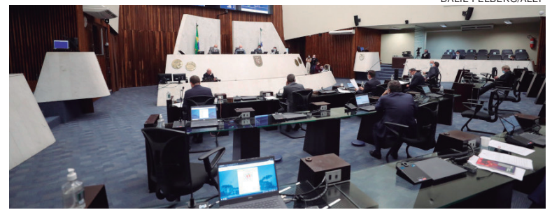
REAJUSTE de forma escalonada atende funcionalismo do Tribunal de Justiça, Ministério Público, Tribunal de Contas, Defensoria Pública e Poder Legislativo

O projeto de lei 38/2022, do Tribunal de Contas, dispõe sobre o reajuste dos valores dos vencimentos básicos dos servidores ativos e inativos do quadro efetivo, da