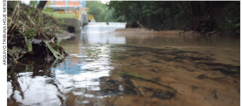
ARGUIVO TRIBUNA HOJE NEWS SANEPAR está fazendo um diagnóstico das condições ambientais, sociais e econômicas de 14 bacias hidrográficas do Paraná

Com o novo cenário da flexibilização do uso de máscaras em espaços abertos no Paraná, a vacinação contra a Covid-19, organizada pela Secretaria da Saúde (Sesa) e pelas 399 secretarias municipais, ganha um papel ainda mais importante. Quase 80% da população está com a cobertura vacinal completa, com duas doses ou a