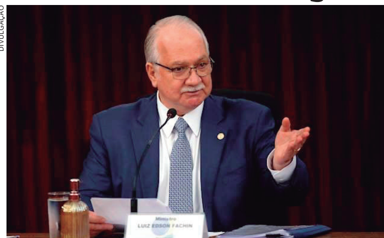
FACHIN afirma que o acordo poderá ser celebrado a título gratuito e não acarreta custos financeiros ou transferência de recursos entre o Telegram e o TSE

Também foi enviada por e-mail uma versão em inglês e em português do Termo de Adesão ao Programa de Enfrentamento à Desinformação, cujo objetivo é combater fake news relacionadas à Justiça Eleitoral, ao sistema eletrônico de votação e a todas as fases do processo eleitoral.