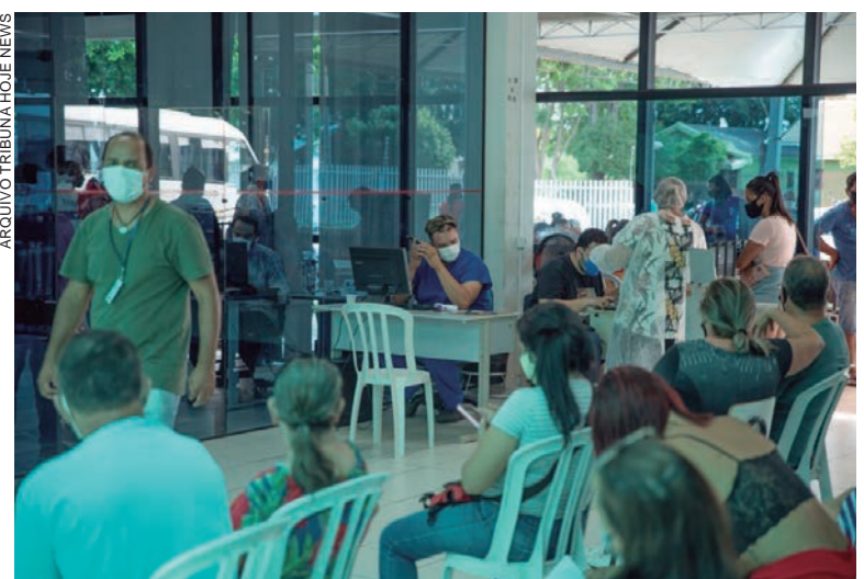
AMBULATÓRIO de Síndromes Gripais realizou realizadas 130 consultas médicas entre segunda-feira e ontem

O movimento na Tenda Covid (Ambulatório de Síndromes Gripais) em 24 horas foi bastante agitado: foram realizadas 130 consultas médicas e feitos 327 exames antígenos, os chamados testes rápidos, com 56 resultados positivos (17%) e 271 negativos (83%). O Boletim Covid divulgado ontem (terça-feira, 22) informou ainda que 65 novos casos da doença foram confirmados, sendo 27 mulheres, 30 homens e oito crianças.