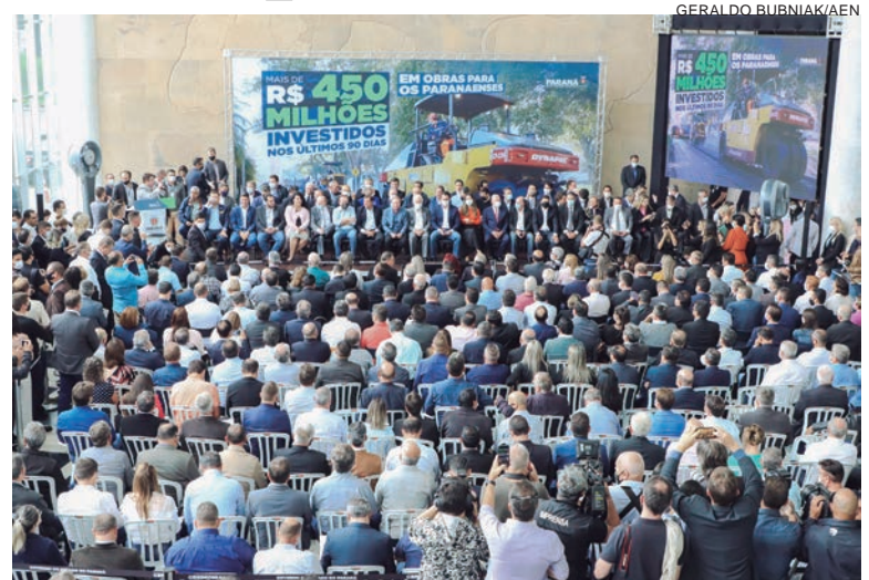
NO total, serão 620 ações para beneficiar a população de 284 municípios. Sendo que 533 delas serão realizadas a fundo perdido, por meio de transferência da Sedu

O parlamentar indicou recursos para reformas, construções, veículos e equipamentos para os municípios de Douradina, Goioerê, Loanda, Maria Helena, Nova Santa Rosa, Tapejara, Tuneiras do Oeste, Xambrê, Cafezal do Sul, Guaíra, Almirante Tamandaré, Alto Paraíso, Alto Piquiri e Quatro Barras. Só neste primeiro lote Cianorte foi contemplada com