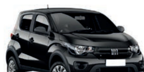
2º Prêmio: Fiat Mobi EASY 1.0 FLEX MANUAL, Ano 2021, Modelo 2022