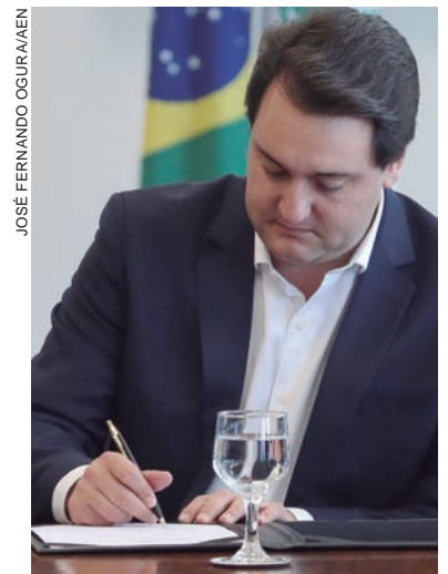
AS alterações levam em conta a legislação eleitoral, que exige a desincompatibilização de interessados no pleito de função na administração pública direta ou indireta