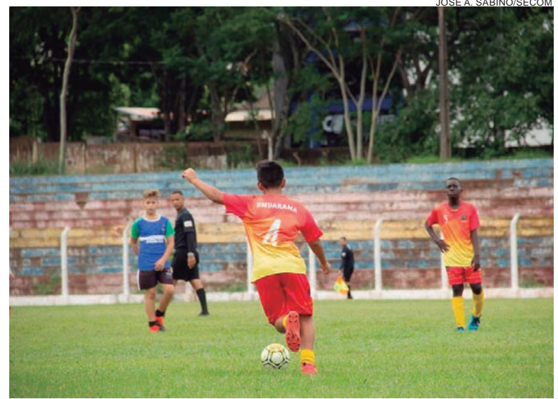
AS equipes de Umuarama enfrentaram times de Moreira Sales e os placares foram 3 a 0 na categoria sub-13, 5 a 0 na sub-15 e 2 a 0 na sub-17

Jefinho destacou o incentivo do prefeito Hermes Pimentel para o esporte, especialmente entre os adolescentes e jovens. “Essa é uma forma de aumentar os índices de pessoas ativas em nossa cidade. Só assim conseguiremos prevenir e vencer doenças provocadas pelo sedentarismo”, apontou.