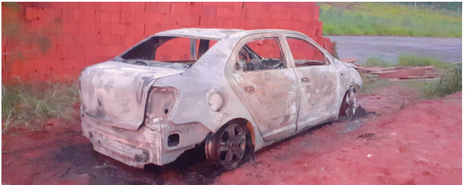
VEÍCULO encontrado destruído minutos depois da execução em frente à entrada da chácara de eventos Reguigá pode ter sido usado no crime