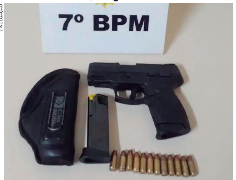
DONO da pistola divulgava nas redes sociais vídeos atirando com arma de fogo

Um rapaz de 22 anos foi preso pela Polícia Militar de Mariluz (cidade localizada a 39 quilômetros de Umuarama) portando uma arma de fogo.