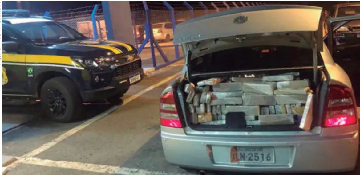
ANTES da legislação, a restituição dos veículos apreendidos no transporte de entorpecentes dependia de comprovação da origem lícita do bem

O presidente Jair Bolsonaro sancionou o projeto de lei que determina a apreensão de veículos usados no tráfico de drogas ilícitas, mesmo se tiverem sido adquiridos de forma legal. O texto foi aprovado pela Câmara dos Deputados em fevereiro deste ano, e aguardava apenas a sanção para entrar em vigor.