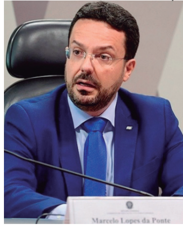
PRESIDENTE do FNDE, afirmou que seu nome e o do ex ministro, foram usados por terceiros