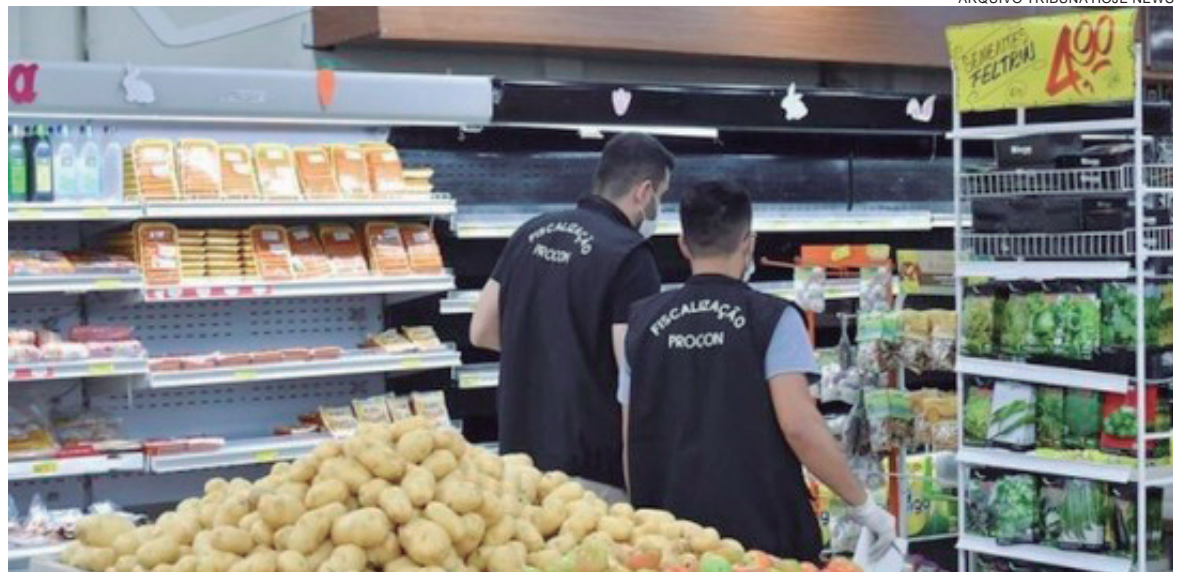
AS diferenças de preços de um produto semelhante entre um supermercado e outro pode chegar a 120%

Ele comenta que em março a pesquisa entre os produtos das marcas líderes indicou que o custo da cesta básica era de R$ 970,48, ou seja, houve um aumento médio de 5,8% em um mês. “Observamos que