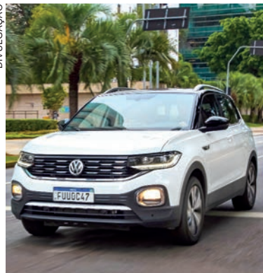
O T-Cross é líder geral em vendas no varejo em março, emplacando 5.390 unidades

O Volkswagen T-Cross está fazendo história! Em março, foi o carro mais vendido no varejo do Brasil, considerando todos os concorrentes de todos os segmentos do mercado brasileiro! O SUVW conquistou a liderança no consolidado de vendas no varejo, ao emplacar 5.390 unidades no mês passado. O feito reforça a preferência do consumidor brasileiro pelo modelo, que é referência em performance, espaço interno, conforto e