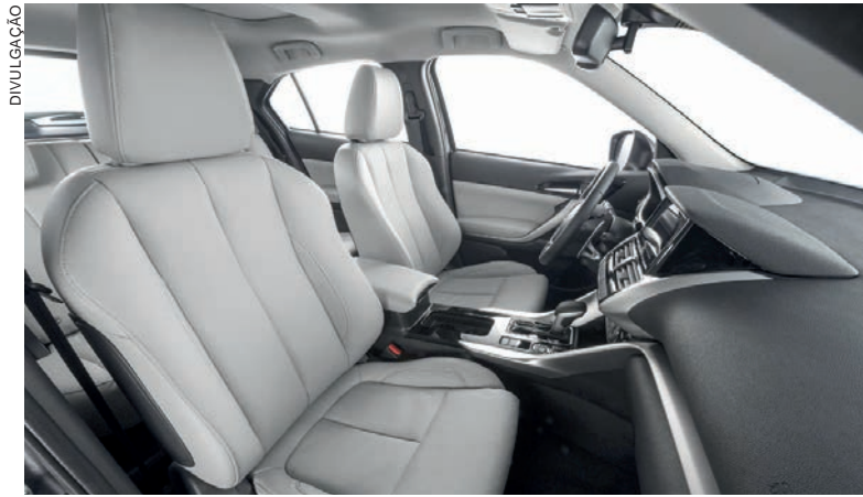
Nas versões HPE-S, S-AWC e HPE, os bancos dianteiros contam com ajuste elétrico e sistema de aquecimento para os dias de temperaturas baixas

permite aos clientes abrir e fechar o veículo somente por meio da aproximação da chave, que pode permanecer no bolso ou na bolsa. Para entrar no veículo, basta se aproximar – tendo a chave com você – e apertar um botão na maçaneta da porta do motorista.