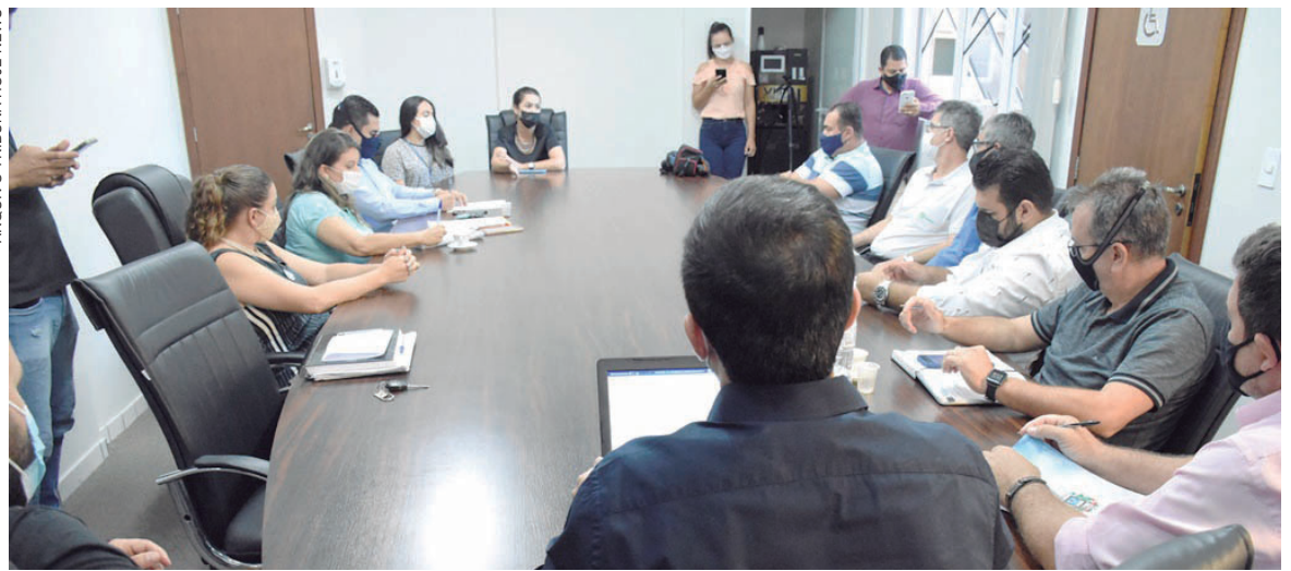
REUNIÕES já foram feitas na Câmara Municipal entre vereadores e representantes da empresa que presta o serviço na cidade