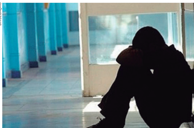
A proposta determina o fornecimento de indicadores à comunidade escolar sobre situações que caracterizem suicídio, automutilação e depressão

A matéria ainda visa proporcionar estratégias preventivas para solucionar conflitos, utilizando-se da interação com o meio para intermediar e superar as situações de risco; e fortalecer o vínculo entre professores e alunos, com momentos de reflexão que favoreçam a boa convivência, o