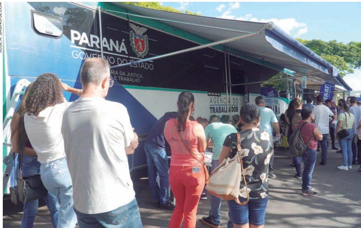
O Feirão reuniu representantes de empresas com vagas abertas, que enviaram profissionais de RH para entrevistar os candidatos no local

Mais de 360 pessoas tiveram a oportunidade de passar por entrevista de emprego durante a ação coordenada pela Agência do Trabalhador de Umuarama, entre as 9h e as 17h desta terça-feira (26). O 1º Feirão do Emprego reuniu representantes de empresas com vagas abertas, que enviaram profissionais de Recursos Humanos para entrevistar os candidatos no local. No total, mais de 500 pessoas passaram pelo evento.