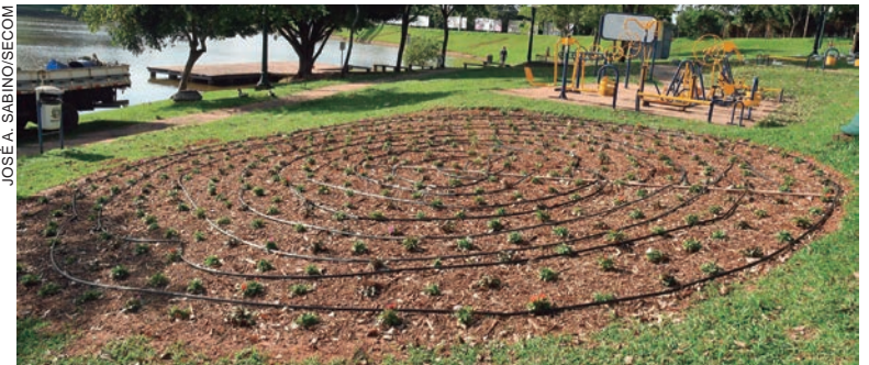
O lago ganhará um caminho de flores que vai contornar praticamente toda a sua orla, margeando o guarda-corpo em madeira, que será instalado nos próximos dias

O Lago Aratimbó começou a receber serviços de paisagismo, que vão embelezar ainda mais um dos pontos mais visitados da cidade. Nos próximos dias, as equipes da Secretaria Municipal do Meio Ambiente vão plantar cerca de 9.700 mudas de cinco espécies diferentes de flores, levando um colorido sem igual àquele cartão-postal de Umuarama. A maioria delas deve florir até junho, mês do 67º aniversário da cidade.