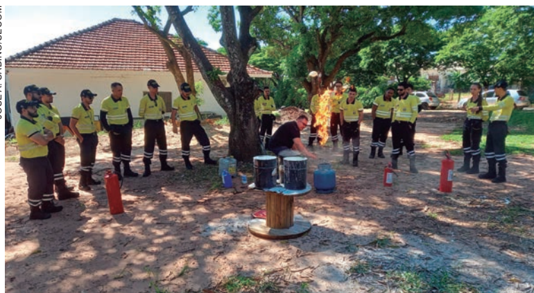
OS 17 agentes concursados serão nomeados ao final da preparação e já estarão aptos a orientar e fiscalizar o trânsito no município