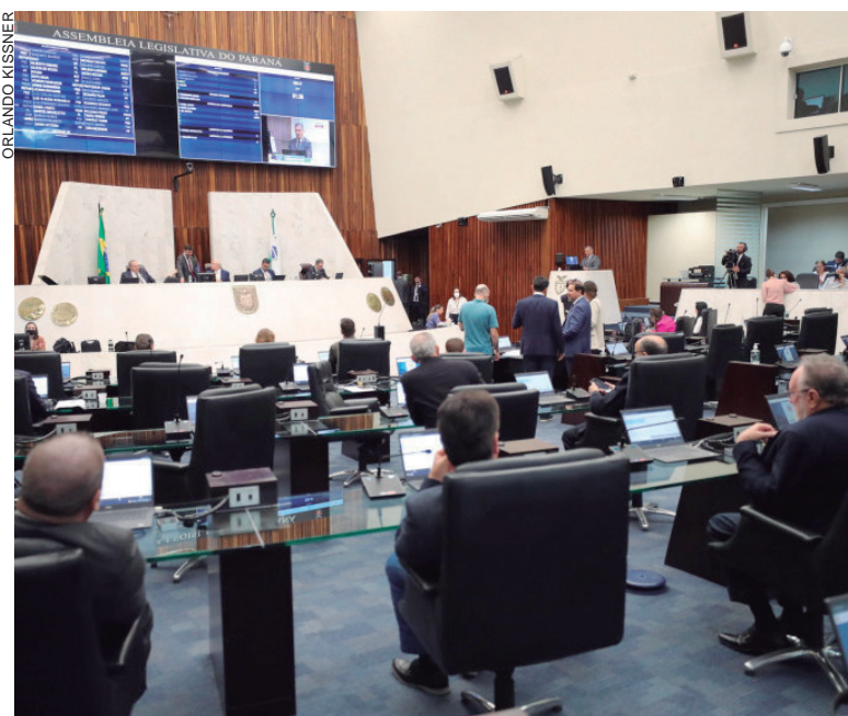
A maior parte dos recursos será destinada aos municípios que foram mais atingidos pelo período de estiagem

O texto do projeto prevê ao agressor a obrigação de