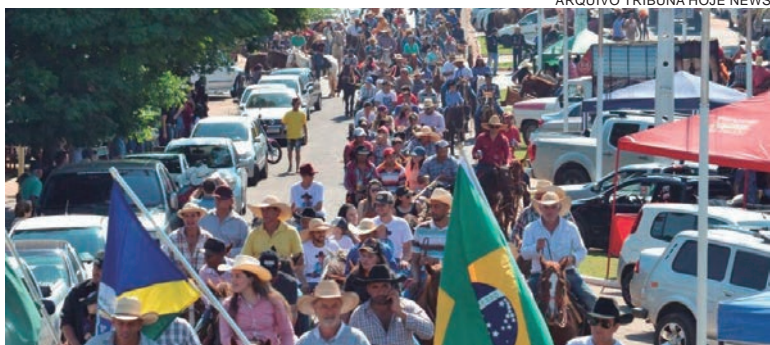
A cavalgada ficou tão conhecida que é citada no livro "Histórias do Paraná", que ressalta a sua notoriedade

Assim, iniciou-se a realização anual das cavalgadas, como símbolo de representação da cultura local. O evento "Cavalgada de Cafezal do Sul" passou a ser amplamente conhecido, atraindo vários turistas todos os anos. O evento acontece em apenas