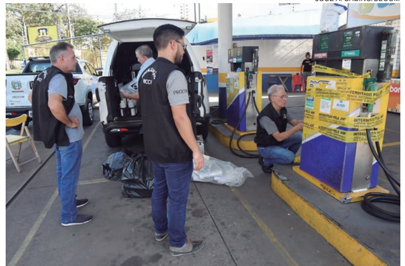
CONFORME o especialista, será feito um julgamento das circunstâncias que levou à infração, em que o posto terá a defesa analisada