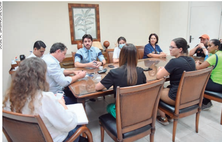
SINDICALISTAS e prefeito concordaram em protocolar um estudo de impacto financeiro para análise da Secretaria da Fazenda, a fim de embasar uma possível negociação

Salienta que “o Poder Público Municipal não se insurge contra o direito de greve, já que se trata de uma garantia constitucional”, mas quanto à “falta de legitimidade e legalidade da paralisação,