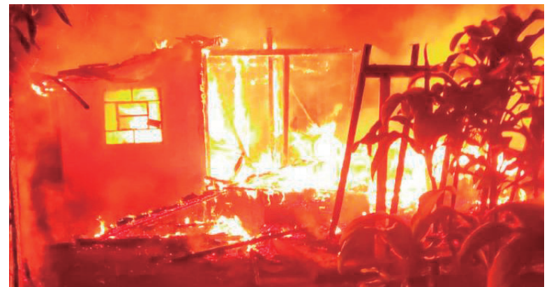
A residência em madeira ficou completamente destruída e morador foi encontrado morto dentro do imóvel

Investigadores da Polícia Civil e peritos do Instituto de Criminalística também estiveram no endereço. Após os levantamentos de perícia,